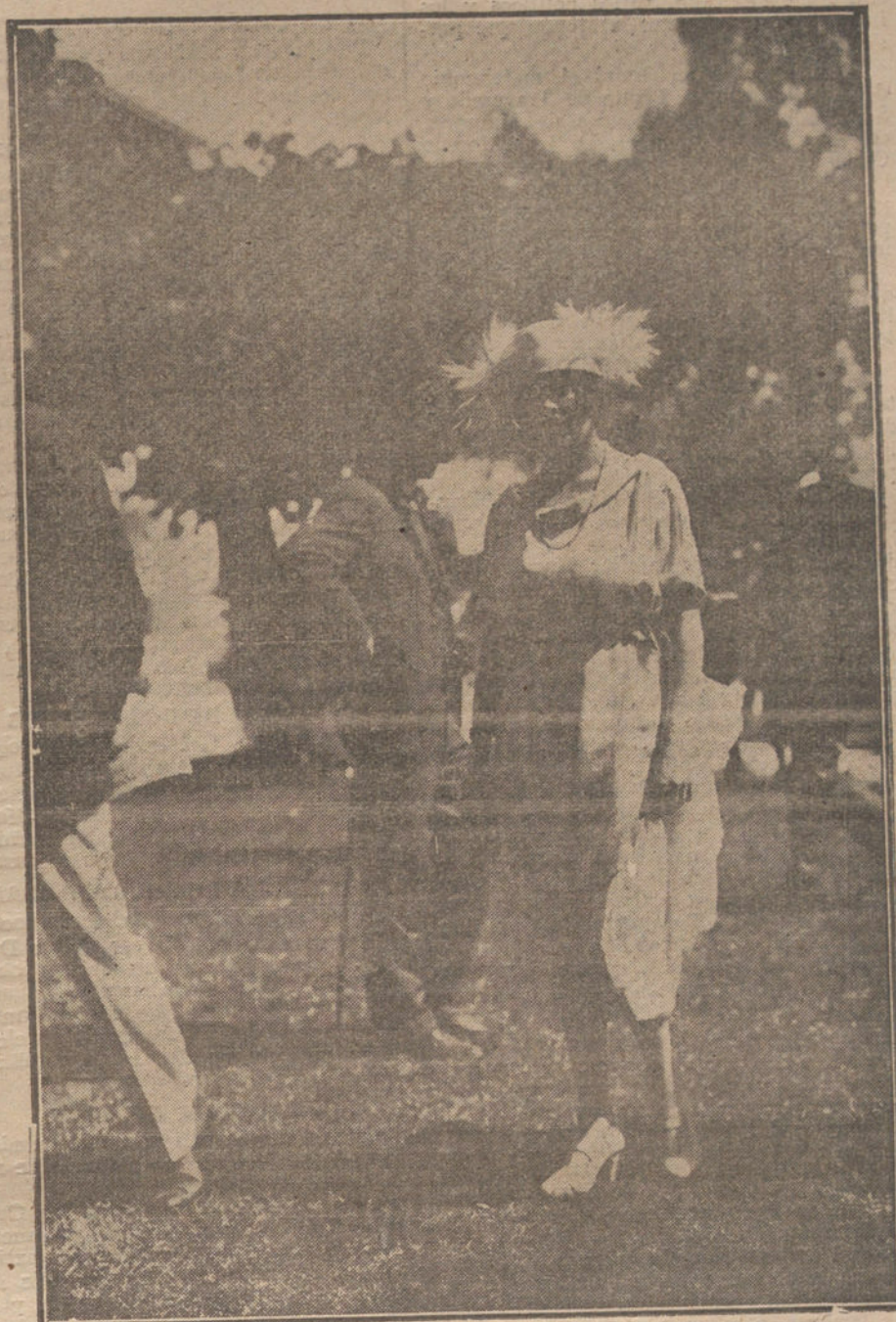
Uno de los modelos de traje que más han llamado la atención en las recientes carreras de caballos de París.