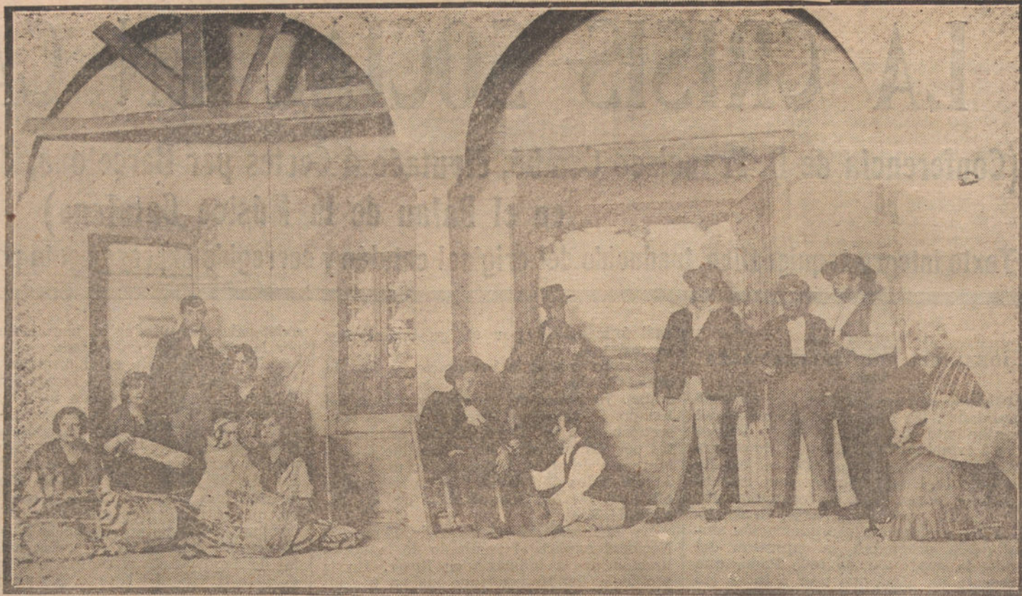
Una escena de la obra «Rocio, la Canastera», que se estrena hoy en el teatro de la Infanta Isabel.

Se reciben noticias de haber naufragado un barco pesquero en la costa Sur, perdiendo sus doce tripulantes.—Chovil.