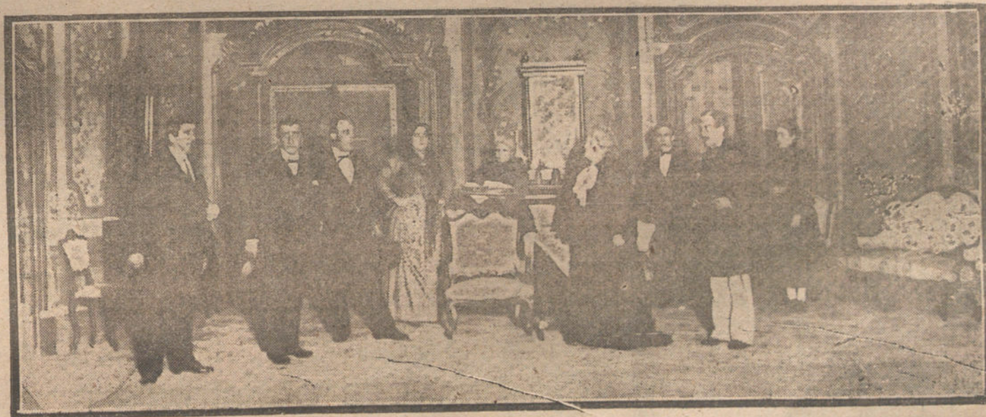
LA ACTUALIDAD EN BARCELONA.—Una escena del segundo acto de la comedia «La señora Marieta», Original del notable dramaturgo Ignacio Iglesias, estrenada con gran éxito en el teatro Romea.

NO SE DEVUELVEN LOS ORIGINALES GRAFICOS NADA MAS QUE EN EL CASO EN QUE PREVIAMENTE HAYAN SIDO ADQUIRIDOS CON VSA CONDICION.