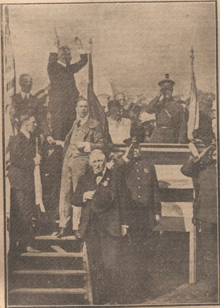
LOS REYES DE BELGICA. EN LOS ESTADOS UNIDOS.—La Reina Isabel (1) y el Rey Alberto (2) escuchando el himno nacional en el «Central Park», de Nueva York.

Quinta. Queda implantada la jornada de ocho horas. Las horas extraordinarias se pagarán con el 50 por 100 de aumento.