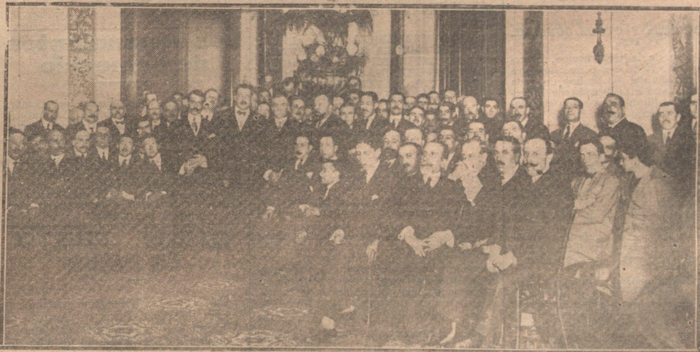
Recepción celebrada en el Ayuntamiento en honor de los miembros de la Asamblea nacional de funcionarios municipales.

Desde Madrid, los conjurados seguían atentamente el desarrollo de los acontecimientos, y, como se había previsto, los elementos que capitaneaba el Sr. Junoy, amigo de La Cierva, cumplieron el encargo de imponer al Congreso, por sorpresa, el «lock-out»; se hizo la manifestación á la Capitanía general, se pidió á voz en grito el apoyo del Ejército, se dejó aislado al gobernador civil y comenzó la batalla contra el Gobierno, á quien diariamente se insultaba con notas violentas, salpicadas con frases de mal gusto.