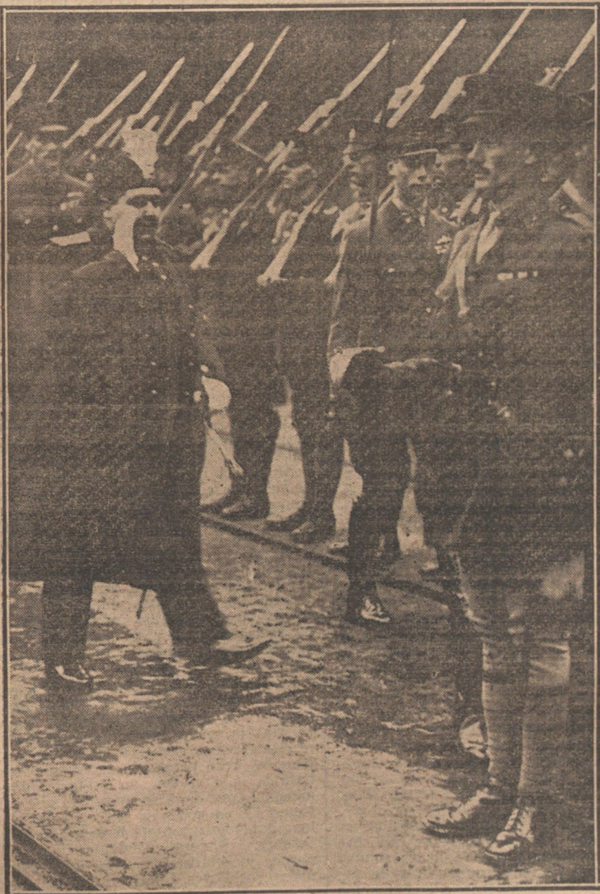
VIAJES DE SOBERANOS.—El Sha de Persia, a su llegada a Londres, acompañado del Príncipe de Gales, pasando revista a las tropas, que le rindieron honores.

También de provincias se reciben continuos ofrecimientos para secundar nuestra actitud inmediatamente