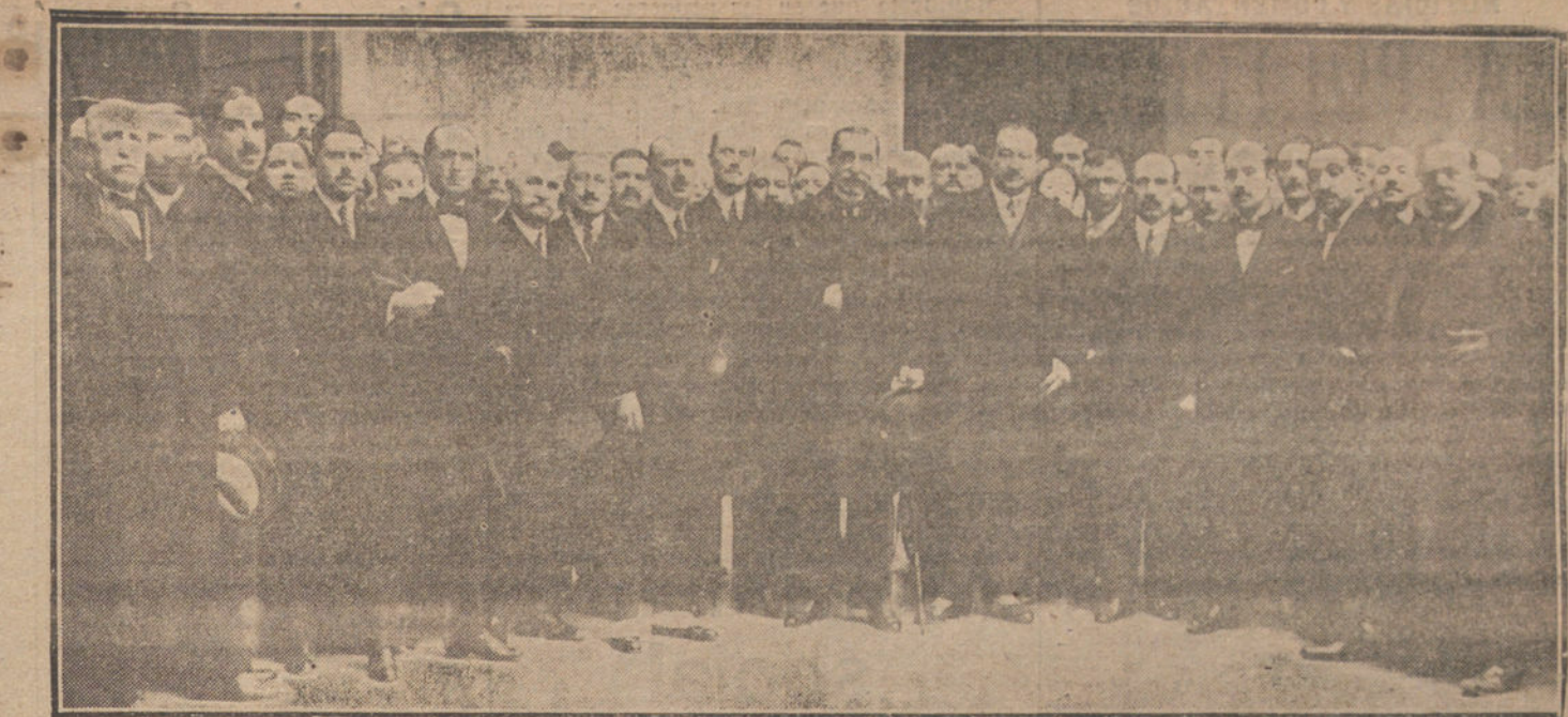
El ministro de la Gobernación y el alcalde, rodeados de los concurrentes á la sesión de clausura de la Asamblea de funcionarios municipales.

Visita de urgencia á domicilio, 102; Casos de urgencia en el Dispensario, 575;