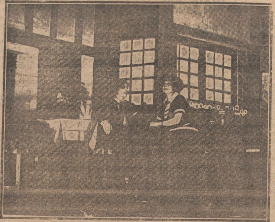
Una escena de la obra «Leonarda», estrenada anoche en el teatro de la Princesa.

Los rostros es lo que no queremos que nos vea ni la muerte en su hora de descomposición. Para evitar eso, yo proponería la máscara de oro sobre la muerte, una máscara como la que ya ha usado algún pueblo para sus cadáveres, máscara