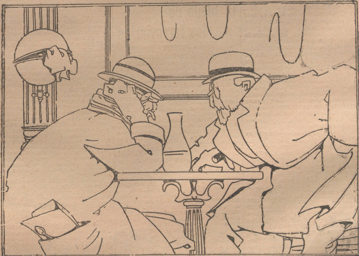
UNOS, ABSUELTOS, Y OTROS, CONDENADOS

Antes de que la reunión empezase había la impresión de que el lunes se plantearía el «lock-out».