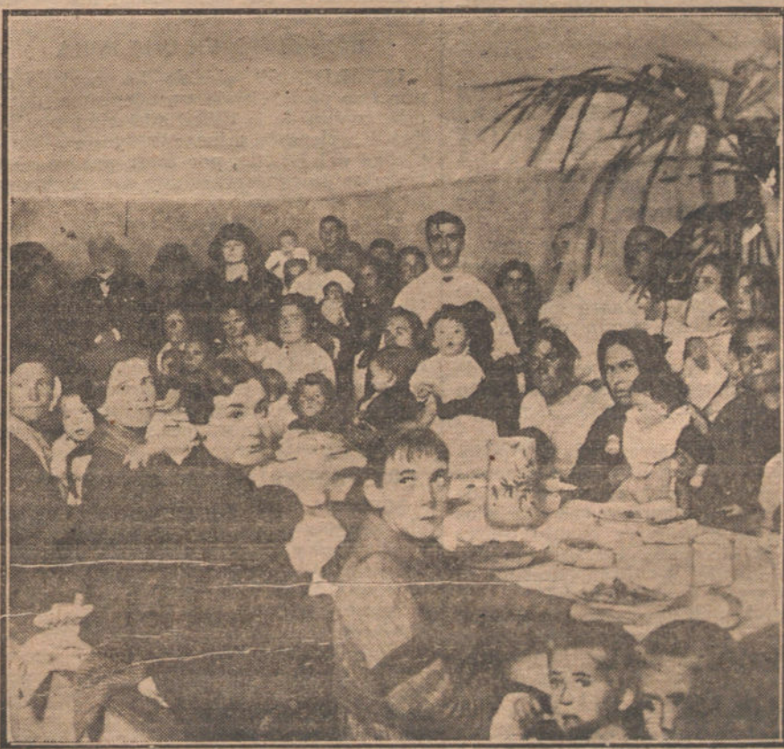
Inauguración de la benéfica Institución, «La Gota de Leche», acto celebrado ayer en el Gobierno civil de Madrid.

Acceder á simultanear el levantamiento del «lock-out» y de las huelgas sería participar de nuevo en la burda farsa contra la cual movilizamos nuestras fuerzas. Y como el problema que tan gravemente nos afecta no es de procedimientos y de susceptibilidad, sino que entraña el triunfo del respeto, de la mutua consideración y