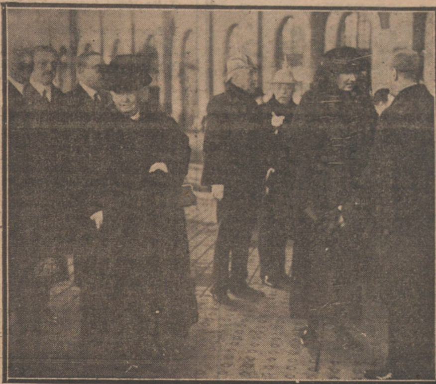
EL REGRESO DEL REY.—Sus Altezas los Infantes Doña Isabel y Doña Luisa, en el andén de la estación, esperando la llegada de Su Majestad.

NUMERO DEL TELEFONO DE LA REDACCION Y TALLERES DE «LA TRIBUNA», JARDINES, 4, 6 Y 8: 4.444.