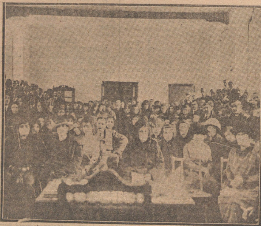
Asamblea del Magisterio Provincial Riojano, celebrada el día 9 del actual, en Logroño, con motivo del llamamiento que la Asociación Nacional del Magisterio ha dirigido a todos los maestros españoles.

Por otra parte, la Asamblea de huelguistas ha decidido publicar también otra hoja común para los periódicos socialistas. —Radio.