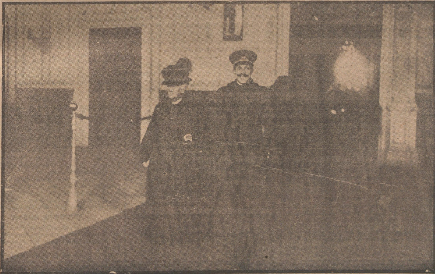
EL REGRESO DEL REY.—Su Majestad el Rey, acompañado de la Infanta Isabel, al salir del andén de la estación y pasar por la sala de espera para dirigirse al automóvil.

En todo caso, su candidatura será mantenida.—Radio.