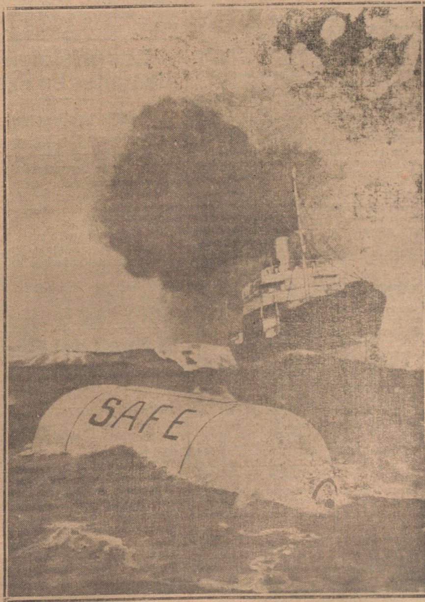
EL COFRE FLOTANTE, RECIENTE INVENTO PARA SALVAR LA CORRESPONDENCIA CONTRA LOS NAUFRAGIOS.—Este cofre ha sido adoptado ya por el servicio postal en los Países Bajos, y se usa en los vapores correos de la Compañía holandesa, haciendo el servicio entre Holanda y las Indias. Con un sello especial puede obtenerse esta ventaja en todas las oficinas de Correos de Holanda.