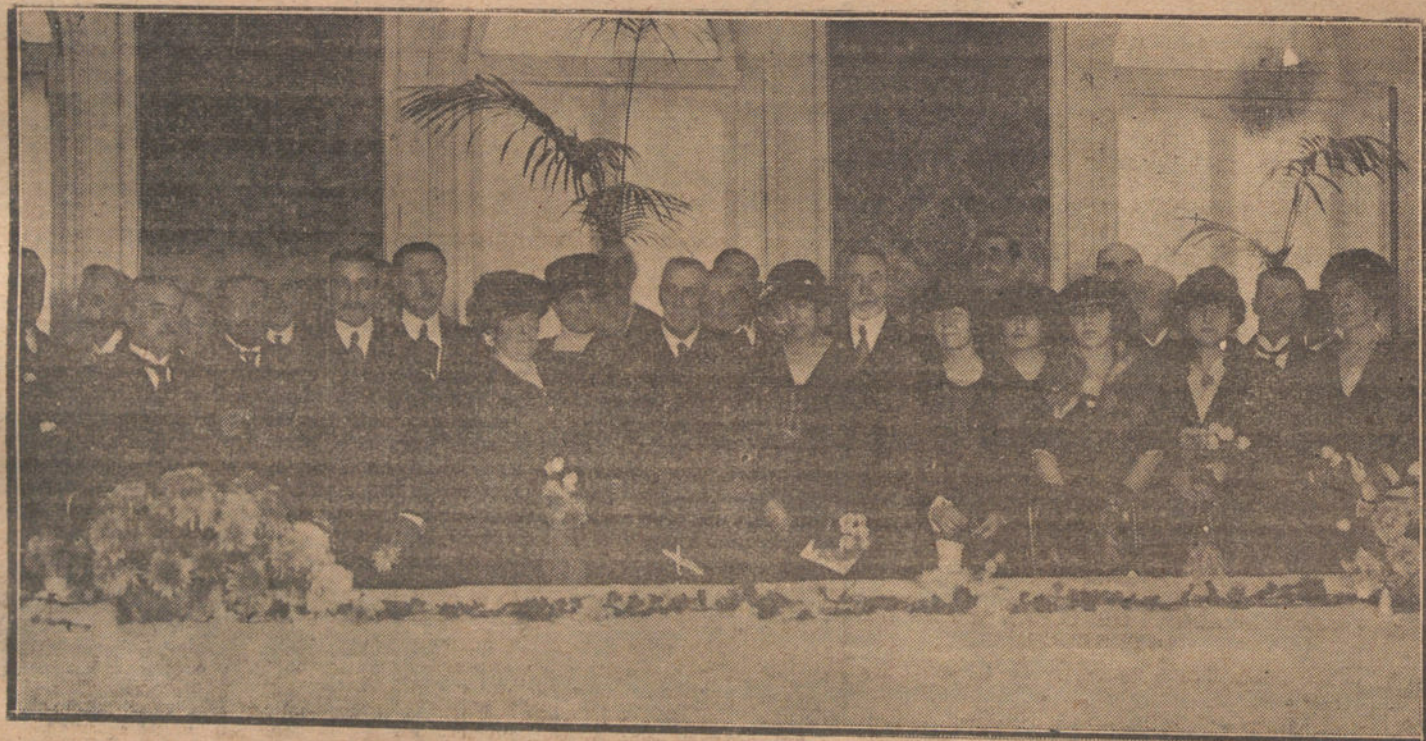
En Su Alteza Imperial, el Príncipe de Mónaco, presidiendo la primera sesión de la Conferencia internacional de investigación científica del Mediterráneo.

En cumplimiento de los artículos 445 y 446 del reglamento para la aplicación de la mencionada ley, los mozos del actual reemplazo y agregados al mismo que se encuentren sirviendo como voluntarios, pueden acogerse a los beneficios de la cuota militar, dentro del plazo que señala la Real orden circular del 8 del actual, cesando en sus compromisos como voluntarios cuando el reemplazo a que pertenecen sea destinado a Cuerpo, cambiando aquella situación por la de soldado de cuota, y debiendo reintegrar el importe de la primera puesta que se les haya facilitado, al entrar en posesión de los beneficios del capítulo XX, no siéndoles de abono para extinguir los cinco o diez meses de tiempo reducido, el servicio como voluntarios; pero quedarán dispensados de presentar el certificado de aptitud o de sufrir el examen prevenido en el artículo 280 de la ley.