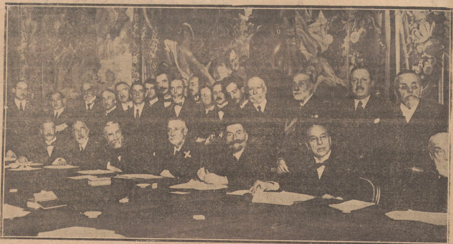
«Lunch» ofrecido por las autoridades de San Sebastián al Príncipe de Mónaco (x), a su paso por la capital donostiarra.