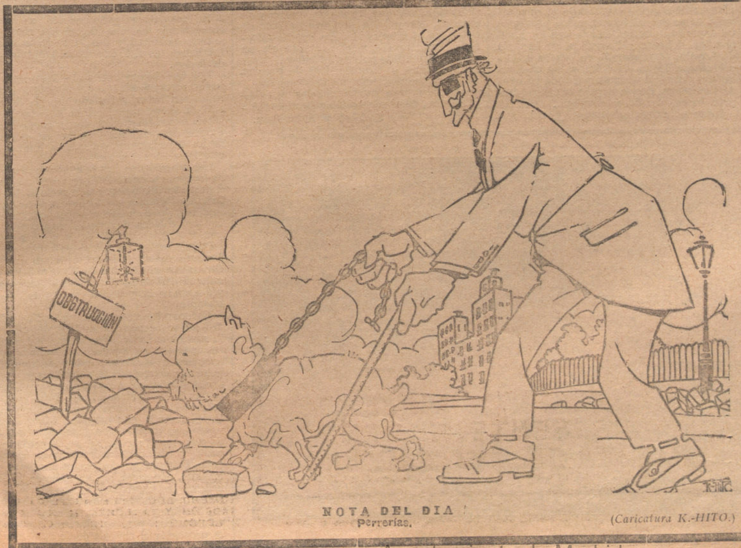
NOTA DEL DIA Perreras.

Los numerosos diputados que, formando grupos en los pasillos, comentaban los incidentes de la política, se ocupaban con preferencia del discurso pronunciado ayer en el Ritz por el Sr. Ossorio y Gallardo, dedicándole grandes elogios y considerando la conferencia del ex ministro maurista como un completo programa de partido.