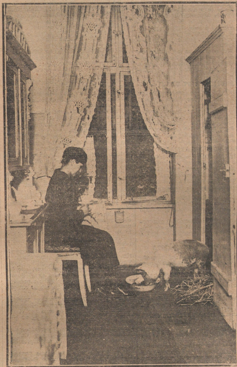
LA CARESTIA DE LA VIDA EN ALEMANIA.—Curiosa instantánea, en la que se ve a un pequeño cerdo, sustituyendo a los perros de lujo, medida útil que se ha adoptado en muchas casas, para hacer frente a la carestía de la vida.

Las palabras del ilustre estadista que encabeza estas columnas, dicen bien