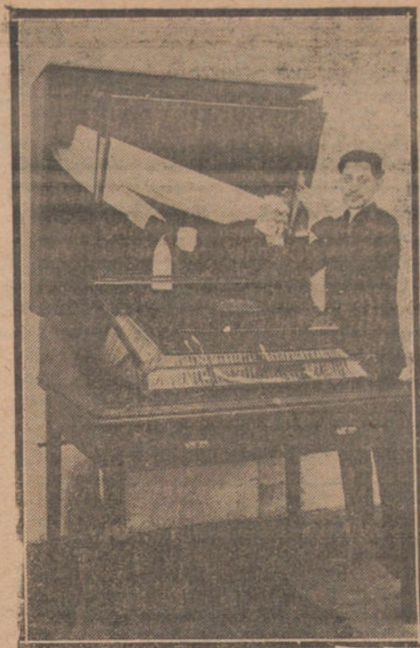
Valiosísimo álbum, que los españoles de la Argentina han regalado a Su Majestad el Rey, y que contiene más de 70.000 firmas.

Se recordará que el cargamento fué descargado por los mismos patronos. — Mencheta.