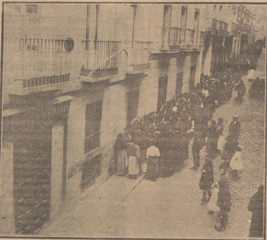
Cola formada esta mañana á la puerta de una tahona.

LA ASAMBLEA DE PANADEROS. CONCLUSIONES APROBADAS. LO QUE DICEN LOS OBREROS Y LO QUE AFIRMAN LOS PATRONOS. LA PROTESTA DEL VECINDARIO. ESCASEA EL PAN. COLA A LAS PUERTAS DE LAS TAHONAS. DECLARACIONES DEL ALCALDE. ALGUNOS INCIDENTES