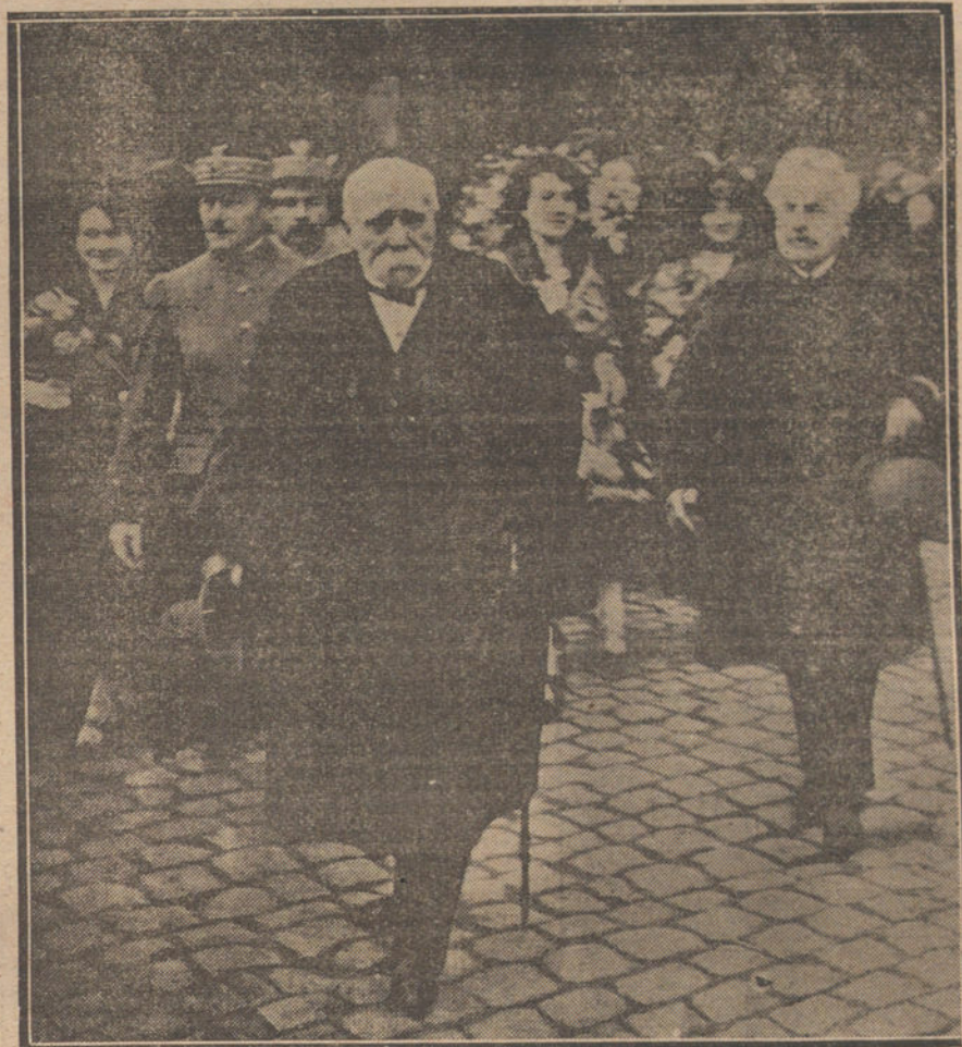
CLEMENCEAU EN ESTRASBURGO.—Llegada del presidente del Consejo de Francia, acompañado del general Humbert y M. Millerand.

Mientras gobernó el Sr. La Cierva, en Barcelona se mantuvo el estado de guerra, dentro del cual casi a diario se asesinaba a los patronos, los Sindicatos cobraban sus cuotas y eran más fuertes y poderosas las Sociedades obreras revolucionarias de lo que son hoy. El desbarajuste, la inmoralidad en los procedimientos de gobierno y el miedo a todo imperaba en aquellas horas tristes del Gobierno La Cierva. El Parlamento aparecía perturbado, y los escándalos que hoy promueve el político cacique desde los bancos rojos, los producía en iguales ó parecidos términos desde el banco azul. El señor La Cierva, y su discípulo el Sr. Góicoechea, llenaban de improperios a los que se atrevían a protestar de los procedimientos electorales del Gobierno. Fué aquél un espectáculo tan vergonzoso como el que está dando en la ac-