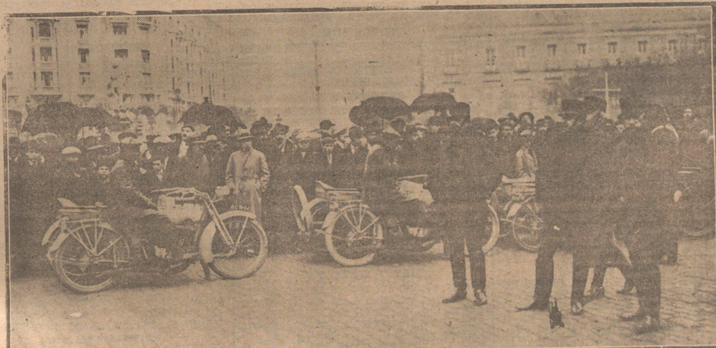
DE LAS MANIOBRAS MILITARES.—El capitán general Sr. Aguilera (x), dando instrucciones para el desfile, en el paseo del Prado.

Contra un grupo de oficiales y soldados, en el que se encontraba Koltchack, se arrojaron numerosas granadas de mano. Resultaron seis soldados muertos y doce heridos.—Radio.