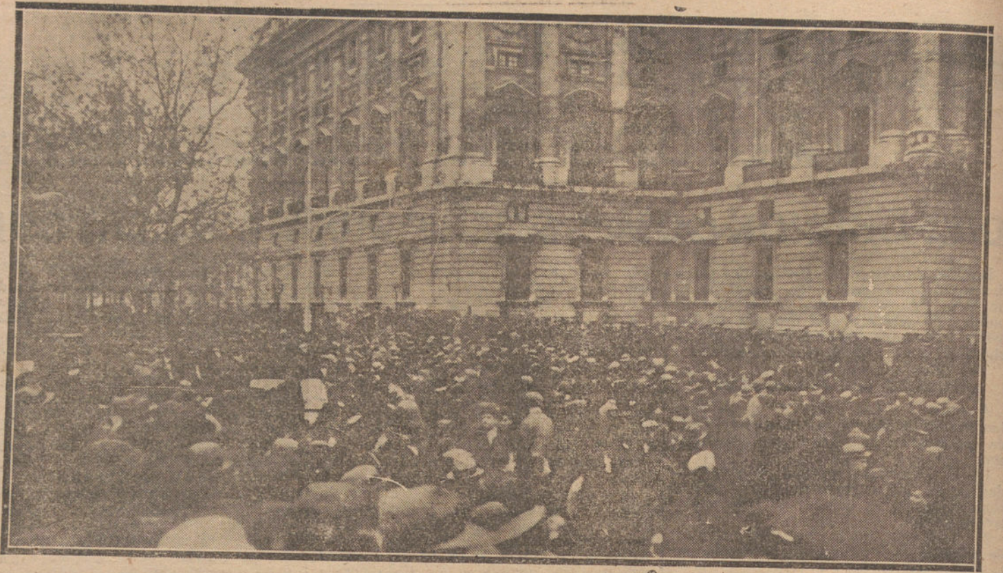
Desfile ante Palacio de las fuerzas de la guarnición, que tomaron parte en las maniobras militares de ayer.

D) Las disposiciones de la presente ley no implican derogación del régimen económico establecido para la Universidad de Murcia por el artículo 19 de la ley de