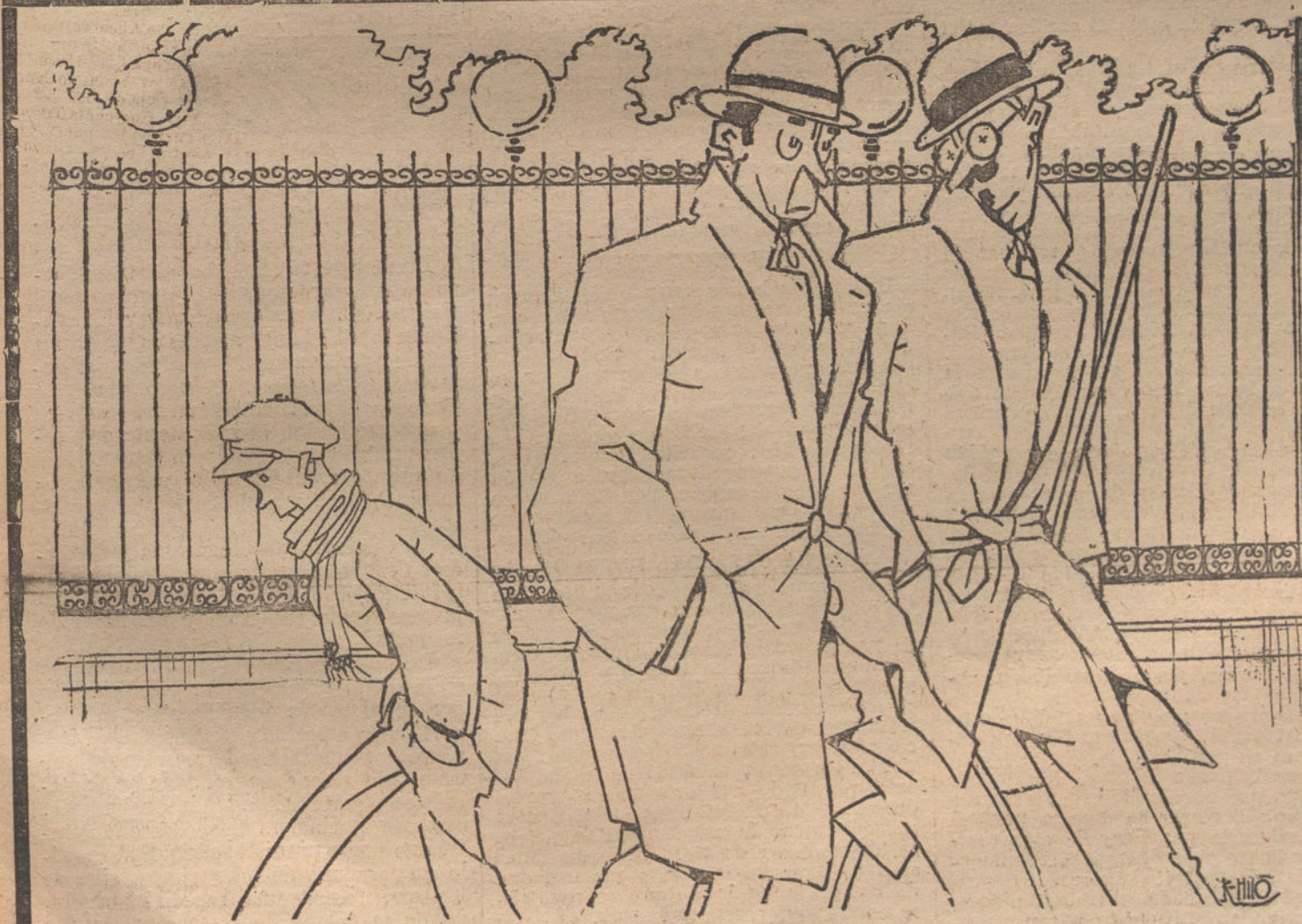
LOS LUNES DEL RITZ

Con estos antecedentes, políticos y Prensa, hacen mal en tomar en serio al gran cacique anarquizante. Para nosotros, la solución de este conflicto es bien clara: dejar abandonado á sus pro-