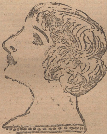
EL QUE LO DIBUJA, por A. E. Lamas.

—Nadie se conceptúe desgraciado, si se compara con otro que sea más; figuraos, por un momento, que se os hubiese muerto una vaca, y tuvierais que gastar 3.000 reales para comprar otra... Uno y Una.