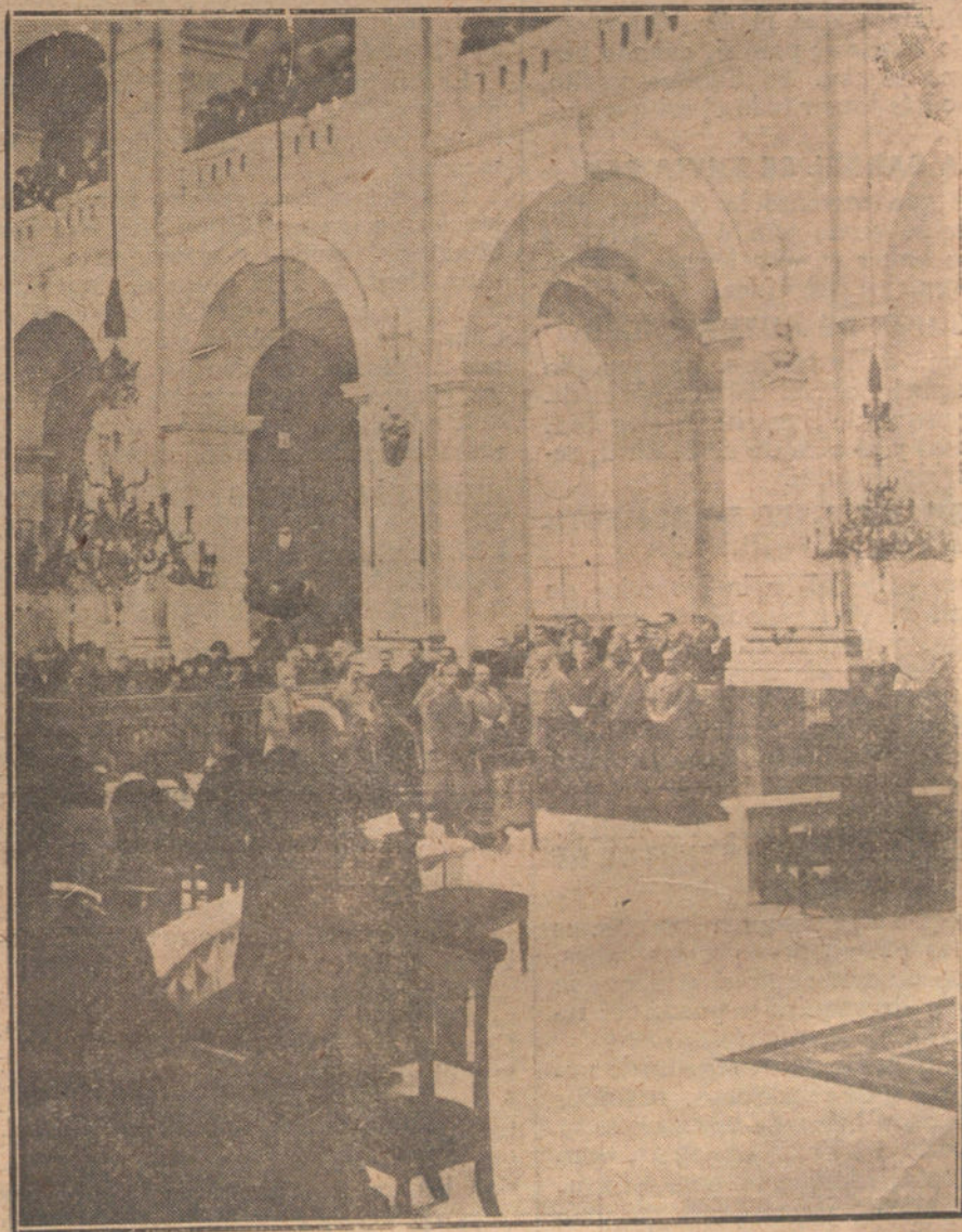
EL PRIMER ANIVERSARIO DEL ARMISTICIO EN FRANCIA.— Ceremonia conmemorativa, celebrada en la espilla de Inválidos, de París, presidida por el mariscal Foch.

Para informarnos de cuanto sucede, acudimos al Ayuntamiento, y con gran sorpresa por nuestra parte,