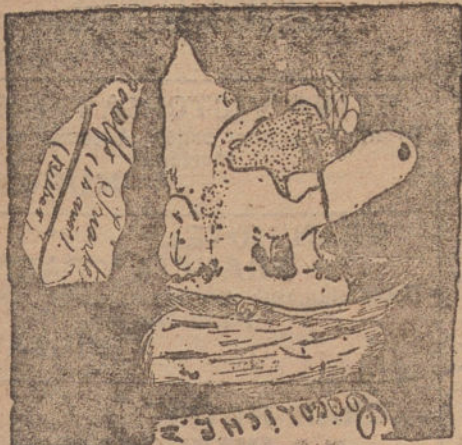
OCOLICHE, por Rodolfo Iriarte, (catorce años).

Segundo. El hacer gran provisión de alimentos, por temor de que se alteren sus precios.