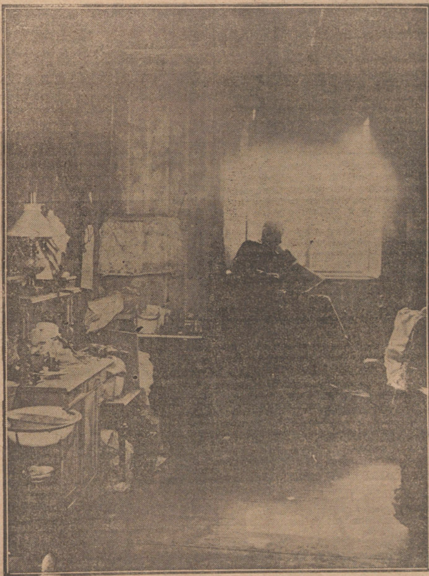
LA ESCASEZ DE VIVIENDAS EN ALEMANIA.—Una celda de preso de la prisión celular de Berlín, convertida ahora en vivienda.