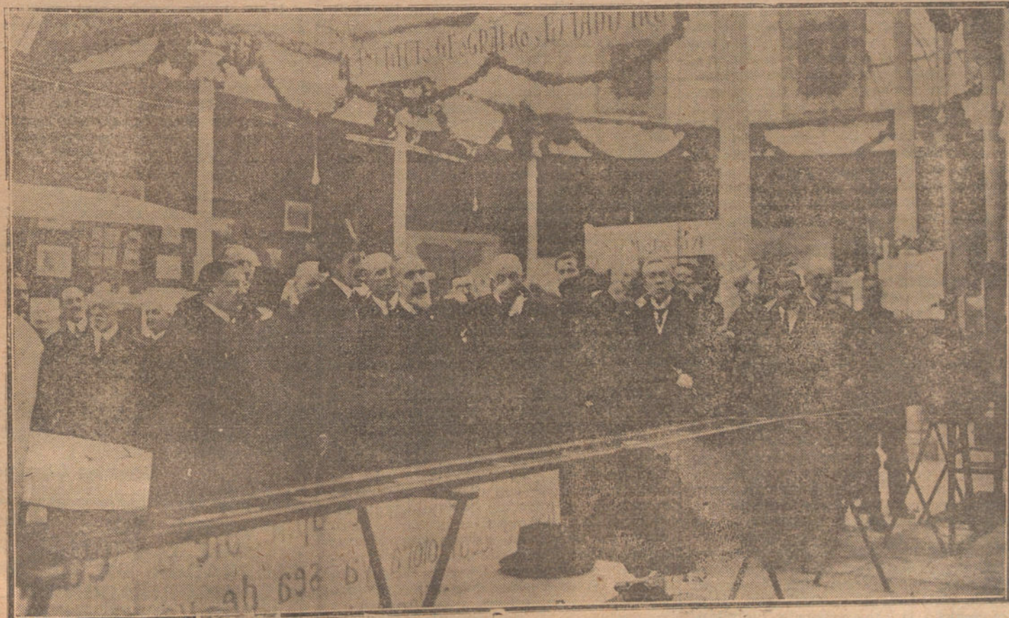
LA EXPOSICION DE INGENIERIA.—Su Majestad el Rey, viendo el gran mapa presentado por el Instituto Geográfico y Estadístico.

NUMERO DEL TELEFONO DE LA REDACCION Y TALLERES DE «LA TRIBUNA», JARDINES, 4, 6 Y 8: 4.444.