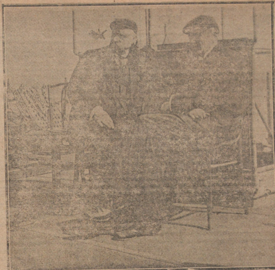
El general Yudenich, que acaba de ser derrotado en Rusia, con el almirante Piliñ, á bordo del crucero «Marnes».

casa situada en sitio céntrico ó no muy apartado, buena orientación y todos adelantos. No importa precio, pero ha de rentar el 6 por 100 como minimum. Ofertas, con toda clase de detalles, al Apartado 943. Inútil enviar datos si no se trata del propio vendedor.