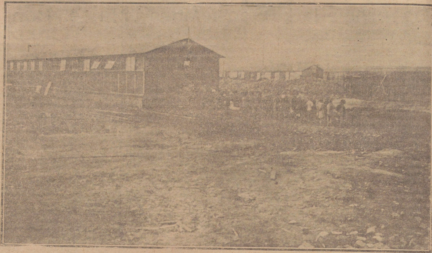
DESPUES DE LA GUERRA.—Edificio de, en una de las localidades del Norte destruido provisionalmente para escuela devorada por la guerra.

Actualmente no hay responsables de la firma diaria, ni del correo que se recibe, ni del archivo. Tampoco existe una secretaría en forma que debidamente articule las dependencias del referido Centro; así se da frecuentemente el caso de extravío de expedientes, no sabemos si desaparición maliciosa, sin que jamás se haya intentado, por los que tienen tal deber, exigir una responsabilidad concreta. Las cuatro inspecciones de la casa funcionan por Delegación y a río revuelto, dándose informes contrarios para un mismo asunto y tema y en expedientes análogos. Las agencias ejecutivas se han convertido en un monopolio a todas luces inhumano, del que hablamos en su día, y en cuanto a la contabilidad, cuánto inexcusable de