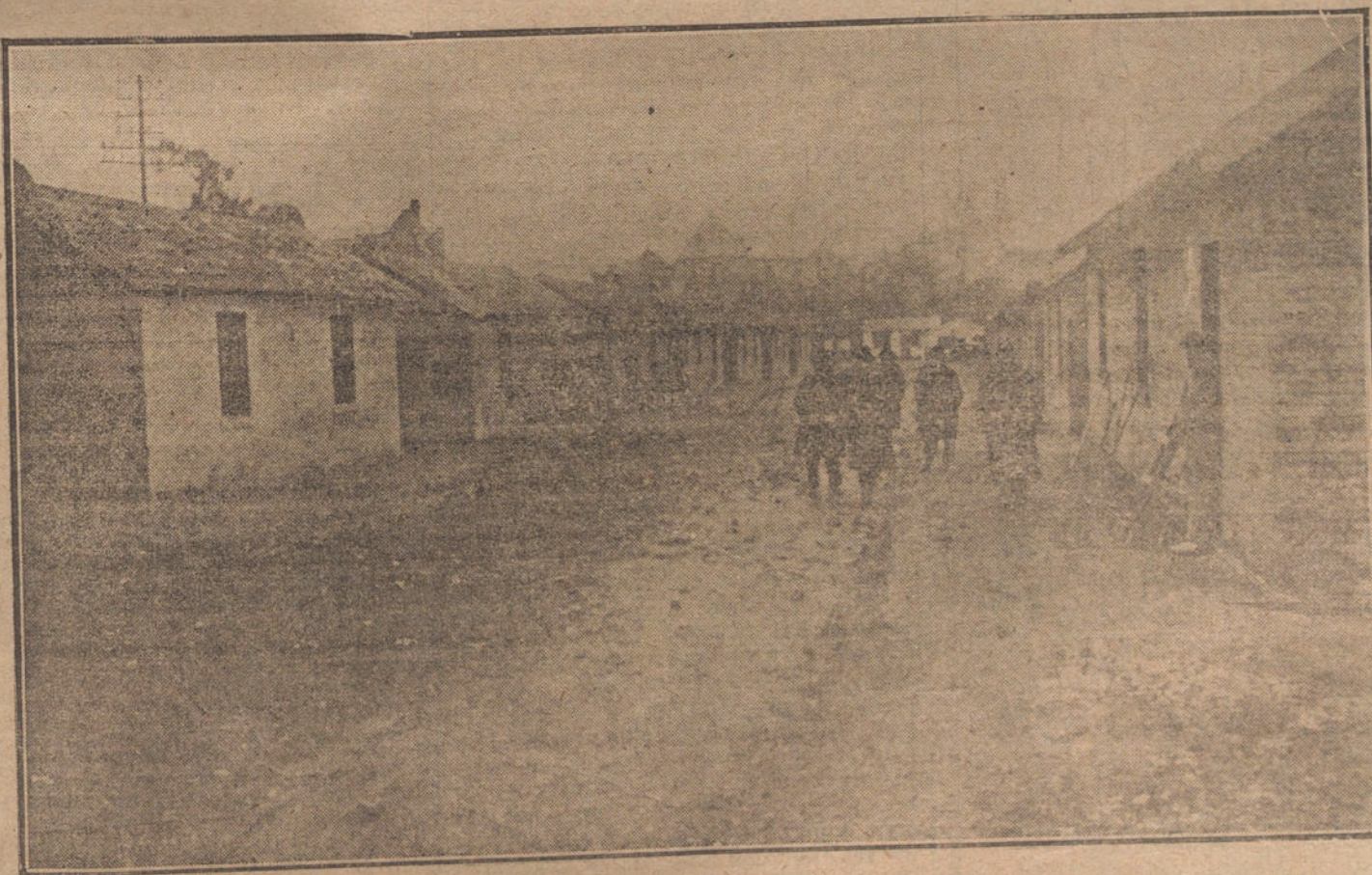
DESPUES DE LA GUERRA.—Una nueva calle provisional de Péronne, una de las ciudades que más estragos han sufrido, construida sobre las ruinas.

NUMERO DEL TELEFONO DE LA REDACCION Y TALLERES DE «LA TRIBUNA», JARDINES, 4, 6 Y 8: 4.444.