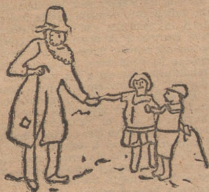
LO QUE HACEN MIS HERMANITOS, por Manuel Chaveinte (once años).

Victoria-Lance.—En una pequeña cacerola se ponen una cucharada pequeña de jalea de grosella, un clavo de especias, ocho gramos de pimienta en grano, un poco de canela, corteza de naranja, un decilitro de vino de Porto, dos decilitros y medio de salsa española. Reducir esta salsa, moviéndola con una espátula. Se pasa por la estameña, completándola con jugo de naranja y Cayena. Especial para venados.