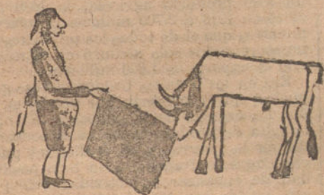
EL DESGARBAO, por Vicente Arzútegui (seis años).

Si una ó dos veces en la vida se les presenta la ocasión, acuérdense de que deben cogerla por los cabellos si quieren lograr fortuna.—(Continuará.)