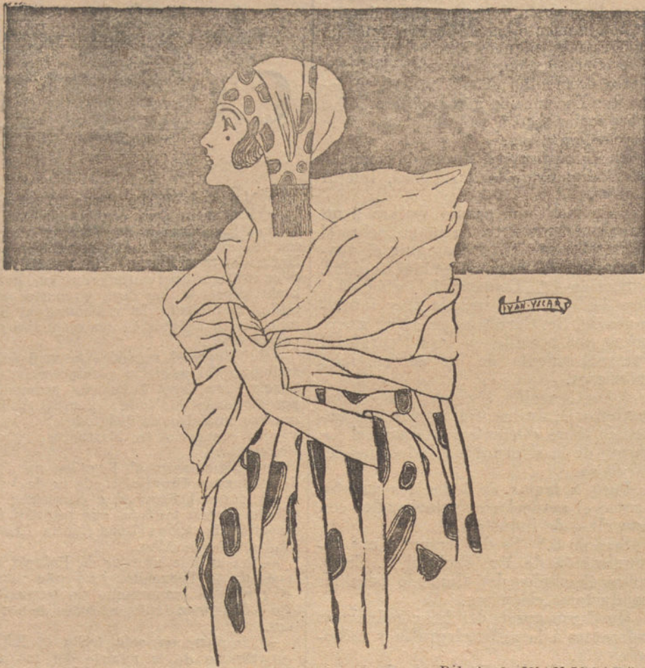
(Dibujo de IVAN-ISCAR.)

No, amadas lectoras; imposible tarea es el pretender hermanar la religión con