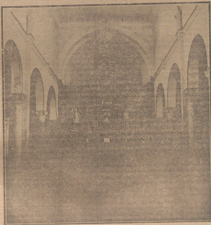
Interior del famoso templo de San Crisóstomo, en Zara, población ocupada por D'Annunzio.

NO SE DEVUELVEN LOS ORIGINALES GRAFICOS NADA MAS QUE EN EL CASO EN QUE PREVIAMENTE HAYAN SIDO ADQUIRIDOS CON ESA CONDICION.