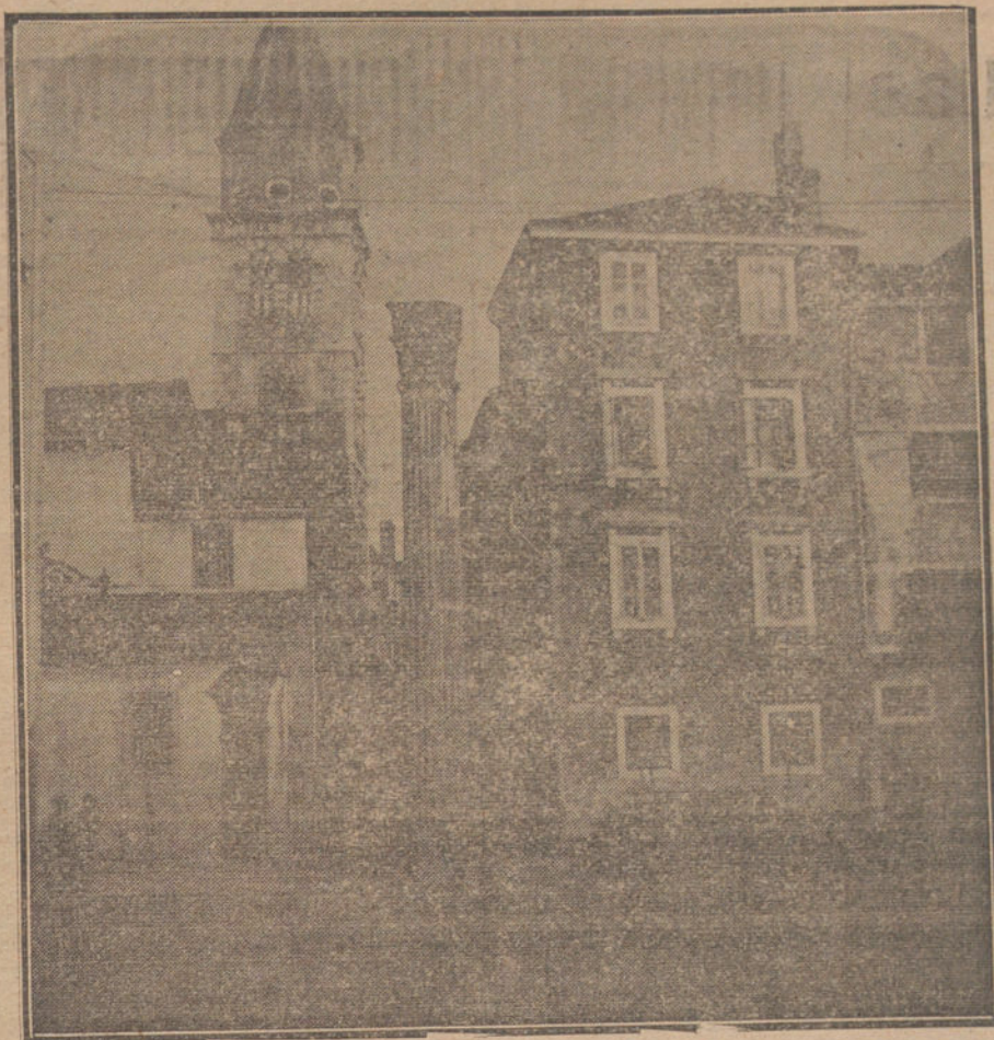
LAS AVENTURAS DE D'ANNUNZIO.—Plaza de la Columna, en Zara, capital de Dalmacia, que acaban de ocupar las tropas italianas que dirige D'Annunzio.

RIGA. El general Eberhardt, que ha sustituido a Von der Goltz a la cabeza de las tropas alemanas, que están concentradas en el Este, ha enviado un «ultimatum» al Gobierno letón, en el que manifiesta que toma bajo su protección al Ejército de Bermond. En el «ultimatum» exige el general Eberhardt el cese inmediato de las operaciones del Ejército letón contra las tropas del general Bermond.—Radio.