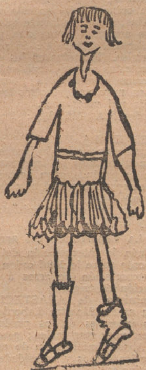
LA CHICA DE MI PORTERA, por Marcelina García Ortiz (siete años).

pero es una alhaja que de nada me sirve. —No diga usted eso—le dijo el cazador—; tómela usted, que con ella y su habilidad no dejará cosa a vida; yo se lo aseguro.