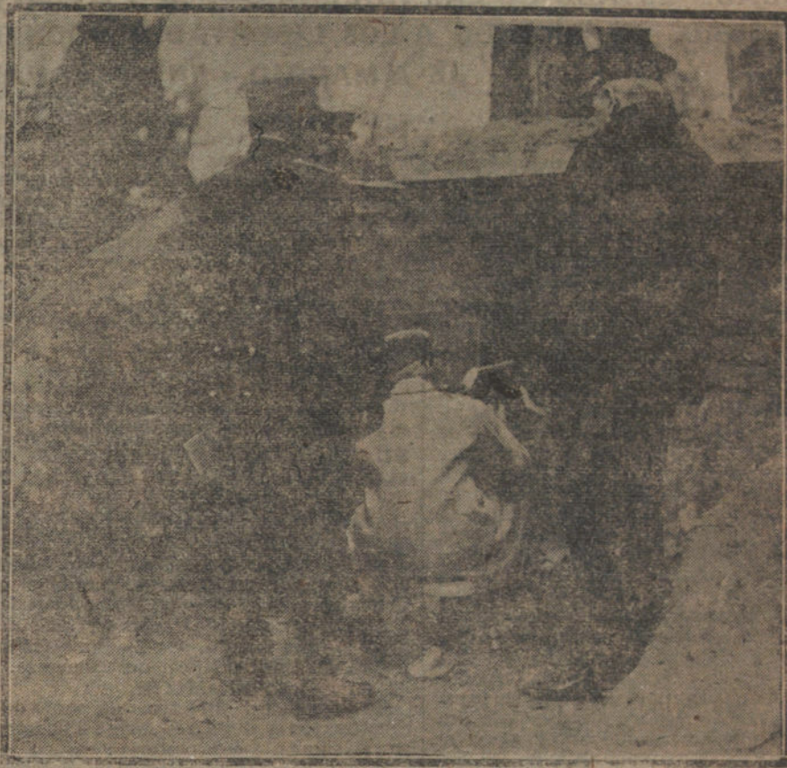
Su Alteza el Príncipe de Asturias, examinando una ametralladora, durante la visita que ha hecho esta mañana a la Exposición de Ingeniería.

Para muchos, esta insospechada transformación obedeció a móviles políticos. Ahora, el Sr. La Cierva, convencido del fracaso de su actuación personal, espera que nuevos factores vayan a secundar sus planes disol-