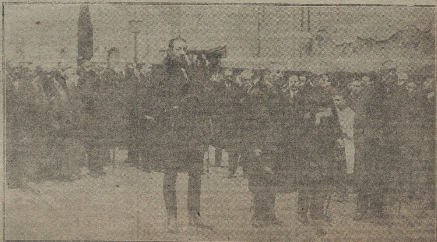
Los representantes de la Familia Real y presidencia del duelo, en el entierro del marqués del Vadillo. (Fotografía VIDAL.) Ayuntamiento de Madrid