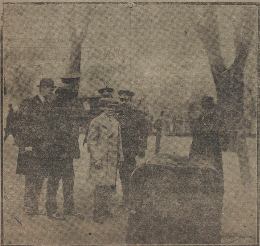
Su Alteza el Príncipe de Asturias, visitando la gran Exposición de Ingeniería.

PARIS. Se ha celebrado con toda solemnidad la sesión de apertura del curso del Instituto Católico de París, en presencia de los cardenales Amette, Luçon, de Reims, y Dubois, de Rouen, así como de los principales arzobispos de Francia, numerosos miembros del Instituto, senadores, diputados y profesores de la Universidad de París.—Radio.