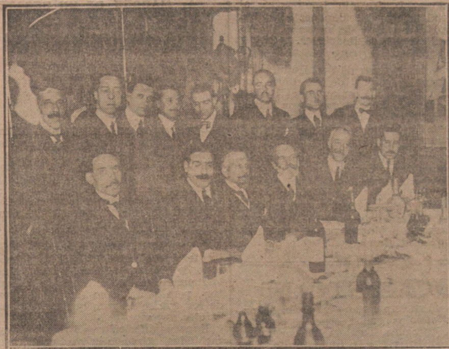
Banquete íntimo, ofrecido á los informadores de la Prensa por la Comisión organizadora del Congreso Nacional de Ingeniería.