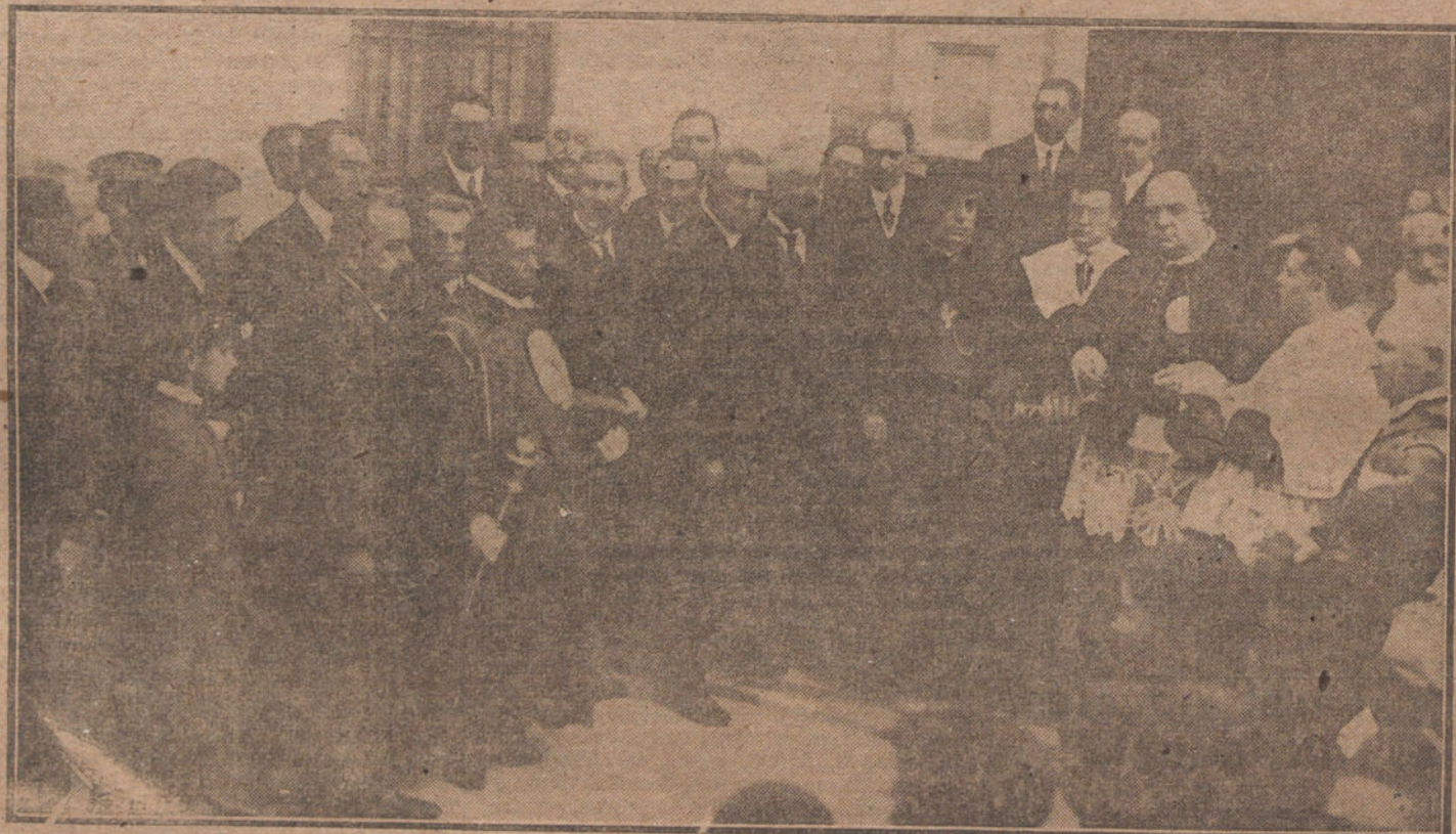
INAUGURACION DE ESCUELAS EN SERRANO.—El cardenal Almaraz dirigiendo una plática a los niños, en el acto inaugural de las escuelas, que los marqueses de Monto Florido han donado al pueblo de Arahal.

SPLIT. Comunican de Chibénik al Presse Bureau que las autoridades italianas han cogido en rehenes a doce notabilidades yugoslavas. Desde el día 22 del corriente se ejercen medidas extraordinariamente