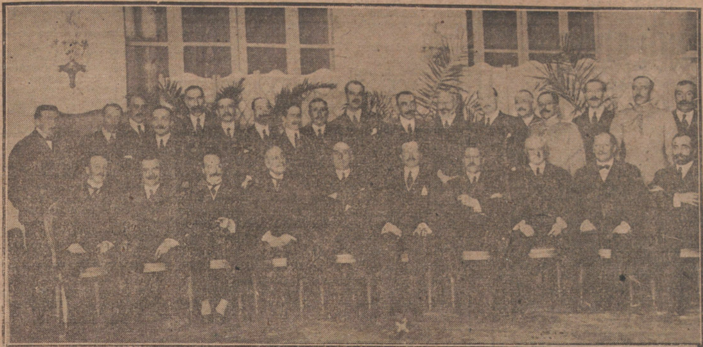
El Infante Don Fernando (x) con los generales, jefes y oficiales que pertenecieron al regimiento de Lusitania, del que fue comandante Su Alteza, y que ayer le ofrecieron un banquete en el Hotel Ritz.

severas, sobre todo en la inspección de los viajeros que van a bordo de los navíos que hacen escala en Chibénik. Se ignoran aún los nombres de los rehenes hechos y de los detalles de su detención.