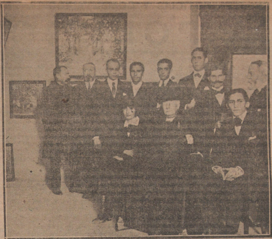
Su Alteza Real la Infanta Doña Isabel, durante su visita a la Exposición de obras de los pensionados del Paular.

LIEJA. El corresponsal en Bruselas del periódico «Express» anuncia la desaparición de dos periódicos de la capital: El «Betit Bleu» y la «Presse».—Radio.