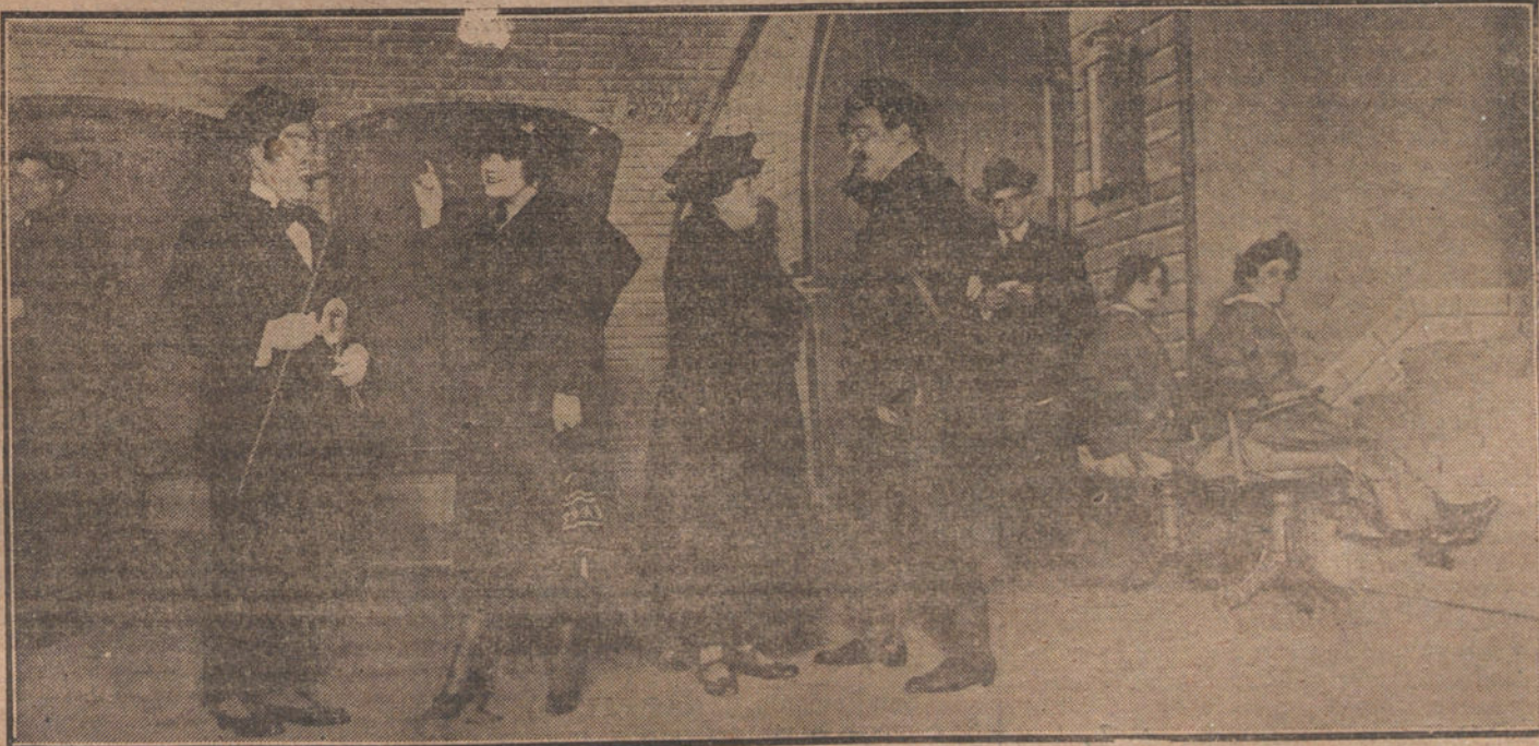
Una escena de la obra «Llévame al «Metro», mamá», que se estrenó ayer tarde en el teatro Cómico.

PARIS. Telegrafían de Nueva York: «Las Misiones económicas aliadas que se encuentran actualmente en los Estados Unidos y un Comité americano han crea- do una Cámara de Comercio internacio- nal. La primera reunión de esta Cámara, que residirá en Europa, se verificará en Paris en el mes de Junio próximo. El per- sonal de la organización central se com- pone de un Consejo de Administración y de un secretario general.»—Radio.