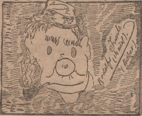
TRAGAVIENTOS, por Rodolfo Iriarte (catorce años).