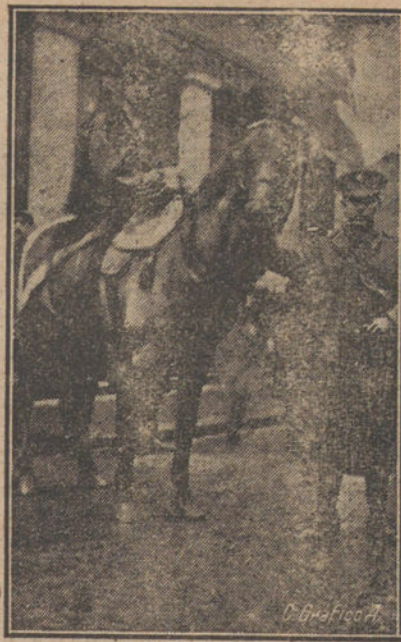
Belgica, en la cabaleta celebrada en Londres, con motivo de las fiestas del Lord Alcalde.

EL «FOSFOQUINOL» ES UN MEDICAMENTO EUPEPTICO TOLERADO POR LOS ESTOMAGOS MAS DELICADOS.