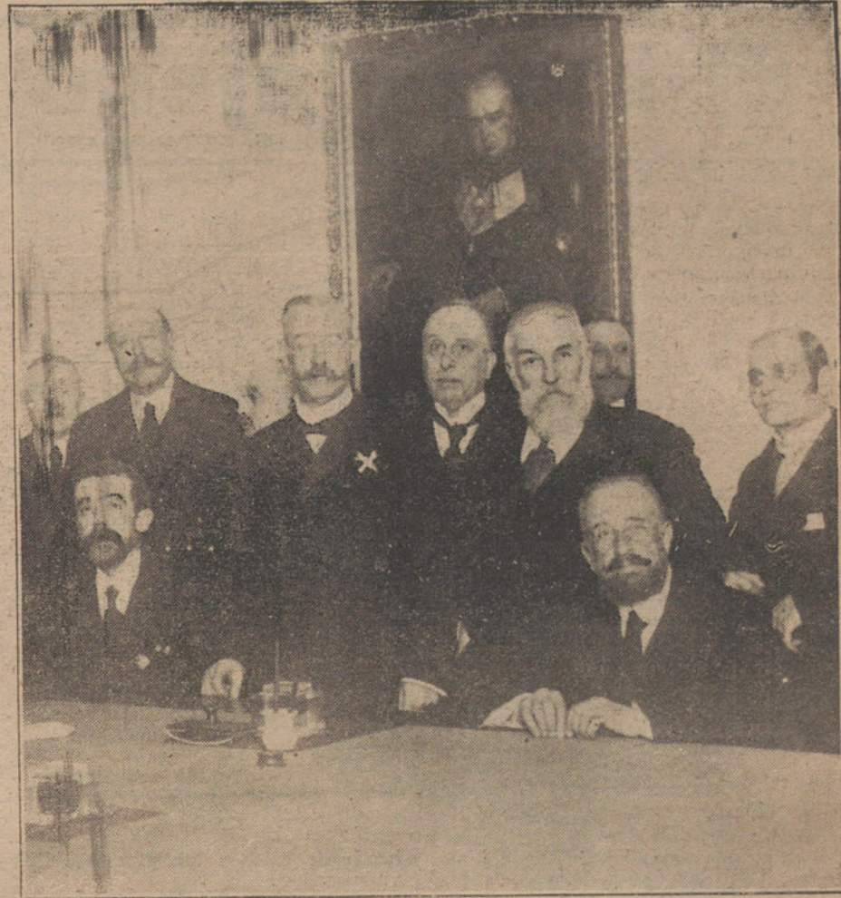
El director del Instituto Español de Oceanografía, D. Odón de Buen (x), al terminar la interesante conferencia que dió anoche en la Real Academia de Geología.