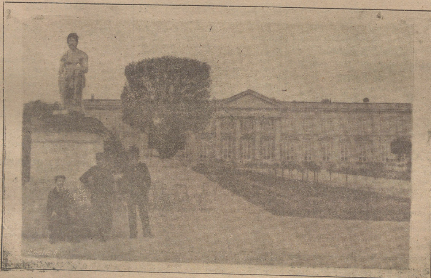
Histórico palacio de Compiègne (Francia), que ha sido destruido por un incendio. Fachada principal que da al parque, Ayuntamiento de Madrid

Para asistir al acto, que promete estar concurrentísimo, se adquieren tarjetas al precio de 14 pesetas en el Círculo de Bellas Artes, en la Asociación de Pintores y Escultores, San Bernardo, número 1, y en la librería de Fe