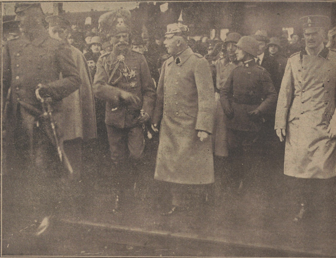
MACKENSEN, DE VUELTA EN SU PATRIA.—Recepción del célebre mariscal germano, en la estación de Anhalt.

—Tenga usted en cuenta que es una copia esmerada de un cuadro de Museo... Un gran artista, que oculta su nombre, es el que la ha hecho—le dicen en la tienda.