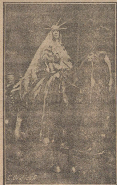
Actriz norteamericana, representando a los Estados Unidos, en la cabaleta celebrada en Londres, con motivo de las fiestas del Lord Alcalde.

«Los alumnos del sexto año de Medicina, entusiastas amantes del Ejército nacional, garantía suprema de la defensa y de la dignidad de España y amparador eficaz de la Justicia y el