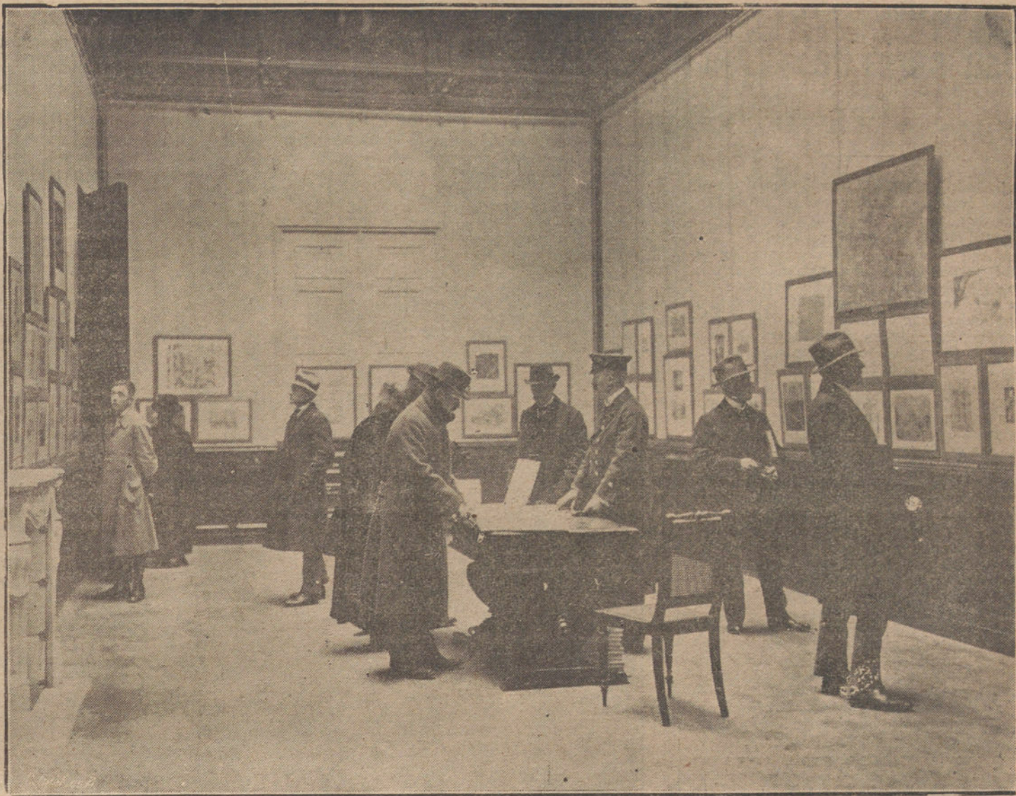
LA NUEVA ALEMANIA.—Sala de la antigua residencia del Kronprinz, convertida en Palacio de Bellas Artes, donde se exponen cien dibujos de los famosos artistas alemanes, Leibl, Feuerbach, Corinth y otros.

vado, pero no de incógnito, llegó acompañada del Infante Don Jaime, de la duquesa de San Carlos, del marqués de Bendaña y del embajador de España en París, Sr. Quiñones de León, que había ido a buscarla a Boulogne.