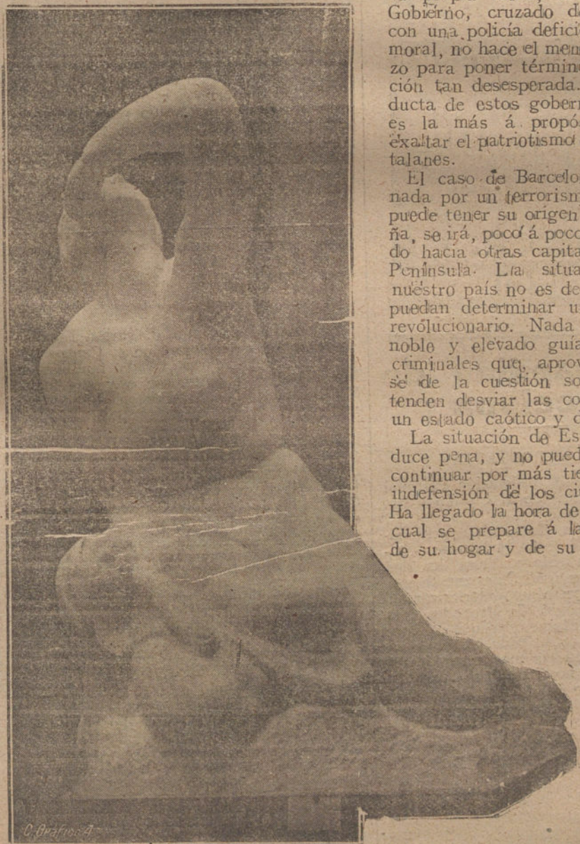
DE NUESTROS PENSIONADOS EN ROMA.—Trabajo remitido por el Sr. Quintana Danagos.

La situación de España produce pena, y no puede ni debe continuar por más tiempo esta indefensión de los ciudadanos. Ha llegado la hora de que cada cual se prepare a la defensa de su hogar y de su Patria.