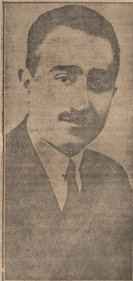
El joven compositor Federico Moreno Torroba.