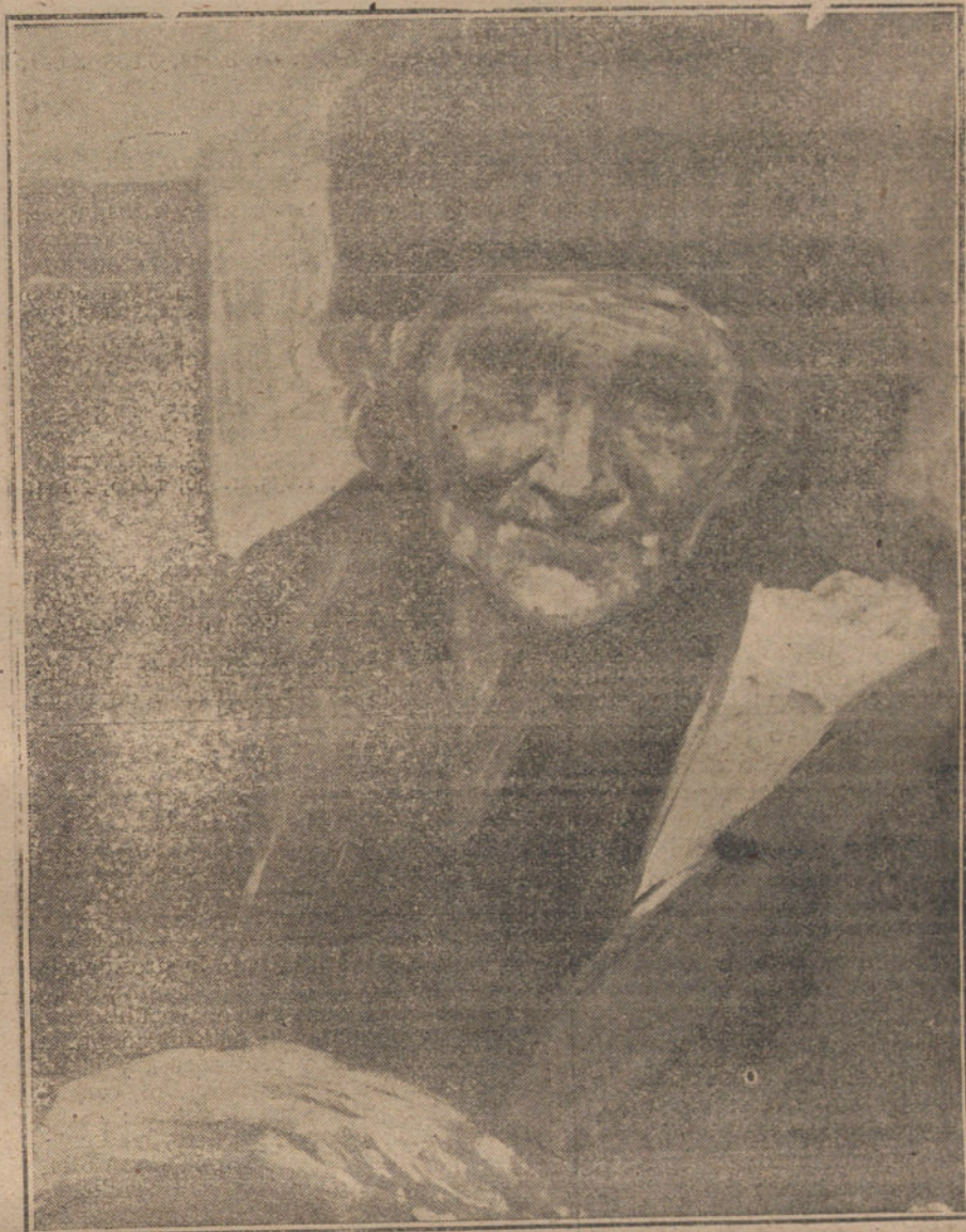
«VIEJA MENDIGA».—Cuadro de Jorge Zuckoff, que acaba de celebrar una Exposición de sus obras en el Ateneo.

España no puede ni debe permanecer a manos de un terrorismo estúpido, de procedente extranjero. Si la revolución ha de venir gran-