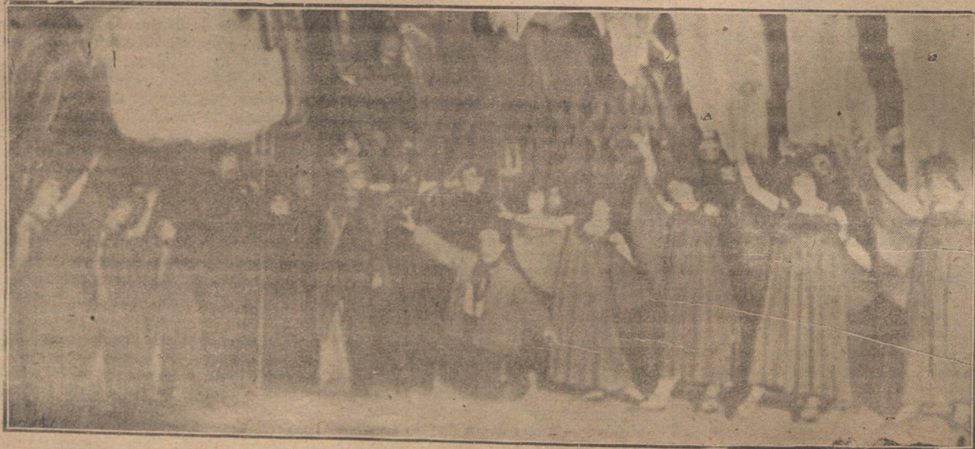
ANOCHÉ, EN NOVEDADES.—Una escena de la zarzuela de magia «El hombre más barato de España», estrenada con éxito en el referido teatro.