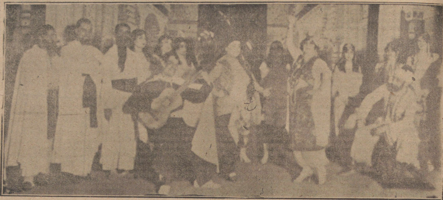
ANOCHÉ, EN MARTIN.—Una escena de la zarzuela «El suspiro del moro», estrenada con gran éxito en dicho teatro.

La mayor ó menor extensión y amplitud de una obra y su asunto podrán justificar la elevación diferente de sus ideas, y tal vez el distinto empleo de procedimientos; pero de ningún modo el desvío total, que, por impotencia, probablemente, finge desprecio de su terreno artístico. Esa varita de virtud que salva del fracaso y hasta presta pavores de gloria, debel quebrarse,