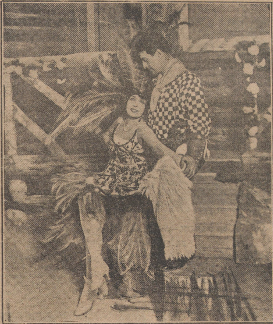
La original artista, representando una escena en el Casino de París.

Esa francesa que representa ese ídolo en el politismo de los públicos, suele apoderarse bien de su papel, suele llevarlo a extremos preciosos, suele añadirle distinción, elegancia, espíritu y otras inflexiones que la hacen completamente arrebatador, porque si este tipo de bichejo femenino, en cuya máquina sólo hay una o dos piezas de una belleza sana y rotunda