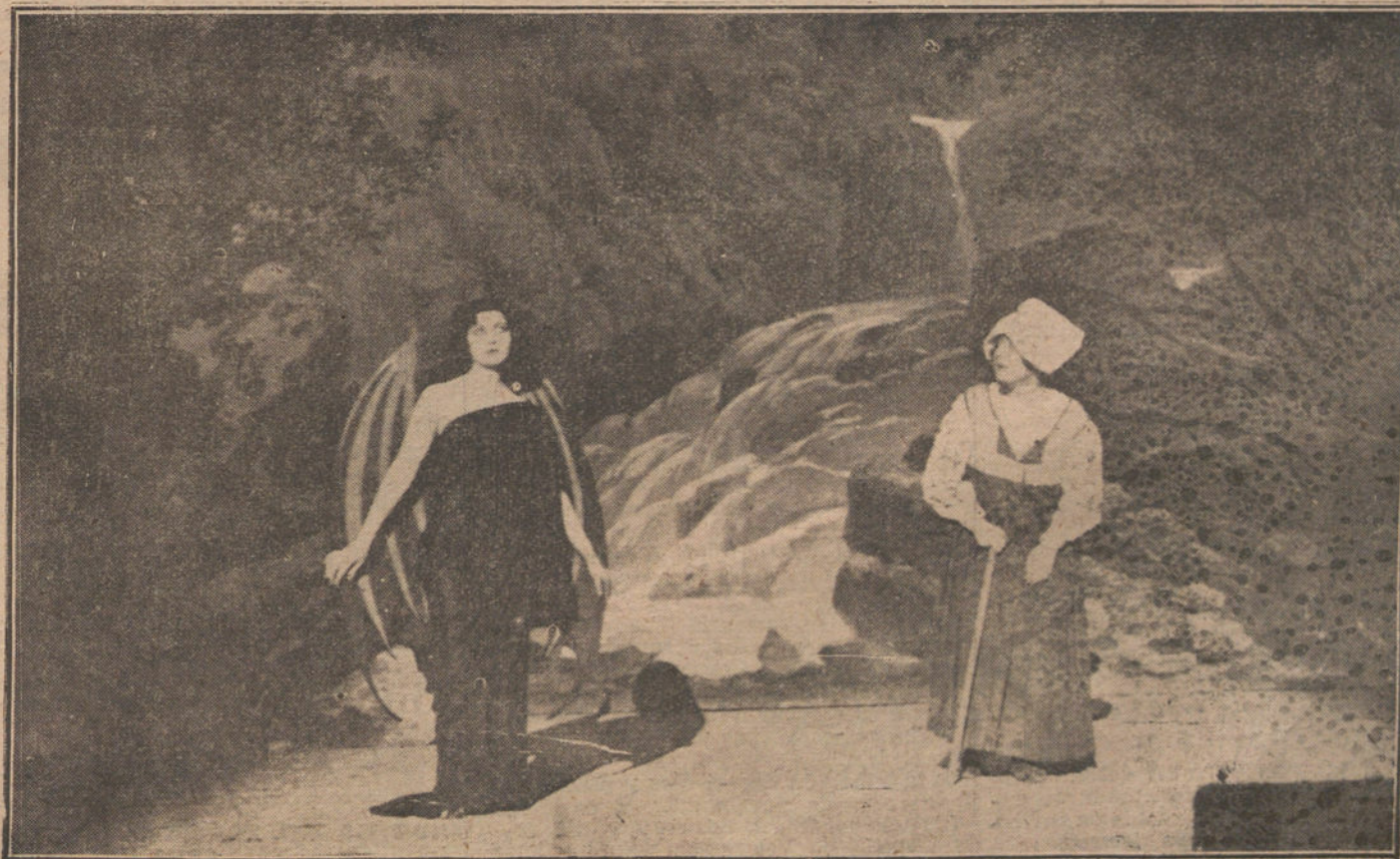
Una escena del segundo acto de «Y va de cuento...», de D. Jacinto Benavente, estrenada ayer tarde, con gran éxito, en el teatro de la Princesa.

REAL. —El próximo jueves, primera representación de «Parsifal», dirigida por el maestro Otto Hess é interpretada por la señorita Racanelli y los Sres. Rousseliere, Molinari, Bettini, Scafa y Beccucci. Para mayor comodidad del público, y en vista de la duración del espectáculo, éste empezará a las seis en punto de la tarde, terminando el primer acto a las ocho menos cuarto, y reanudándose la representación a las diez de la noche.