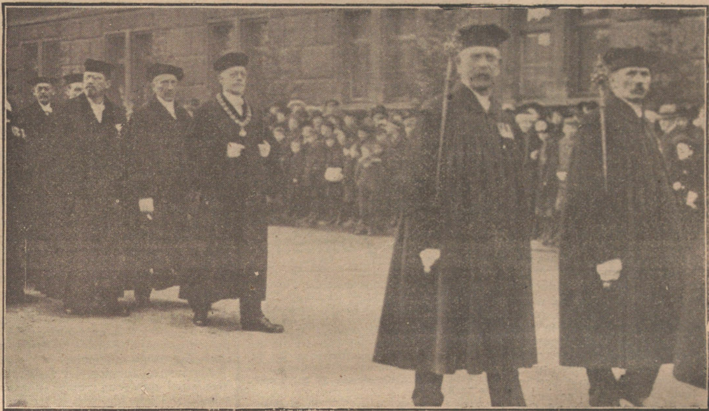
El rector y los catedráticos de la Universidad Rostock, en el cortejo festivo.

El representante del Estado en la Compañía Arrendataria de Tabacos viene siendo, y lo es en la actualidad, un técnico jefe de Administración de Hacienda, subordinado, por lo tanto, del ministro de este ministerio.