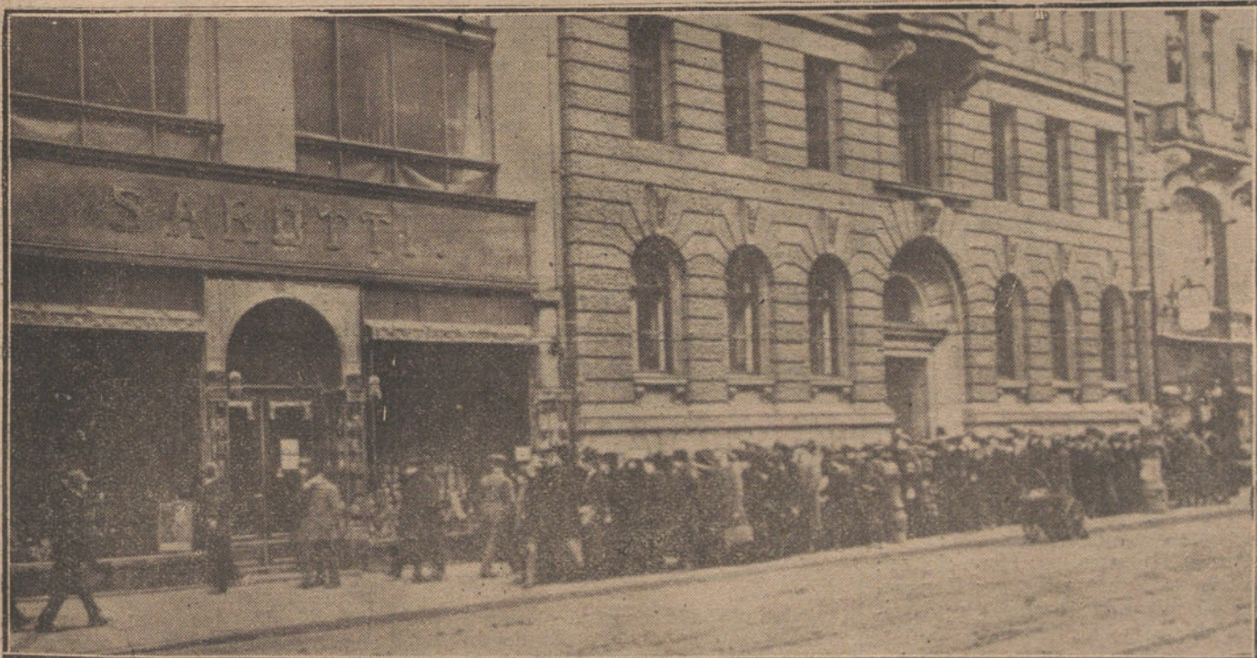
YA HAY OTRA VEZ CHOCOLATE EN ALEMANIA.—El público haciendo cola delante de los almacenes de la fábrica Sanotti.

Su autoridad en el Gobierno le au- toriza a prescindir en este caso de la persona del presidente del Consejo, tan bien avenido con los intereses de la granda Empresa.