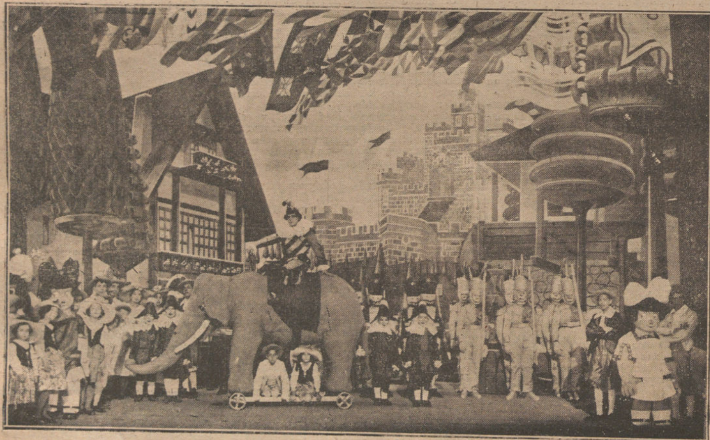
Una escena del tercer acto de la magia «Y va de cuento...», original de D. Jacinto Benavente, que se estrenó ayer tarde. Con gran éxito en el teatro de la Princesa.

lago» y algún otro. El cuadro sexto, del cuarto acto, titulado «El talismán perdido», es también digno de mención por su tonalidad de color, que admite perfectamente los cambios de luces; pero, en cambio, descubre mucho el mar, y en el teatro debe cuidarse mucho que las grandes extensiones presenten sólo una pequeñísima parte. Su reducción sirve para agrandar. Por ejemplo: da más sensación del mar o del cielo un trocito visto a través de una ventana, que no un fondo completo.