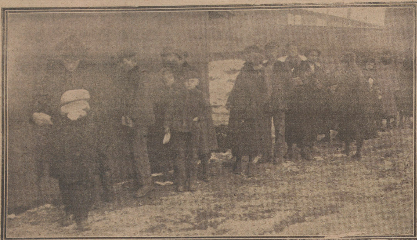
LA DESPEDIDA DE LOS ALEMANES DE LAS PROVINCIAS BALTICAS.—Fugitivos recibiendo alimentos al pasar la frontera.