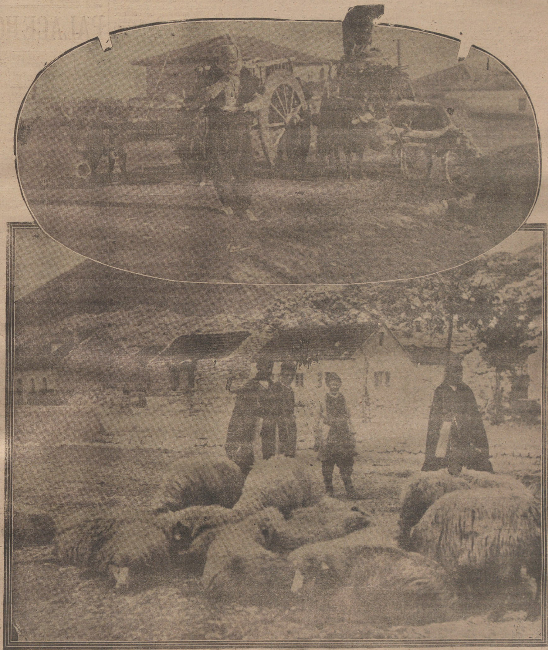
Labriegos y pastores del país.