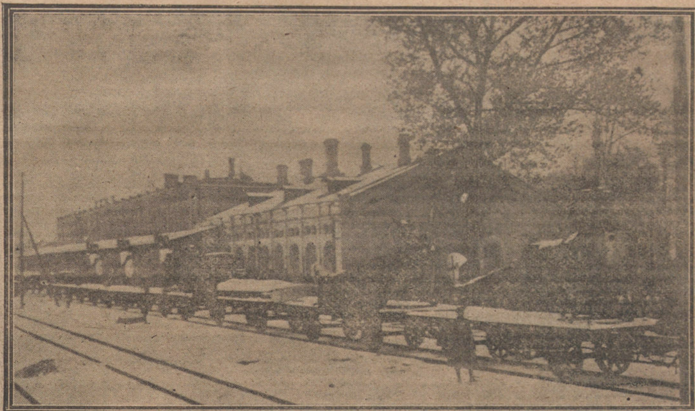
EN LA ESTACION DE WIRBALLEN. Aeroplanos alemanes, que tienen que entregarse á Lituania, según Convenio.

Es un ofrecimiento de amigables componedores para resolver el conflicto social que perturba nuestra vida, y es, á la par, una acusación á la indiferencia gubernamental, que nos ha llevado á tal estado. Constituye un mérito del documento la sinceridad con que expone la situación actual, nacida del abandono de los Gobiernos que se han sucedido, preocupados por íntimas quisquillosidades, como alejados del estudio de las cuestiones sociales. Autonomistas los firmantes, ven en la negación de gobernarse á sí mismos los