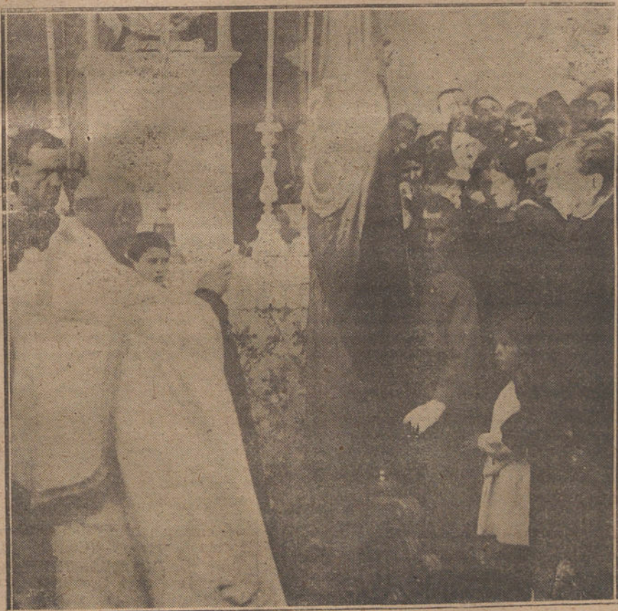
PEÑAFIOR (SEVILLA).—Momento de bendecir la bandera que el pueblo de Peñafior ha regalado al cuartel de la Guardia civil.

Dado en Roma, en San Pedro, en 1919, sexto de nuestro pontificado.—Benedicto XV.»