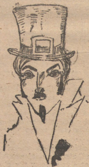
DE LA ANTIGÜEDAD, por Joaquín Vázquez (trece años).

Pudding de coco. —Se hacen hervir en medio litro de leche y durante unos quince minutos, dos cucharadas grandes de coco seco, rallado, colocándolo después en un tamiz o trapo de lienzo. Se vuelve al fuego y se añaden con gran cuidado dos