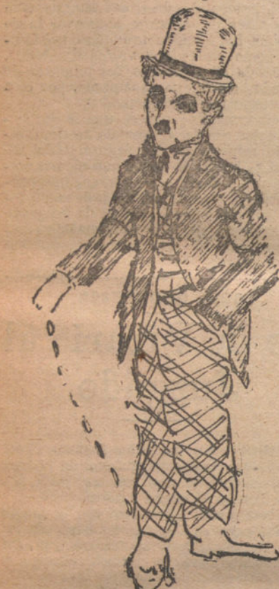
CHARLOT, por Eduardo Bermúdez (trece años).

cucharadas de harina flor, desleída en leche fría y removiéndolo.