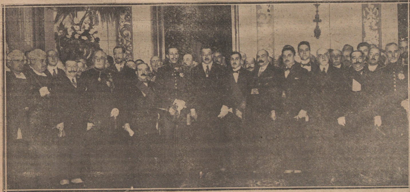
En Majestad el Rey, después de imponer al Ayuntamiento de Zaragoza, en la persona de su alcalde, la medalla de oro de la Previsión Social.

El Juzgado instruye diligencias. Hasta ahora no se conoce el nombre del muerto ni el del herido.