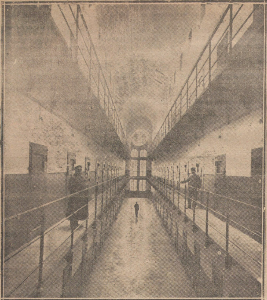
BARCELONA.—Del plante en la Cárcel Modelo. Galería donde ocurrieron los sucesos, de los que resultaron 63 heridos.