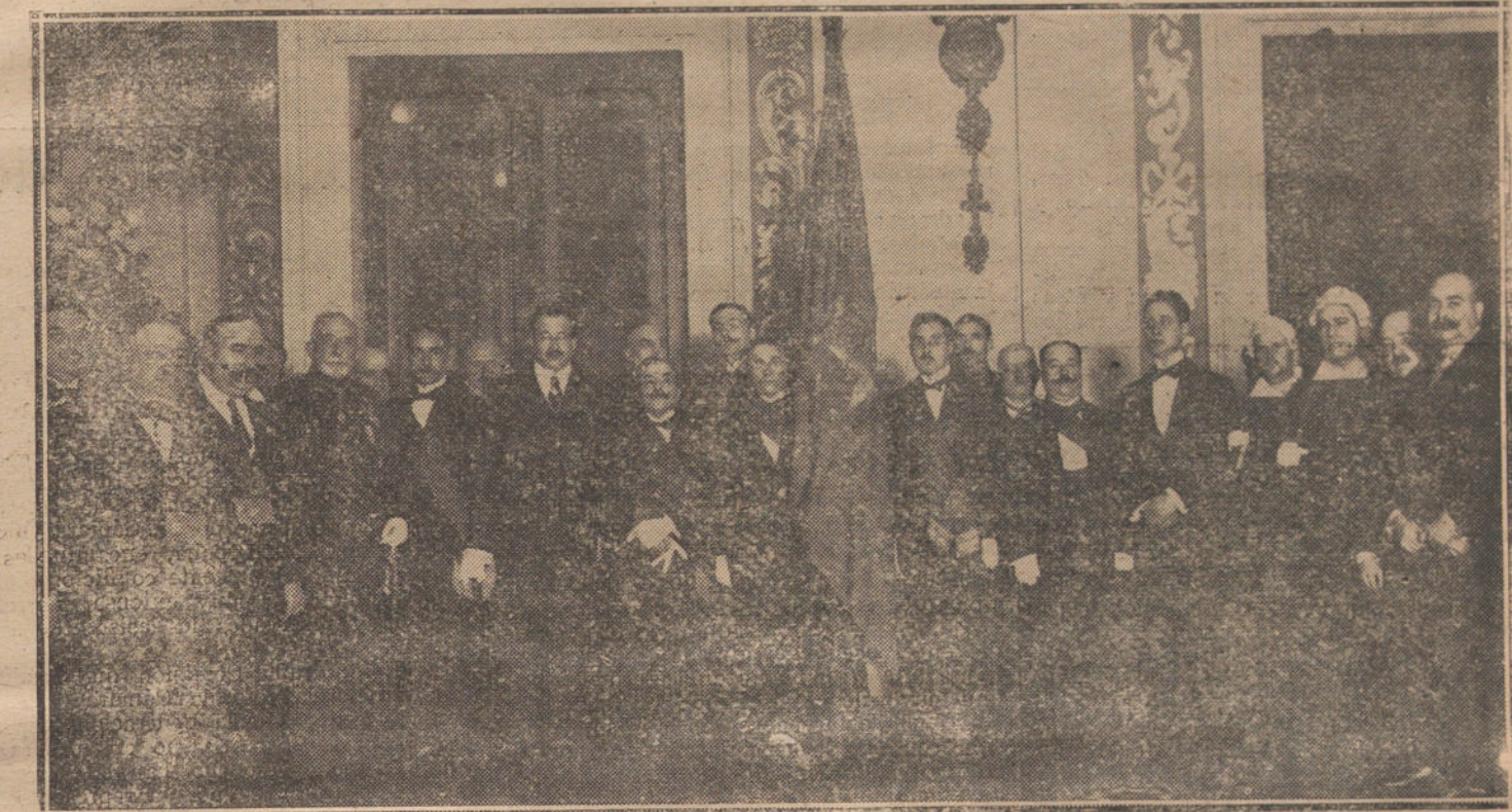
Los alcaldes de Madrid y Zaragoza, con varios concejales y con la bandera de esta última ciudad, después del solemne acto celebrado ayer en el Ayuntamiento.

Las generaciones actuales, caminan solas, sin prestar ambiente, ni con su simpatía ni con sus odios, a los políticos del viejo régimen. Llevan dentro