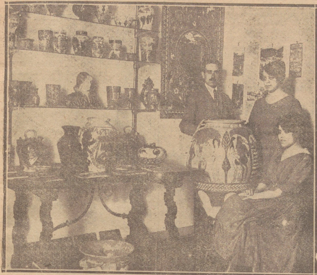
Detalle del estudio de Zuloaga, en el que se ve a su hijo y a dos de sus hijas.