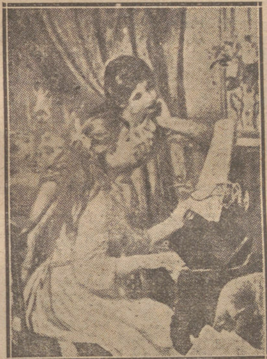
En el piano, por Renoir.

Hay dos momentos de hablar de los acontecimientos, al realizarse y después. Ni el primer momento excluye al segun- do, ni el segundo al primero. Los dos tie- nen distintas responsabilidades y obliga- ciones. (Los dos no tienen ningunas.)