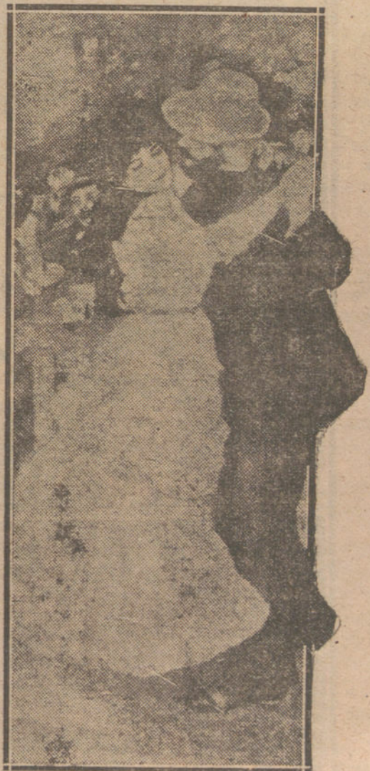
El baile, por Renoir.