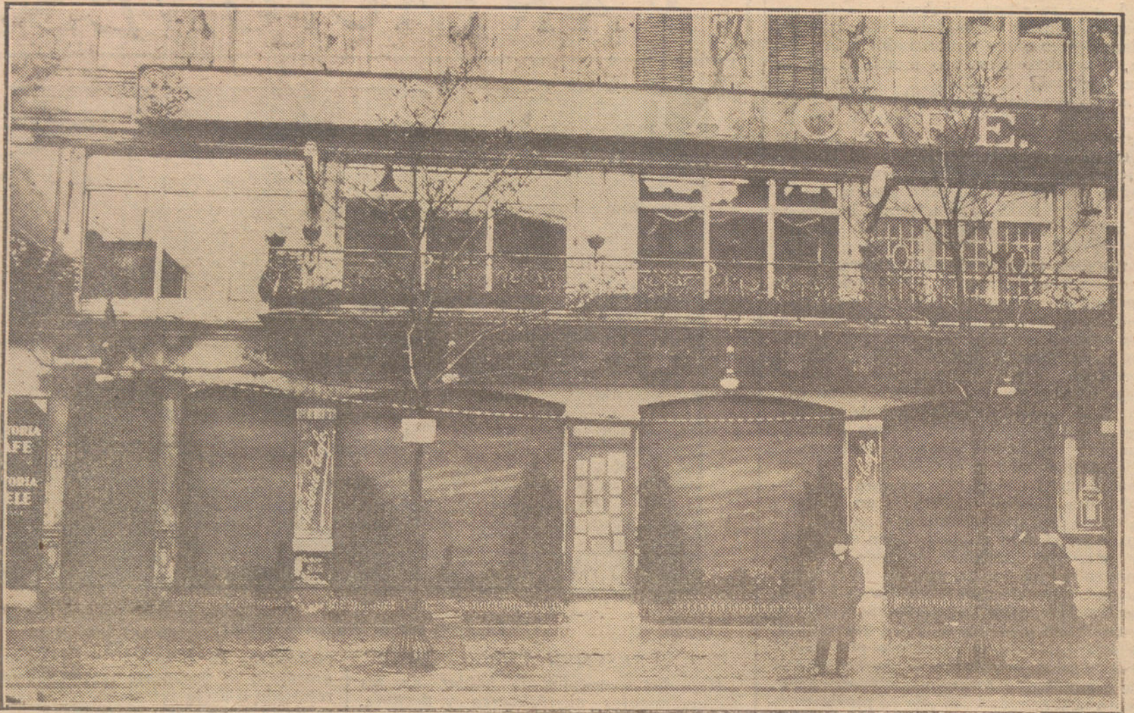
LA HUELGA DE CAMAREROS EN BERLIN.—Aspecto del gran café Victoria (Unter den Linden), cerrado después de los sucesos.