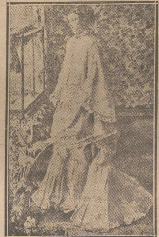
Retrato de madame Maitre, por Renoir.

El tejido de sus colores se ha entrecru- zado de un modo compacto. Ya ni impre- sionista podemos decir tranquilamente que es, con seguir siendo eso una alta cate- goría en arte. Parece que en aquel impre- sionismo que chocó tanto ha pasado algo, ha cicatrizado, se ha rehecho, y en cada pincelada del cuadro ha habido la activi- dad que tienen las crisálidas. ¿Quién an- te estos cuadros de Museo puede pensar que alguno de ellos fué de aquellos casi