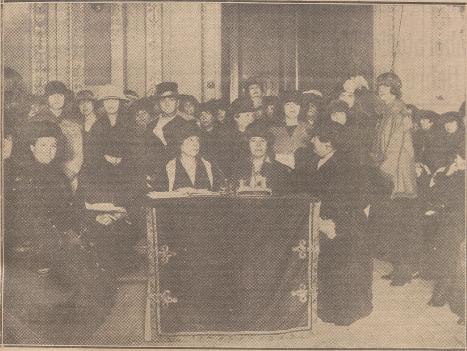
Aspecto del salón de actos del teatro Real, durante la celebración de la Asamblea feminista, verificada ayer tarde.

Nosotros esperamos que esta noche, en la función de beneficio del insigne Enrique Borrás, y que será de homenaje al glorioso maestro, en uno de los entreactos, se anuncie al público el cambio de nombre del teatro.