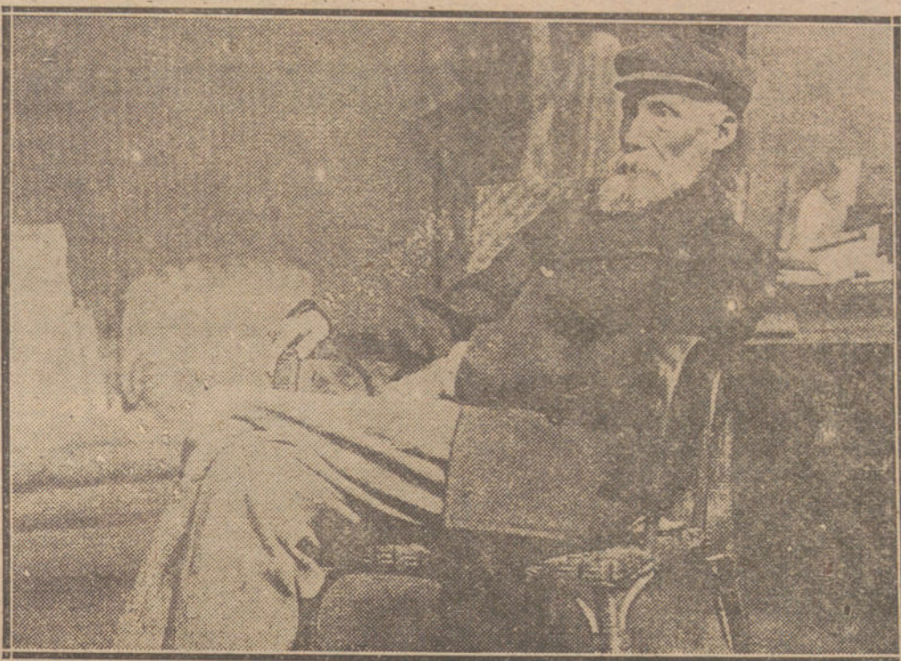
El gran pintor Auguste Renoir.