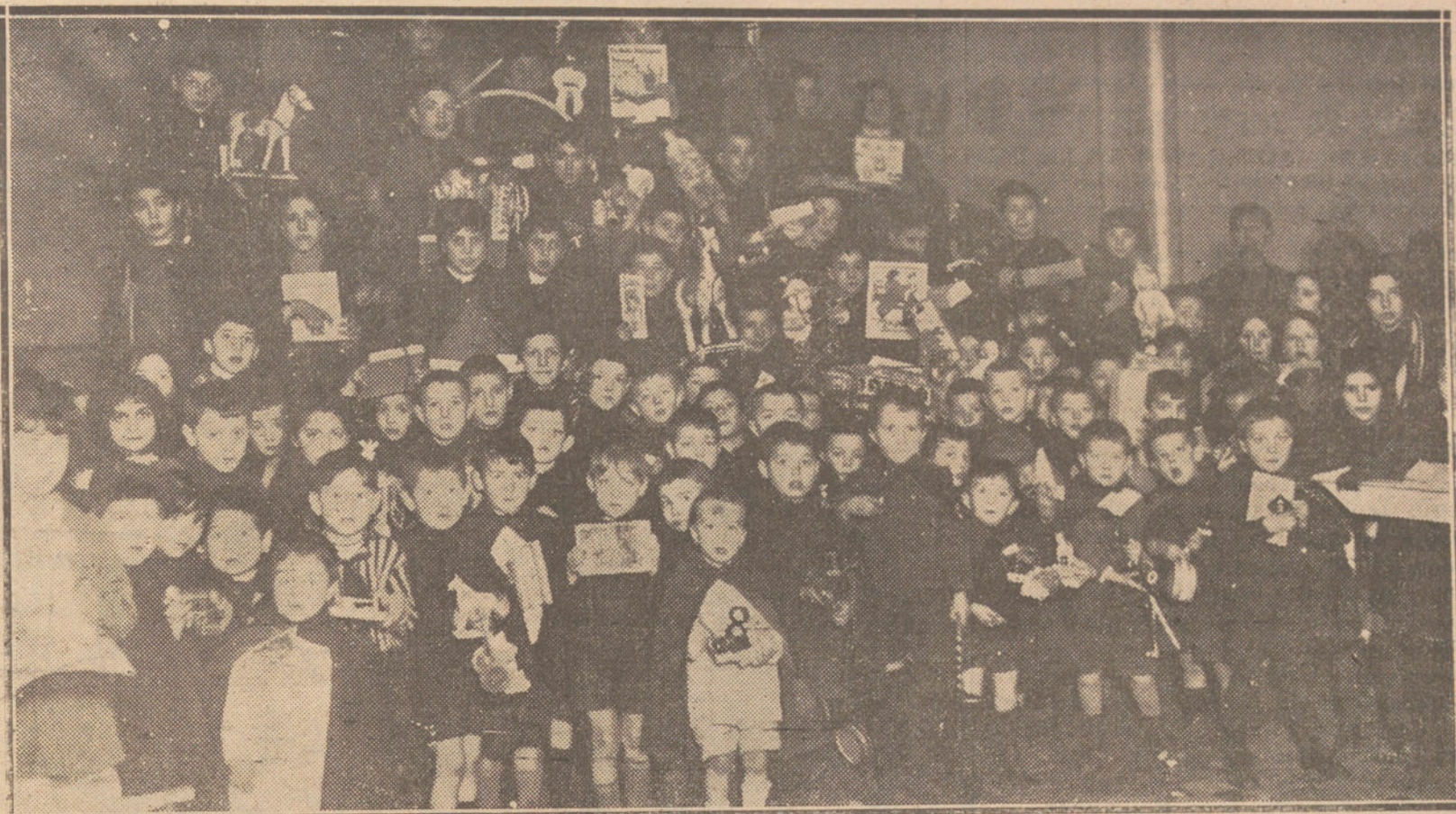
LA FIESTA DE REYES EN PROVINCIAS.—Reparto de juguetes á los niños del Asilo de San José, de SAN SEBASTIAN.