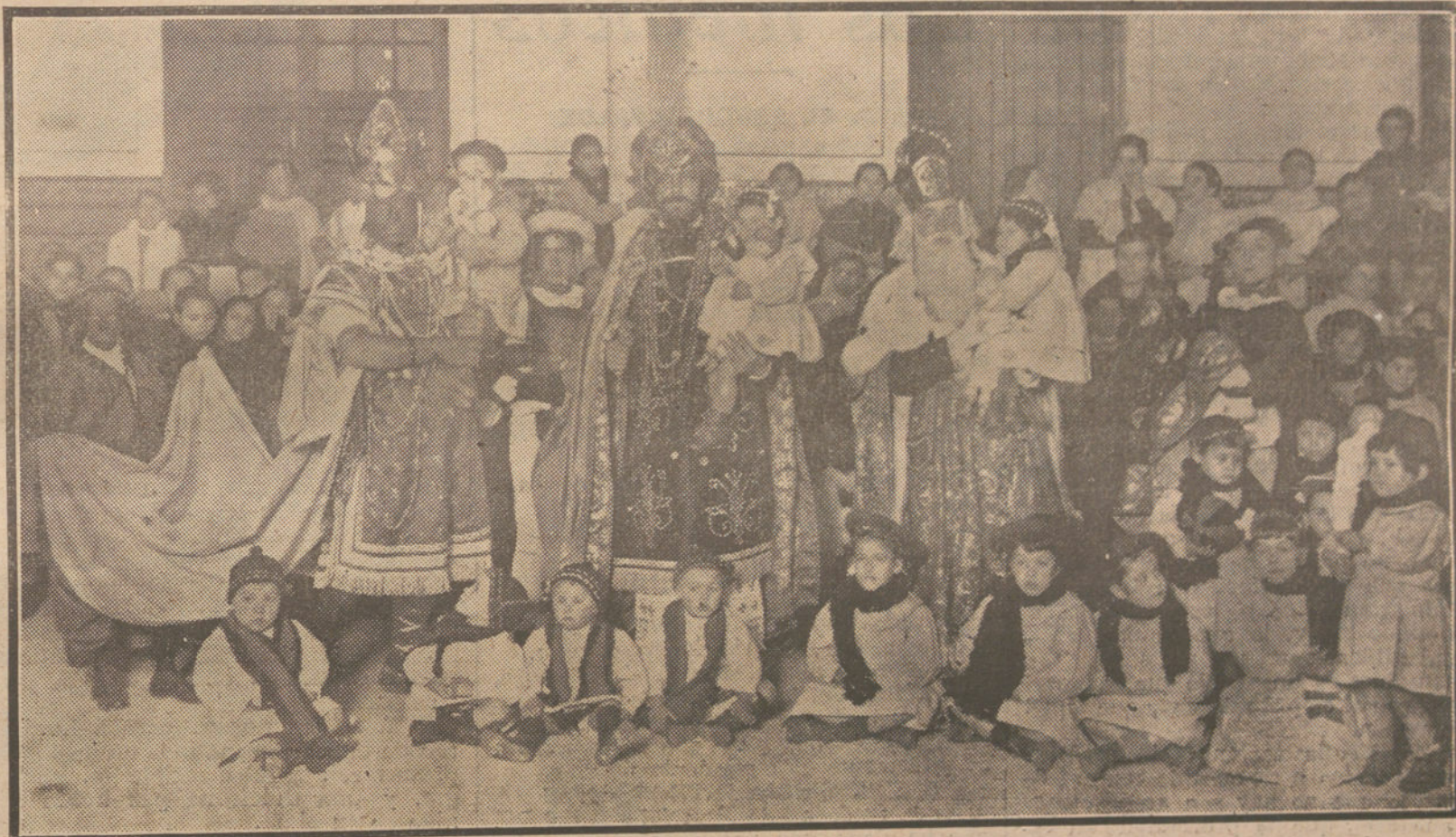
LA FIESTA DE REYES EN PROVINCIAS.—La cabalgata de los Reyes Magos, organizada en SEVILLA por el Ateneo, para repartir juguetes á los niños de los establecimientos benéficos.

Pero... ¡qué dolor! El Rey había castigado su imprudencia. No sólo había recogido los mejores juguetes, sino que se había llevado las más valiosas joyas del chinero.