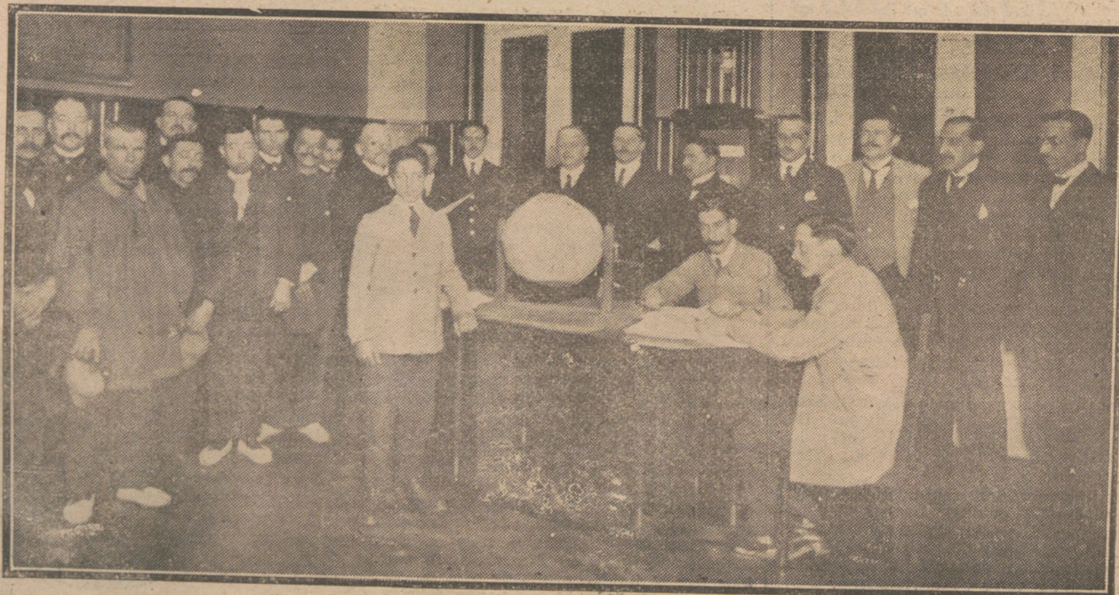
LA FIESTA DE REYES EN PROVINCIAS. — Los jefes de campo de los, presenciando el desfile de libretas de la C. de los tranvías, de BARCELONA, con una Comisión de Ahorro, que se regaló á los hijos de éstos, con motivo de