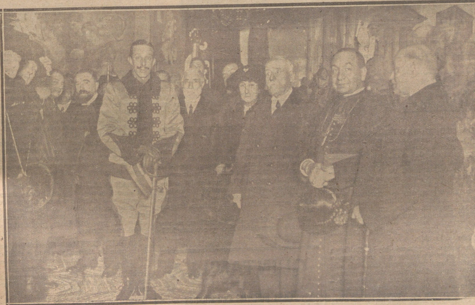
Su Majestad el Rey, viendo el nacimiento benéfico, instalado en la Real Academia de San Fernando.

Si hemos cedido a la fuerza, probemos al mundo entero con nuestra actitud digna y con nuestro trabajo asiduo que Rumania tiene derecho a que sus grandes aliados guarden con ella más consideraciones.—Radio.