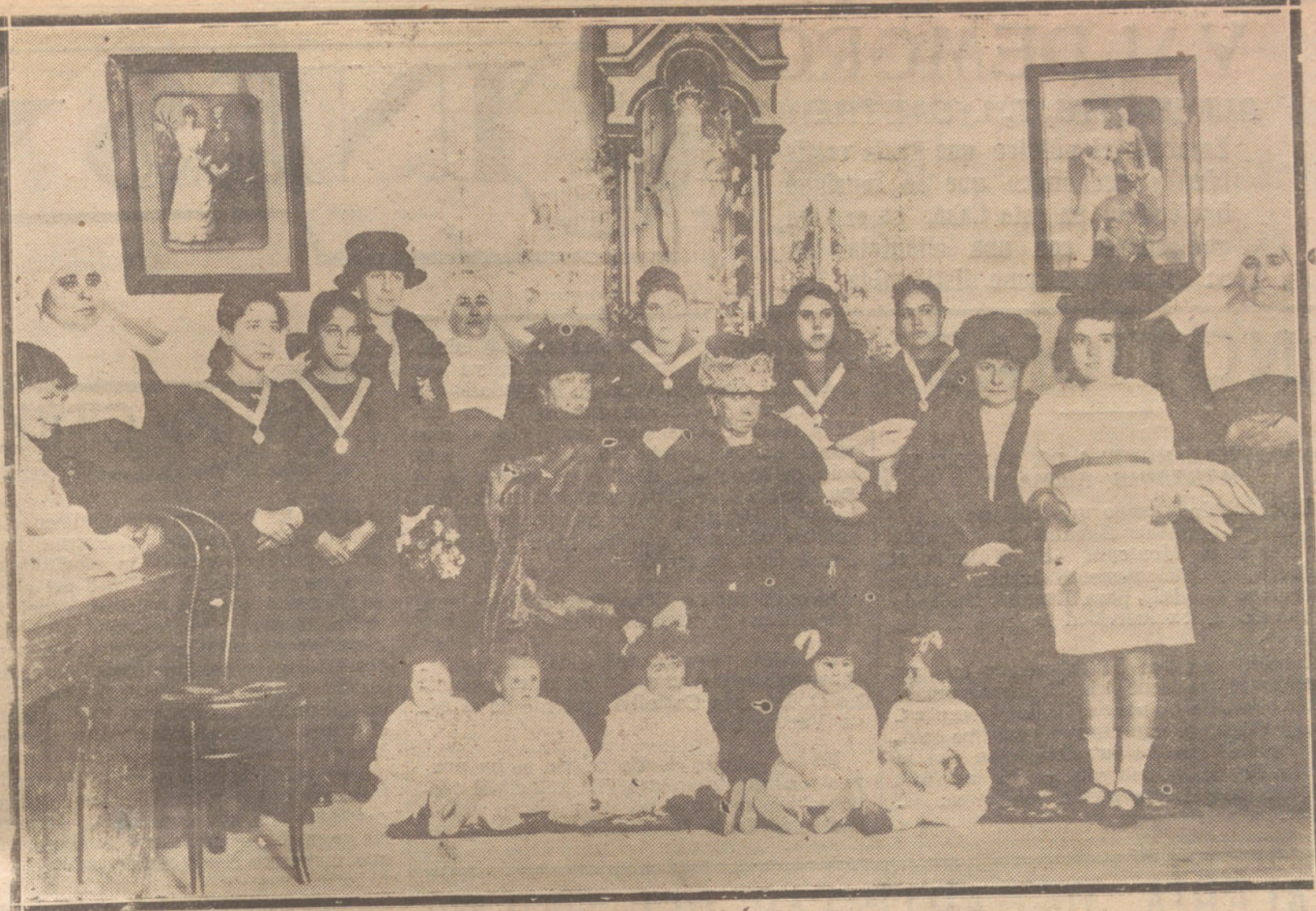
Su Majestad la Reina Doña María Cristina, después del reparto de ropas a las niñas del Asilo para hijas de lavanderas.