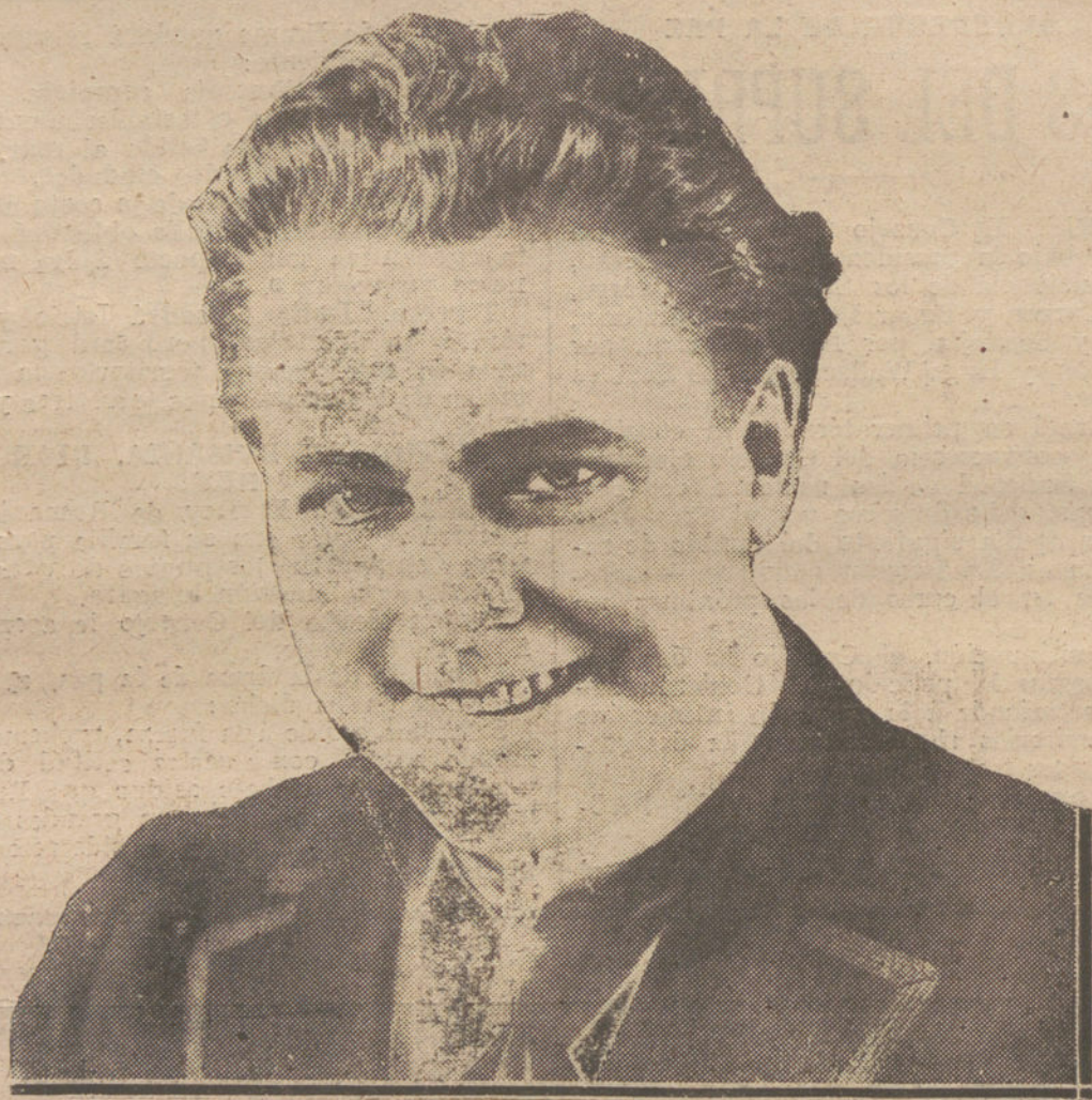
WILLIAM FARNUM.—Célebre actor norteamericano.