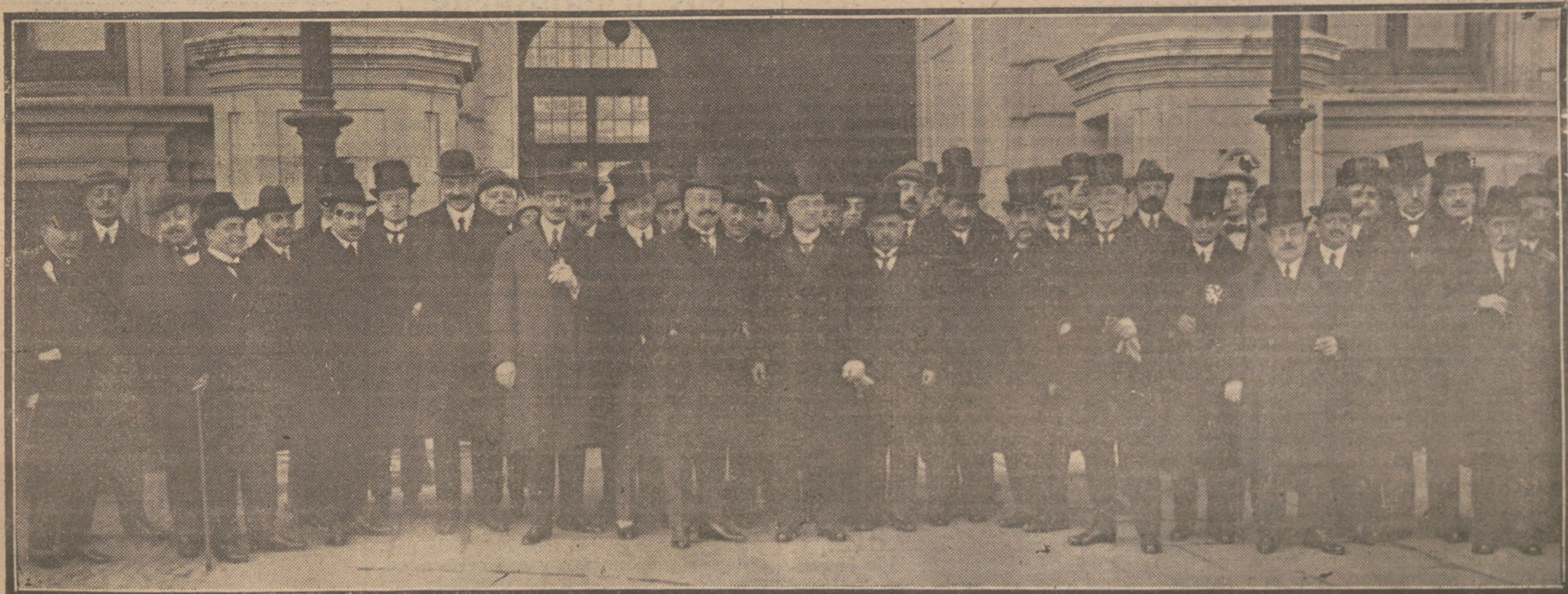
Los representantes de las fuerzas vivas del país, a frente de las cuales figura la Comisión catalana, saliendo de Palacio, después de cumplimentar á Su Majestad el Rey.

Los que echaran al Sr. Allendesalazar del banco azul seguramente no querían ocupar su puesto.