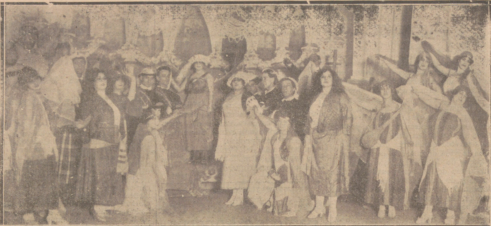
Una escena de la obra «La exposición de la Gloria», que se estrenará hoy en el teatro Martín.