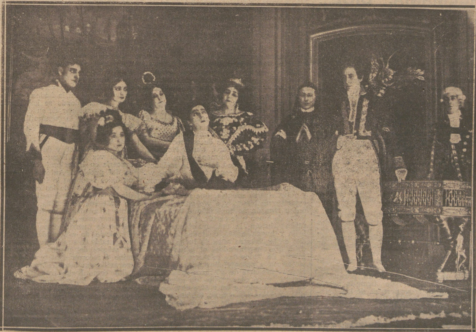
Una escena del último acto de «El aguilucho», obra estrenada ayer noche en el teatro de la Princesa, (Fot. VIDAL.)

Continúa guardando cama, á consecuencia de la afección gripal, el ministro de Fomento, D. Amalio Gimeno. La noche última la pasó con fiebre alta, que remitió un poco en la mañana de hoy.