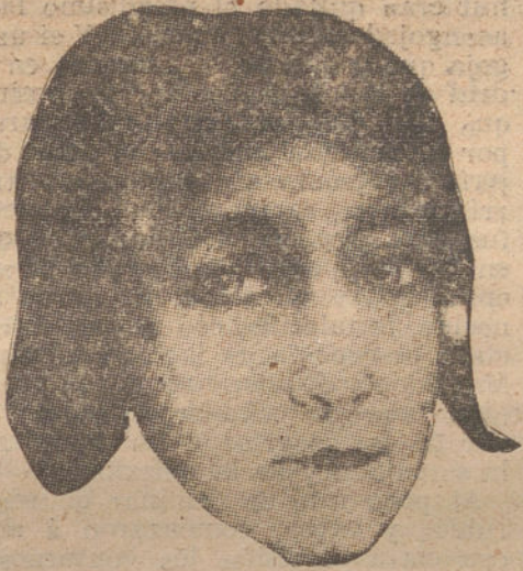
Mascarilla de Rachilde.

En toda su obra, no sólo en la que se titula así, está tratado el dominio del absurdo, porque quizás el demonio del ab-