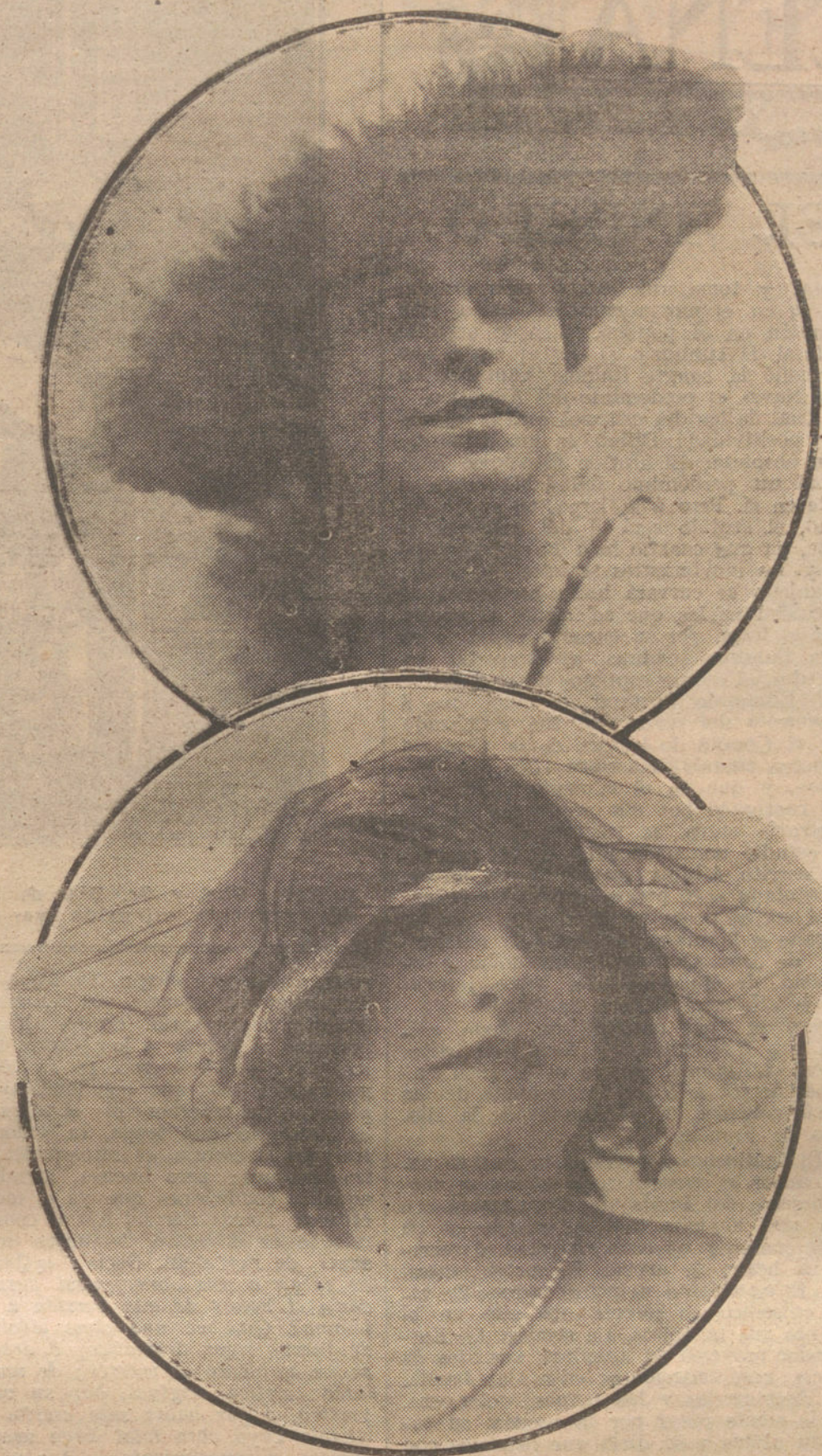
Sombrero ancho de tafetán, bordado de plumas de canario, modelo de la casa Virot. Debajo, sombrero de cordón de talco, cubierto de tul negro, creación de la modesta Marie Crozet, de París.