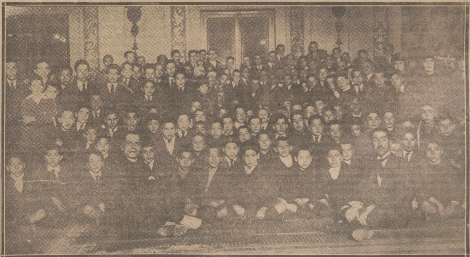
LAS JUVENTUDES HISPANOAMERICANAS.—Grupo de concurrentes a la sesión verificada ayer tarde en el Ayuntamiento por la Junta suprema del Patronato de Juventudes hispanoamericanas.

El prestigio del Ejército necesitaba ampararse en la autoridad fuerte del Gobierno.