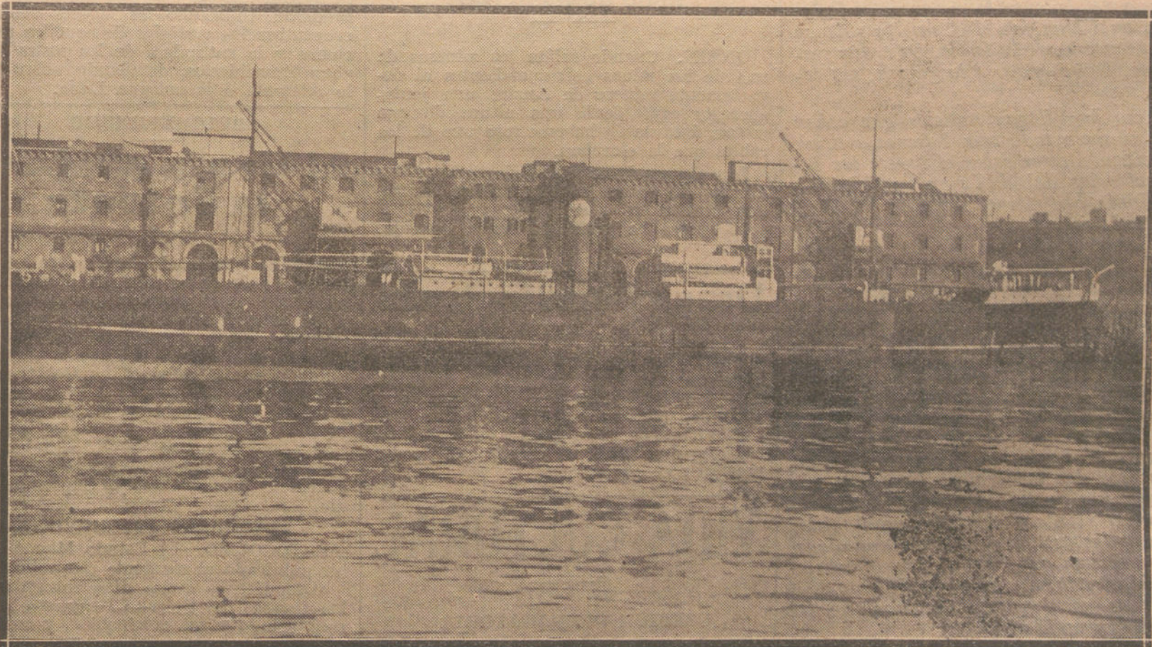
EL «LOCK-OUT» EN BARCELONA. El vapor inglés «Ruhier», que ha llevado al puerto de Barcelona 800 toneladas de carne congelada, para el consumo de la capital. (Fot. BADOSA.)

EL FERROL. Con objeto de encargar de las locomotoras de la línea Ferrol-Betanzos han salido varios maquinistas y fogoneros, pertenecientes a los acorazados «Alfonso XIII» y «España», aun cuando se sabe que dichos obreros no irán a la huelga.