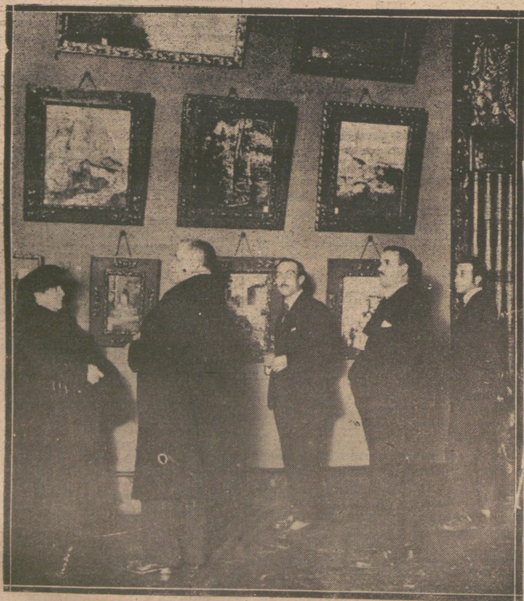
Un detalle de la notable Exposición de paisajes, originales de D. Enrique Vera, inaugurada ayer tarde en el «Salón Artístico».