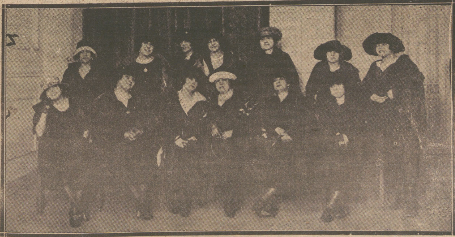
Artistas, sindicalistas que tomaron parte en la Asamblea celebrada ayer noche por el Sindicato de Actores dramáticos y líricos.

El entierro ha constituido una verdadera manifestación de duelo.