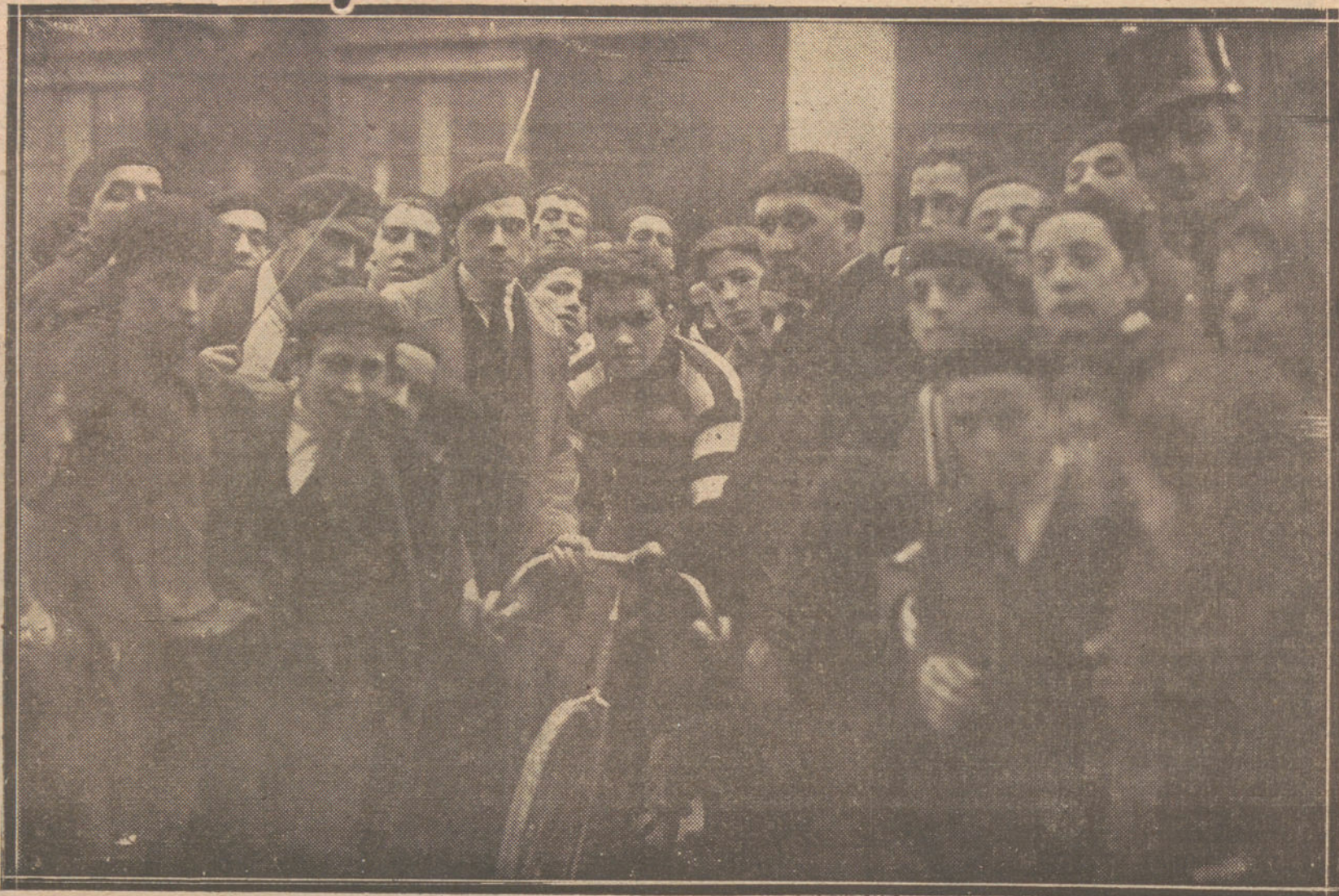
Los vencedores de las carreras ciclistas, celebradas en la capital donostiarra, con motivo de las fiestas conocidas con el nombre del «Día de San Sebastián».

Este baritono, que está subvencionado por la Diputación de Reinosa—su