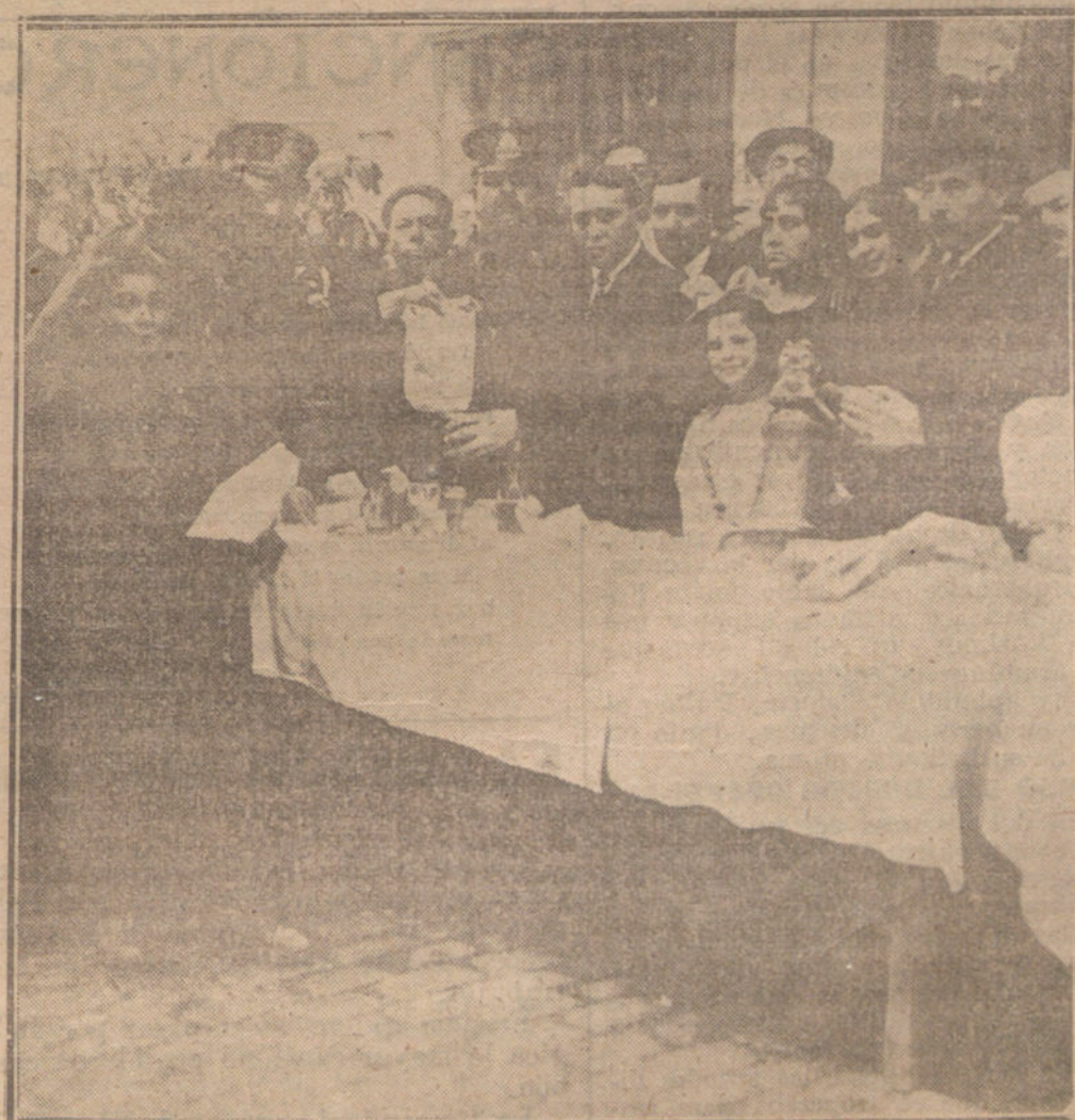
Reparto de comidas a los pobres, organizado por el Club Górrita-Chico y el Ayuntamiento de Madrid

El caso citado, sobre significar una extralimitación, no corresponde a las atenciones de que, por parte de los periodistas madrileños, son objeto sus compañeros extranjeros.