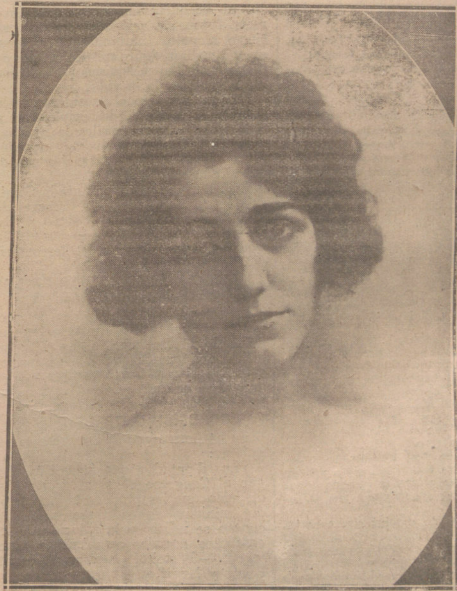
La notable tiple Matilde Revenga, que anoche se despidió del público del teatro Real.

Mostró éste en la misma elección que tuvo para su debut con el «Lohengrin», obra de tan alta poesía y que, aun dentro de su mismo italianismo