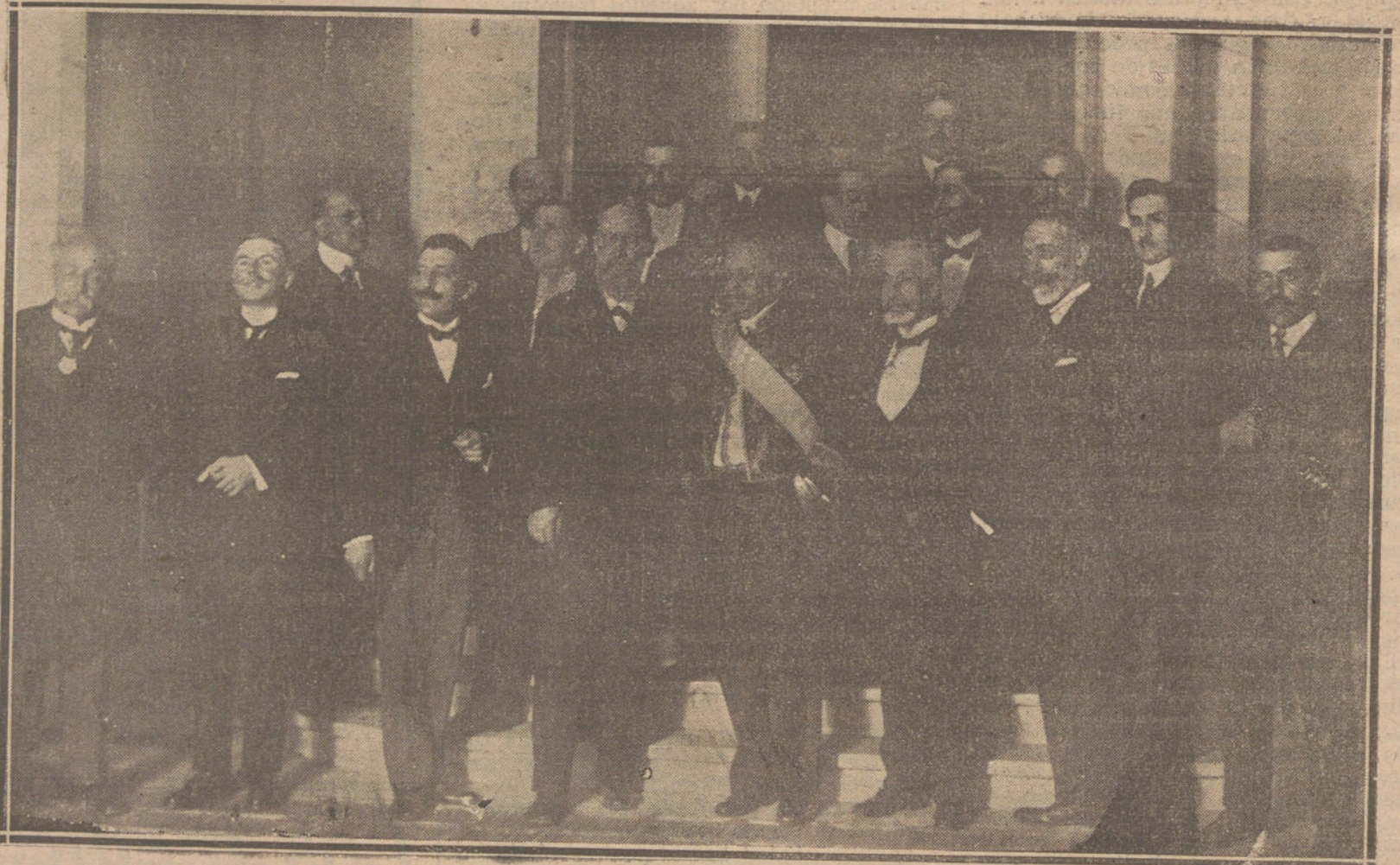
Ilustres personalidades que presidieron la apertura de curso y reparto de premios en la Real Academia de Medicina, acto verificado ayer tarde.

Asistieron al sepelio, que constituyó una sentida manifestación de duelo, el ministro de la Guerra, general Villalba; el capitán general de la región, Sr. Aguilera; el gobernador militar, general Romero Biencinto; el jefe de la Sección de Aeronáutica, general Echagüe; el coronel Soriano; todos los