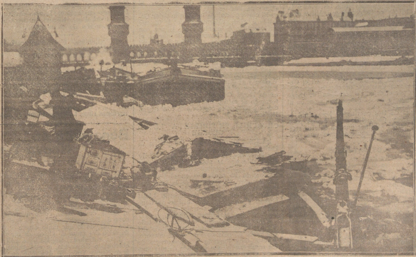
INVIERNO EN BERLIN.—Destrozos causados por el temporal de nieve en el embarcadero del Sures.

El director de la Compañía Hidroeléctrica Española solicitó el envío de guardias, que protejan la libertad del trabajo en su fábrica.