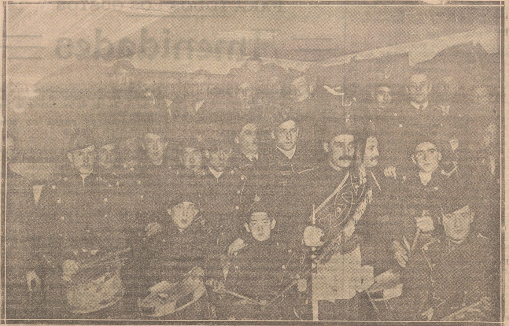
LAS FIESTAS DE SAN SEBASTIAN.—Socios de la Euskal-Billea, que formaron la tradicional tamborilada.

Continúa sin solucionarse la huelga del personal de Teléfonos.