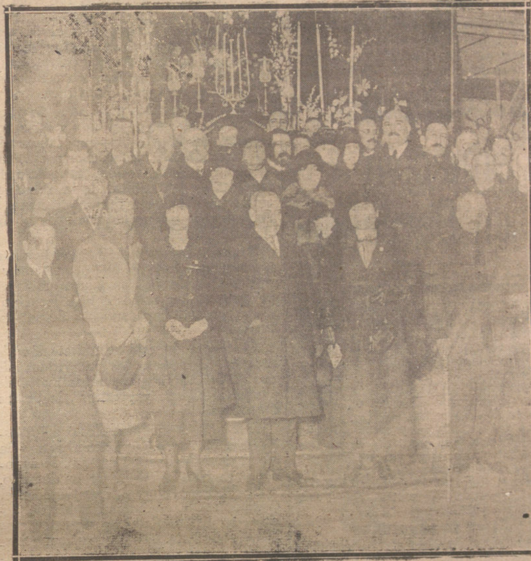
EL HOMENAJE A CONCEPCION ARENAL.—El subsecretario de Gracia y Justicia, con el director de la Cárcel Modelo y concurrentes a la fiesta celebrada en dicho establecimiento.

Esta frase del Sr. Dato es todo un programa, y ella encierra toda la actuación del Sr. Dato en el pasado, en el presente y en el porvenir. Monarquico ferviente y servidor del Rey, no ha de comprometer al Régimen con una fusión, que sería un error lamentable. Si el partido liberal-conservador se fusionara con el Sr. La Cierva, per-