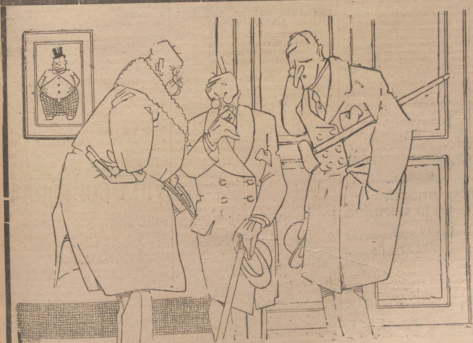
CONSULTA DE ALIENISTAS

Pese a todos los vaticinios que vienen haciendo los interesados en que prosperen estos Sindicatos facciosos de liberales y conservadores, Sindicatos inventados por el Sr. La Cierva y por el funesto conde de Romanones, la unión no se hará ni en ella ha pensado el Sr. Dato; lo único que hará el jefe del partido liberal-conservador es decir, una vez más, que para bien de todos, el partido liberal-conservador, que no es reaccionario ni absolutista, aceptará gustoso en todo momento la reincorporación de elementos afines, que mal aconsejados, siguen una política que todo el país reputa de insensata, para seguir las tradiciones liberales del