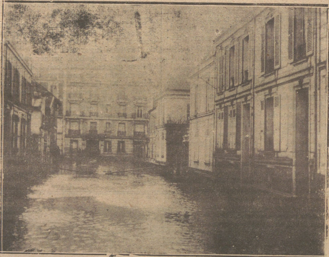
París, convertido en ciudad lacustre. La rue Adélaïde.

Un portero parisiense recibiendo a los proveedores de la casa