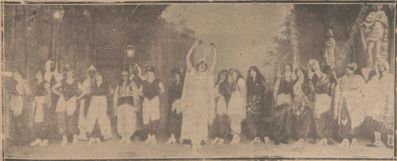
Una escena de la obra “El gabán de Edipo”, estrenada anoche en el teatro de Novedades.

“Armas y Letras” es una admirable revista militar confeccionada con admirable gusto, y que constituye un verdadero abanico tipográfico.