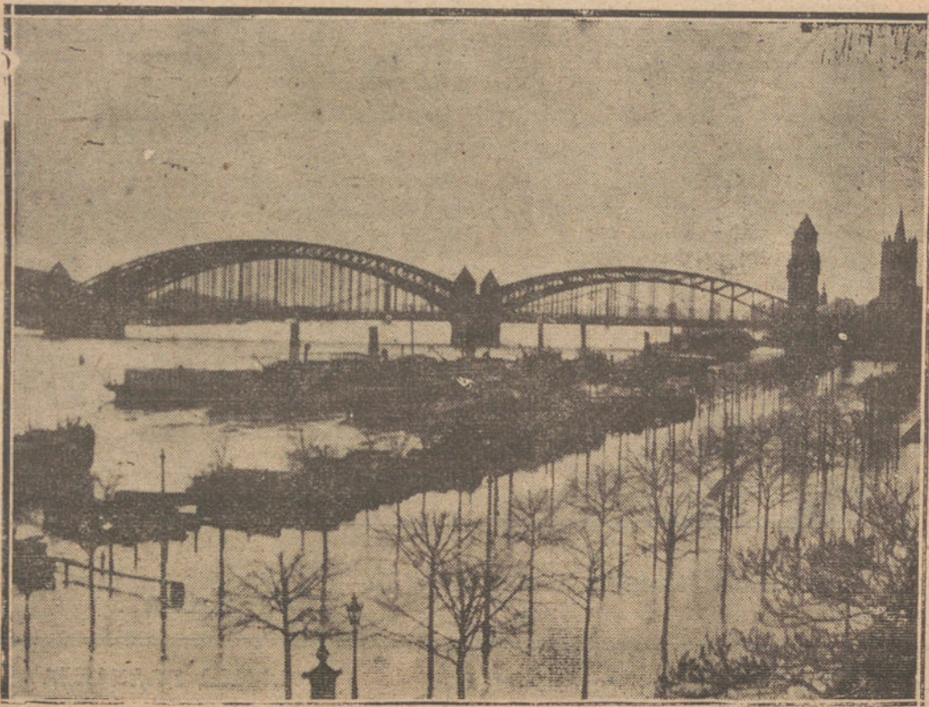
COLONIA.—La ciudad, invadida por las aguas del Rhin.