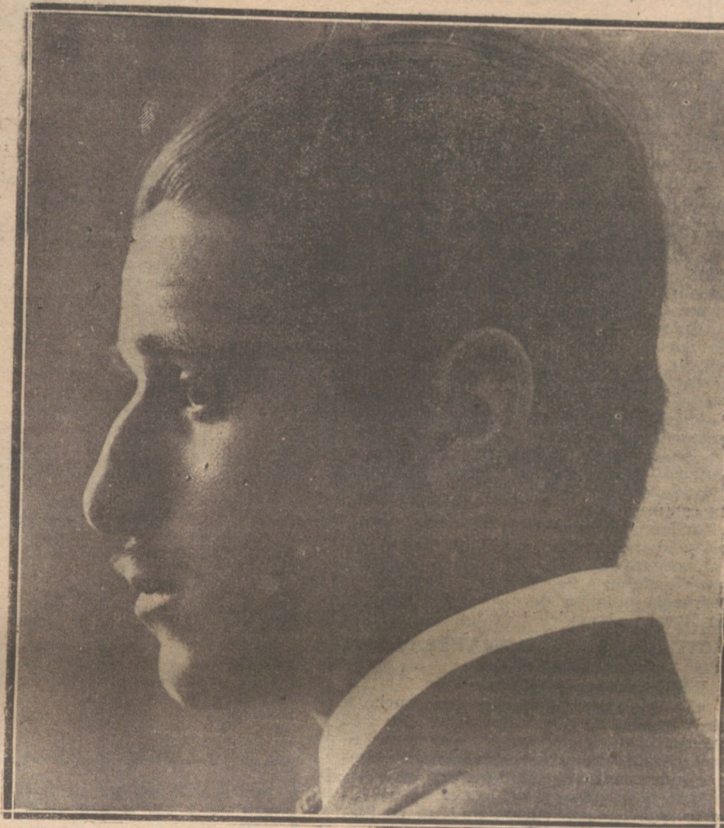
EL MARQUES DE VILLABRAGIMA

El problema de la municipalización.-Saneamiento e higiene.-Los Presupuestos.-Reformas en Ma- drid.-La labor de las Comisiones.-El personal del Municipio.