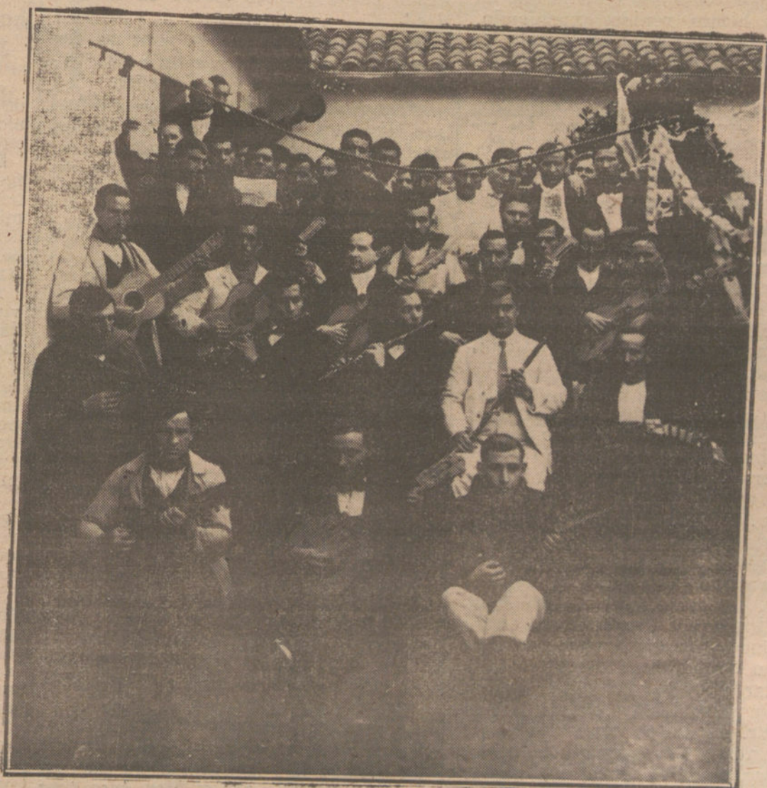
EL CENTENARIO DE CONCEPCION ARENAL.—Orquesta de procos que dió varios conciertos en el Penal de Santona, con motivo de las fiestas del centenario.