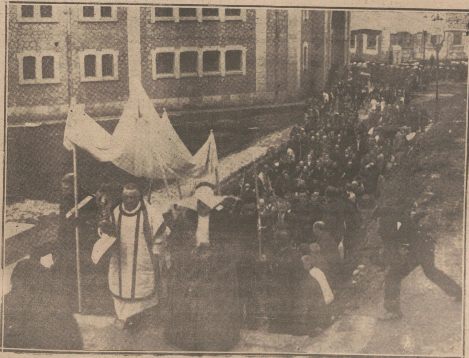
EL CENTENARIO DE CONCEPCION ARENAL.—Pintoresca procesión verificada en el presidio de Santoña con motivo de las fiestas del centenario.

Y España no deberá tampoco transigir con qué se aplique a Tánger el artículo quinto del Tratado franco-marro-