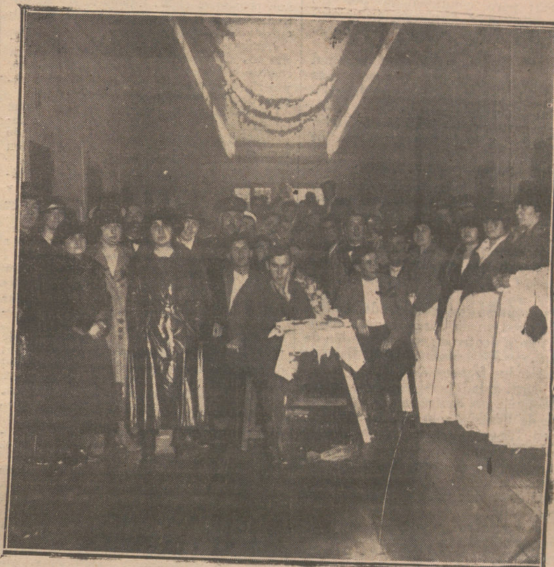
EL CENTENARIO DE CONCEPCION ARENAL.—Maestras y alumnas que sirven una comida extraordinaria a los presos de la cárcel de San Sebastián.

Y esto sería una transgresión del Acta de Algeciras—todavía vigente—y del acuerdo hispanofrancés de 23 de Febrero de 1907.