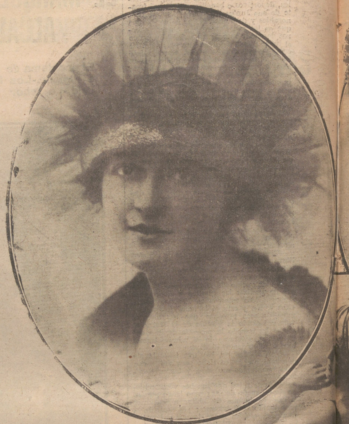
Modelos de sombreros de hilo de oro con tul y castor con plumas, y elegante traje «soirée» en calen, gasa y piedras de colores, creaciones de la Casa Genovieve, de París.

antiguos jefes de Estado Mayor, reinando una disciplina rigurosísima. No se conoce exactamente la composición de las fuerzas bolcheviki, pero se sabe que los «coolis» chinos no constituyen la tropa de combate, siendo ellos utilizados como obreros detrás del frente. Se asegura, por lo demás, que en las primeras filas se encuentran numerosas tribus de las estepas asiáticas, medio salvajes, que constituyen un serio peligro para los territorios que caigan en su poder.