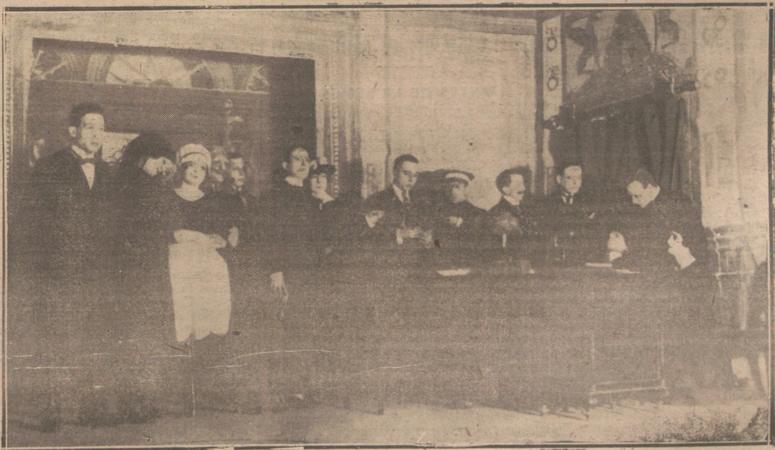
UNA ESCENA DE «LOS PASOS DEL MUERTO», OBRA POLICIACA, ESTRENADA ANOCHES EN EL TEATRO DE FUENCARRAL.