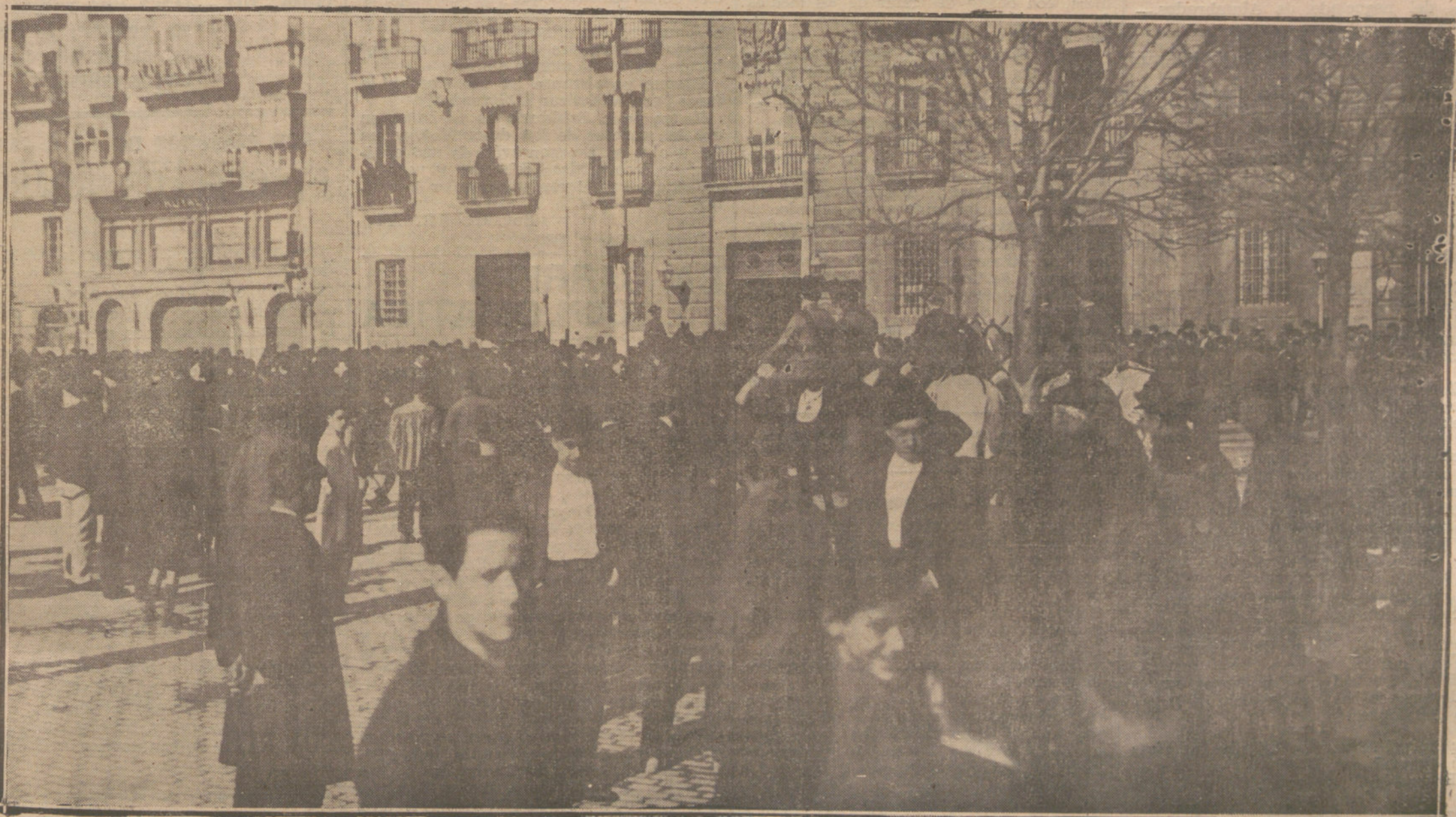
LA HUELGA GENERAL EN SANTANDER.—ASP ECTO DE LOS ALREDEDORES DEL GOBIERNO CIVIL, DURANTE UNA DE LAS CARGAS DADAS POR LA FUERZA PUBLICA PARA DISOLVER LA MANIFESTACION OBRERA.

Los buques han sido enviados al lazareto, sometiéndolos a una desinfección rigurosa.—Agencia Americana.