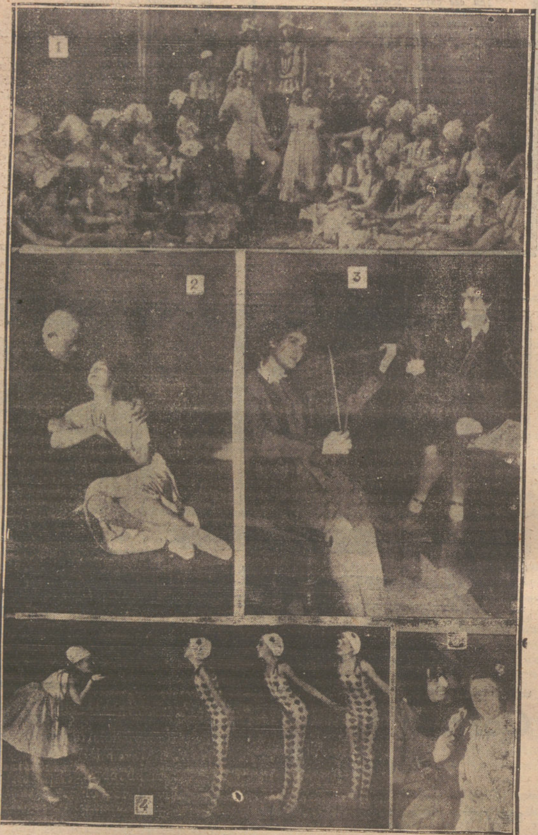
NUM. 1: UNA ESCENA DE LA MARCHA-PANTOMIMA «LAS FLORES DE IDA», ESTRENADA EN LA OPERA NACIONAL.—NUM. 2: UNA ESCENA DE LA ULTIMA OBRA DE VEDEKING, «FRANCISCA», ESTRENADA EN EL TEATRO DE LA TRIBUNA.—NUM. 3: UNA ESCENA DE LA OBRA DE HANS PEITZNER, «PALESTRINA», ESTRENADA EN LA OPERA NACIONAL.—NUM. 4: UNA ESCENA DEL BAILE «SILUETAS», EN LA OPERA NACIONAL. A LA IZQUIERDA, LA GRAN BAILARINA ALEMANA SEÑORITA BOWITZ.—NUM. 5: UNA ESCENA DE LA OBRA «EVITA HUMBRECHT», REPRESENTADA EN EL TEATRO DE LA RESIDENCIA