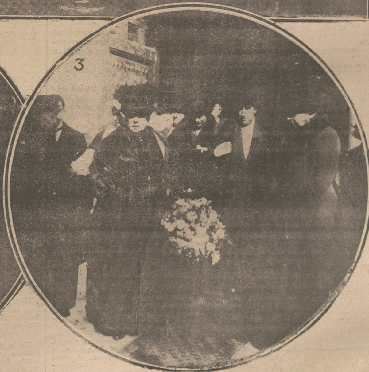
NUM. 1: SU MAJESTAD LA REINA VICTORIA Y SU ALTEZA LA INFANTA ISABEL, DURANTE EL REPARTO DE COMIDAS A LOS POBRES, VERIFICADO EN EL HOSPITAL DEL CARMEN. NUM. 2: SU MAJESTAD LA REINA VICTORIA, SALIENDO DEL OTTADO BENEFICO ESTABLECIMIENTO.—NUM. 3: SU ALTEZA LA INFANTA ISABEL, AL SALIR DEL HOSPITAL DEL CARMEN.