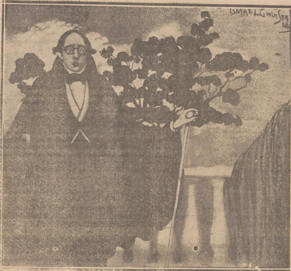
Dibujo de ISMAEL G. DE LA SERNA