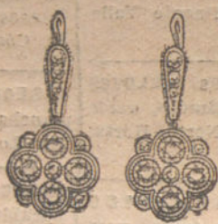
Núm. 1.—Pendientes 4. brillantes y diamantes. Pesetas 300.