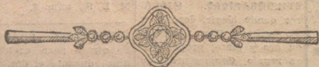
Núm. 1.—Imperdible 3 brillantes y diamantes. Pesetas 275.