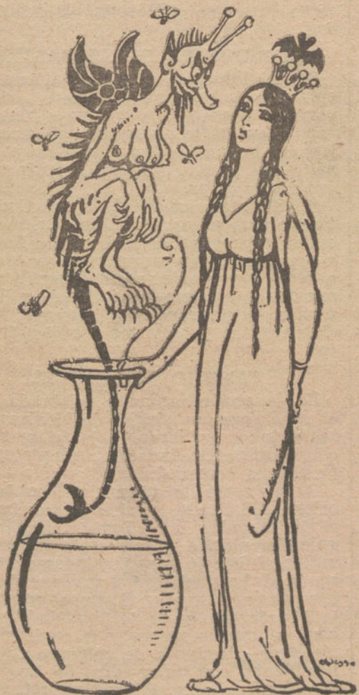
BARCELONA. AL MICROBIO DE LA GRIPE.—NO PODRÍAS DECLARARNOS UNAS CUANTAS SEMANAS DE «LOCK-OUT»?