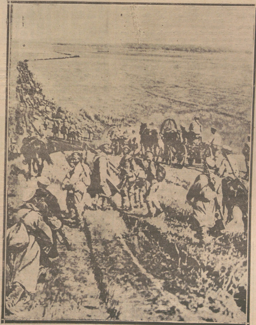
LA LUCHA CONTRA EL BOLSHEVISMO.—EL EJERCITO DE KOLTCHAK, DURANTE SU RETIRADA DE LOS CAMPOS DE BATALLA DE MADRID.

Las inscripciones para el curso son gratuitas, y deben hacerse por carta a la Secretaría de la Junta para Ampliación de Estudios, Moreto, 1, Madrid, expresando la edad, domicilio y estudios o prácticas anteriores de cada solicitante. El número de los que pueden admitirse es muy limitado, en razón de la capacidad del laboratorio.