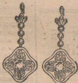
Núm. 4.—Pendientes 8 brillantes y diamantes. Pesetas 700.