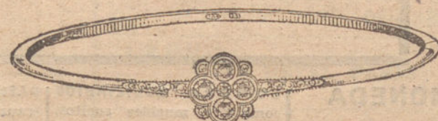
Núm. 3.—Pulsera 3 brillantes y diamantes. Pesetas 450.