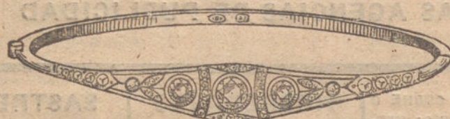
Núm. 2.—Pulsera 5 brillantes y diamantes. Pesetas 400.