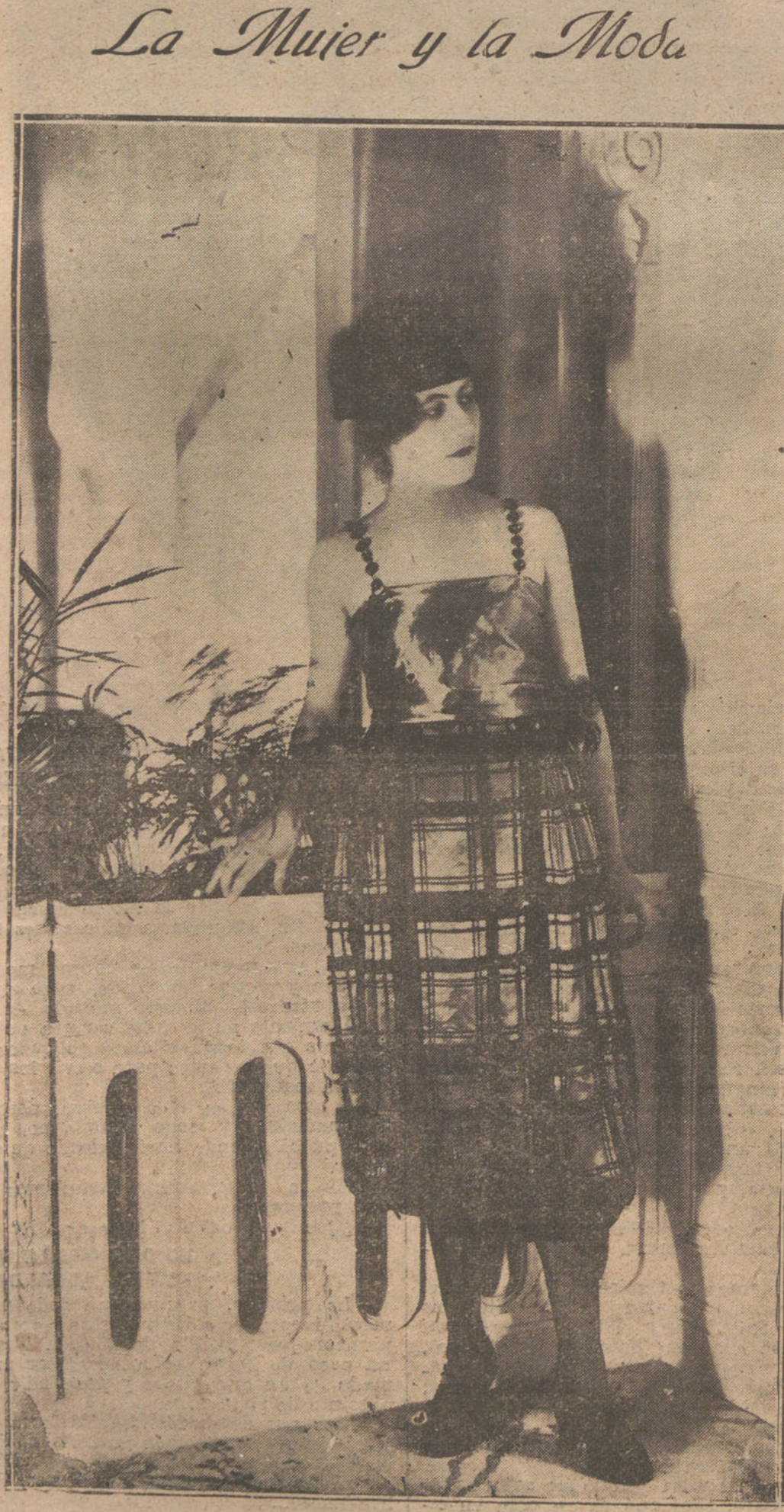
ORIGINAL TRAJE DE SEDAS MULTICOLORS. MODELO PRESENTADO POR LA CASA DOCAZ Y JOSETT

Un telegrama de Amsterdam dice que el ex Kronprinz regresará próximamente a Alemania y residirá en el castillo de Cecilienhof, cerca de Potsdam, donde el Gobierno prusiano, por una reciente votación, le ha dado permiso para vivir.—Radio.