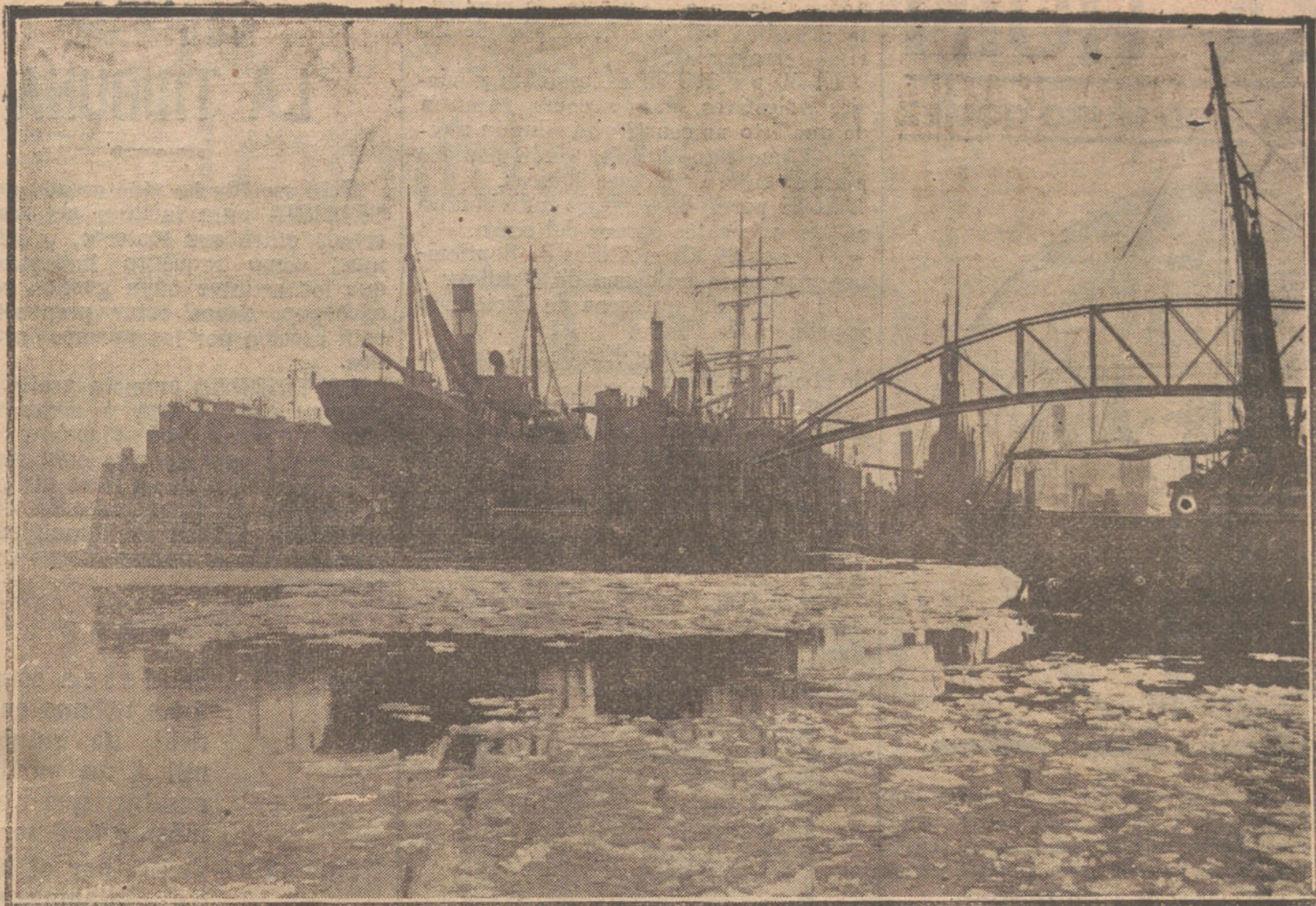
LO QUE PIDE ALEMANIA CON LA GUERRA.—INSTALACION DE LOS DOCKS FLOTANTES DEL PUERTO DE HAMBURGO, QUE PASAN PODER DE LOS ALIADOS EN VIRTUD DEL TRATADO DE PAZ.