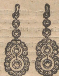
Núm. 6.—Pendientes 4 brillantes y diamantes. Pesetas 800.