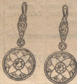
Núm. 2.—Pendientes 10 brillantes y diamantes. Pesetas 450.