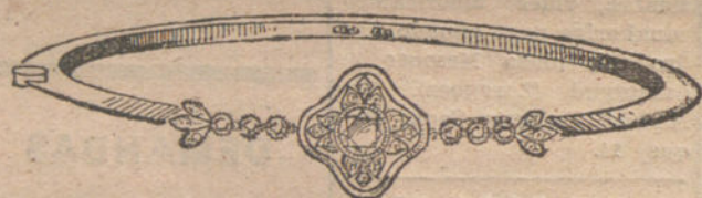
Núm. 4.—Pulsera 1 brillante y diamantes. Pesetas 450.