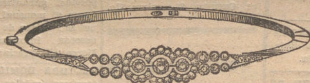
Núm. 5.—Pulsera 7 brillantes y diamantes. Pesetas 575.