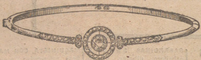
Núm. 1.—Pulsera 3 brillantes y diamantes. Pesetas 300.

MONTURAS DE PLATINO FINO Y ORO DE LEY 18 QUILATES CONTRASTADO