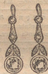
Núm. 3.—Pendientes 10 brillantes y diamantes. Pesetas 450.