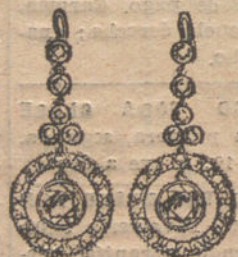
Núm. 5.—Pendientes 6 brillantes y diamantes. Pesetas 750.