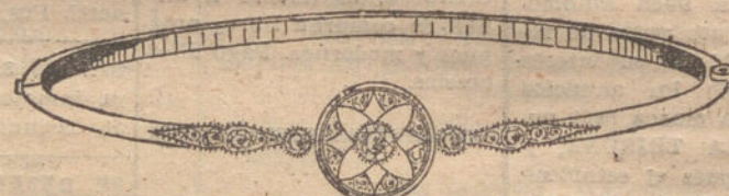
Núm. 6.—Pulsera 5 brillantes y diamantes. Pesetas 725.