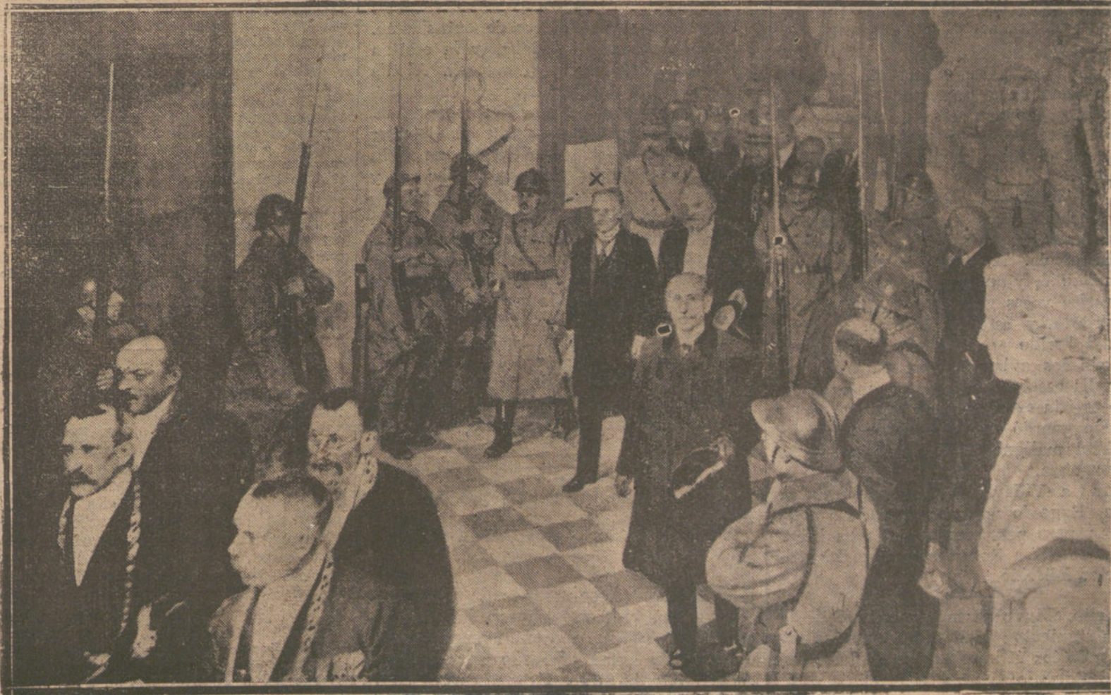
EL NUEVO PRESIDENTE FRANCÉS.—M. PAUL DESCHANEL (x), ACOMPAÑADO DE M. LEON BOURGEOIS, QUE PRESIDIO LAS ELECCIONES, SALIENDO DE LA CAMARA, DESPUES DE SU PROCLAMACION.

Los partidarios de reservas moderadas han hecho saber igualmente al señor Lodge que podría contar con sus votos.