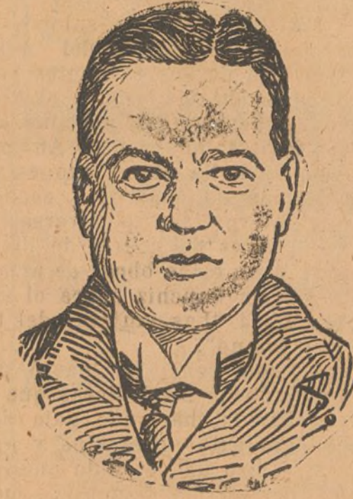
Mr. Herbert C. Hoover, que ha tomado posesión de la presidencia de los Estados Unidos de Norte América.