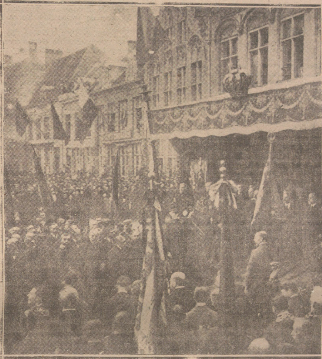
LAS CIUDADES CONDECORADAS.—SOLEMNE CEREMONIA DE LA ENTREGA DE LA CRUZ DE GUERRA A LA CIUDAD DE FUMES, ACTO AL QUE ASISTIERON EL REY ALBERTO DE BELGICA Y EL GENERAL FOCH.

«Los Ejércitos combaten; pero son los pueblos, en realidad, quienes hacen la guerra... Así se explica que en el momento mismo en que el pueblo