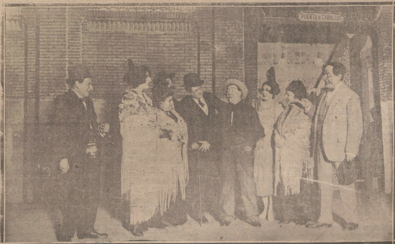
UNA ESCENA DE «LOS BRAZOS CAIDOS», OBRA ESTRENADA ANOCHES EN EL TEATRO COMICO.