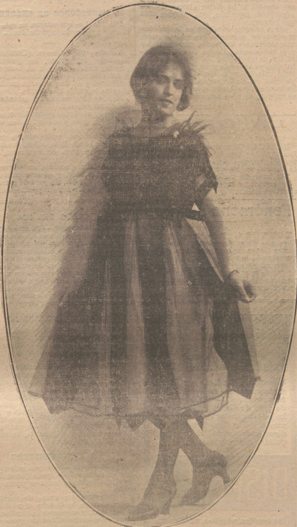
TRAJE DE SATEN, CUBIERTO DE TUL, CON TIRAS DE RASO, MODELO DE LA CASA TOURING