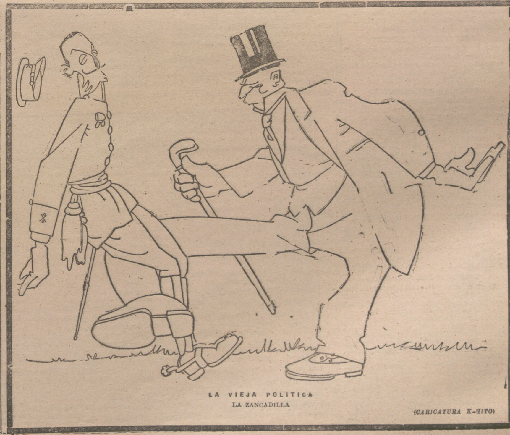
LA VIEJA POLITICA LA ZANCADILLA