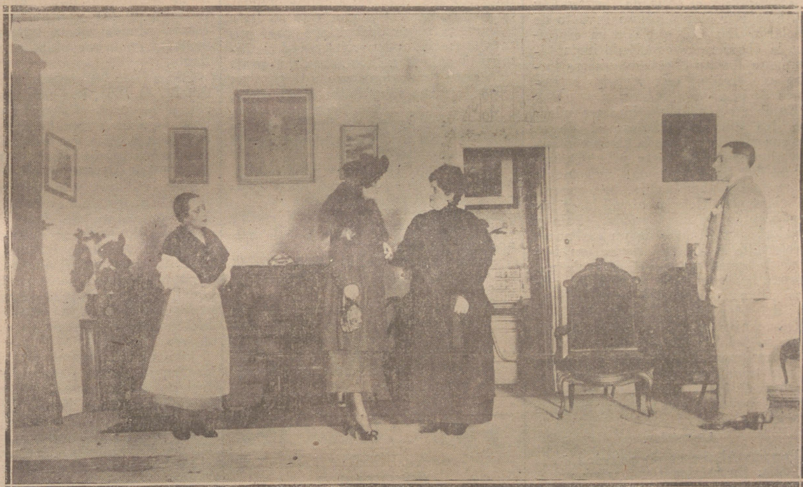
UNA ESCENA DE LA COMEDIA «EL MUNDO ES UN PAÑUELO», QUE SE ESTRENA ESTA NOCHE EN EL TEATRO DE LA INFANTA ISABEL.