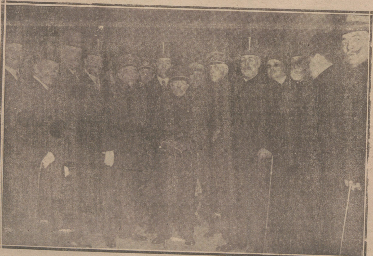
EL GOBIERNO Y LAS AUTORIDADES LOCALES, EN LA ESTACION DEL MEDIODIA, DESPIDIENDO AL NUEVO CAPITAN GENERAL DE CATALUNA, DON VALERIANO WEYLER.