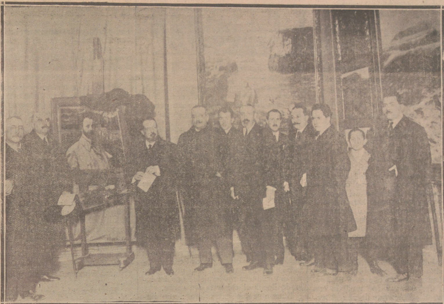
INAUGURACION DE LA EXPOSICION DE OBRAS DEL MALOGRADO ARTISTA MARTINEZ ABADES, ACTO VERIFICADO AYER EN EL SALON DEL CIRCULO DE BELLAS ARTES, Y QUE FUE PRESIDIDO POR EL MINISTRO DE INSTRUCCION PUBLICA.

publica diariamente una SECCION DE ALQUILERES, donde se anuncian las peticiones y demandas de viviendas.