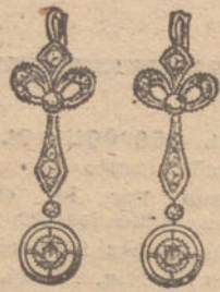
Núm. 2.—4 brillantes y diamantes. Ptas. 240.