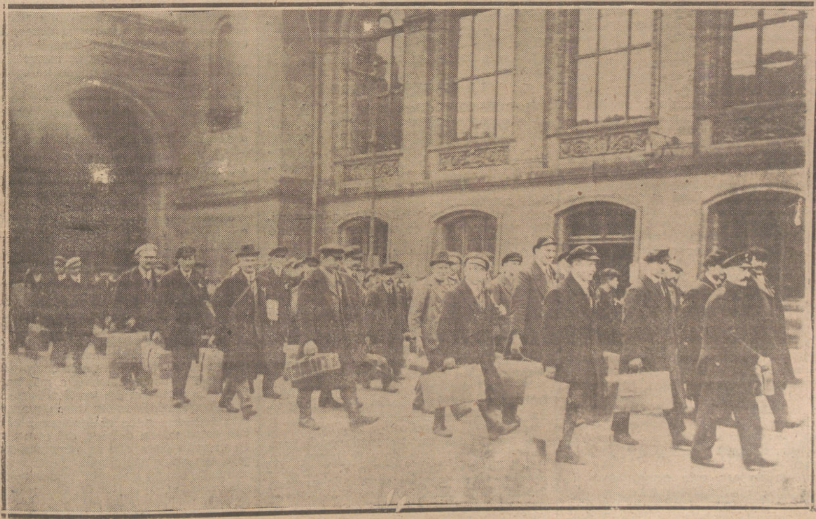
REGRESO A ALEMANIA DE LOS PRISIONEROS.—LLEGADA A BERLIN DE LA PRIMERA EXPEDICION DE PRISIONEROS ALEMANES, QUE SE ENCONTRABAN EN LOS CAMPOS DE CONCENTRACION DE FRANCIA.