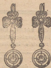
Núm. 3.—6 brillantes y diamantes. Ptas. 290.