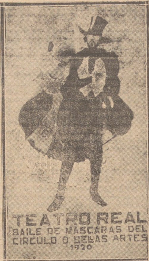
EL CARTEL DE ESTE AÑO

Ya ha pasado la hora del cartel de 1920, y sus últimas resultas han sido la colocación del premiado en las esquinas y el baquete de desagravio al no premiado, baquete que se celebró hace unas noches en el coro de la taberna el Pulpito—del