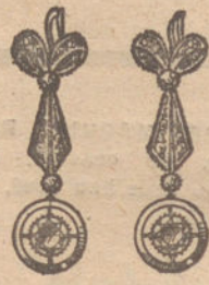
Núm. 4.—6 brillantes y diamantes. Ptas. 350