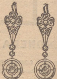
Núm. 5.—6 brillantes y diamantes. Ptas. 400.