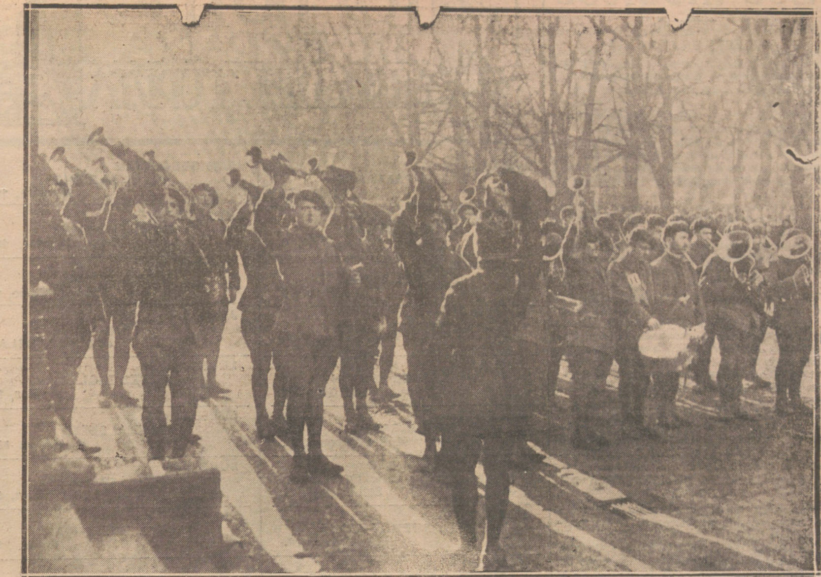
EL TRATADO DE PAZ.—TROPAS FRANCESAS, HACIENDO SU ENTRADA EN SLESVIG, DESPUES DEL PLEBISCITO PUBLICO. (FOTOGRAFIA ILLUSTRATION.)

Los alemanes, pacientes y sumisos, obedecían a sus jefes, se sacrificaban por ellos; también a nosotros se nos dice que es éste nuestro deber. Hacer responsable al sencillo pueblo alemán de las faltas de sus jefes, sería exactamen-