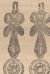
Núm. 9.—6 brillante y diamantes. Ptas. 975.