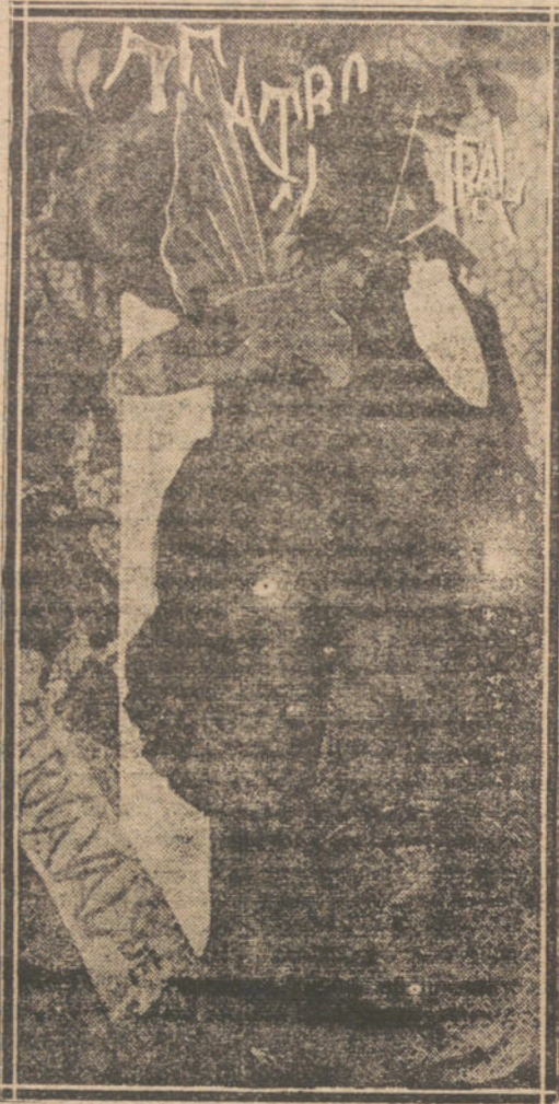
UN CARTEL ANTIGUO

Desde entonces, cuántos desengaños he visto y cuánta gente nueva dispuesta al sacrificio, ingenua, contando con el premio por creer que lo suyo es lo más decorativo, lo mejor de técnica o lo más genial! Y desde entonces, ¡qué chillones se han hecho los carteles! ¡Como si anunciase un producto del comercio en vez de ser una ilustración, más que un anuncio al Carnaval. Me di cuenta de lo equivocada