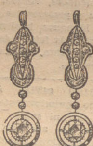
Núm. 7.—6 brillantes y diamantes. Ptas. 650.