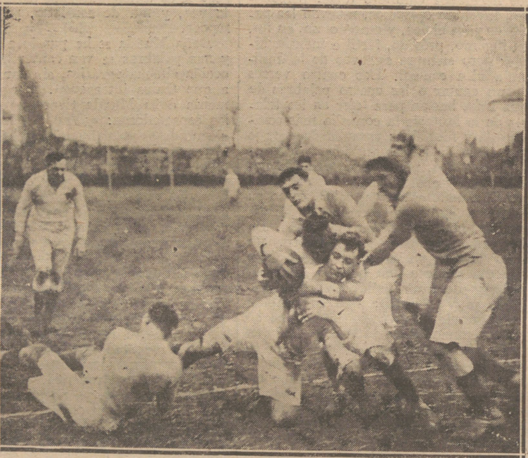
LOS DEPORTES EN EL EXTRANJERO.—DETALLES DEL GRAN «MATCH» INTERNACIONAL DE FOOT-BALL A LUCHA LIBRE, EN EL QUE LOS EQUIPOS INGLES VENCIERON POR UN TANTO A CERO, A LOS EQUIPOS FRANCESES. (FOTOGRAFIA ILLUSTRATED.)

cambios inmediatos; contentémoslos con infiltrar toda la justicia y caridad posibles en las leyes, y aun más que en la letra de ellas, en la aplicación de las mismas, en las costumbres, en la reforma individual, que es base indispensable de la reforma colectiva.»