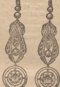
Núm. 10.—8 brillan- tes y diamantes. Pt s. 1.100.

Factura de garantía en todas las compras.