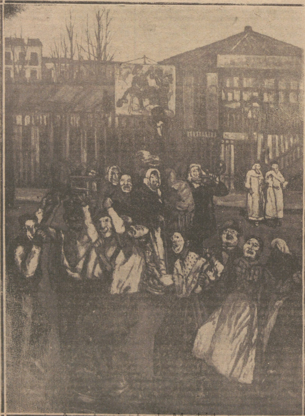
Ayuntamiento de Madrid

do que estaba el nuevo cartel, un día, hace ya unos cuantos años, en un colto de caza que hay en las proximidades de Madrid y en la hora de entrar en busca del sabroso arroz del cazador, en esa casita de aldea que se levanta en medio de los ocotos, al ver cogidos de las paredes del comedor una colección de carteles antiguos de los Carnavales pasados, carteles sombríos y encantadores, muy cursis, pero con la nota enternecedora para la gente distinguida, a la que llamaron en vísperas del baile, que no es precisamente de gentes desastradas ni de pelafustranes.