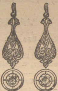
Núm. 6.—4 brillantes y diamantes. Ptas. 575.