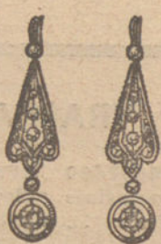
Núm. 1.—4 brillantes y diamantes. Ptas. 215.

MONTURAS DE PLATINO FINO Y ORO DE LEY 18 QUILATES CONTRASTADO