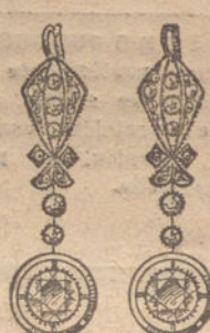
Núm. 8.—8 brillantes y diamantes. Ptas. 750.