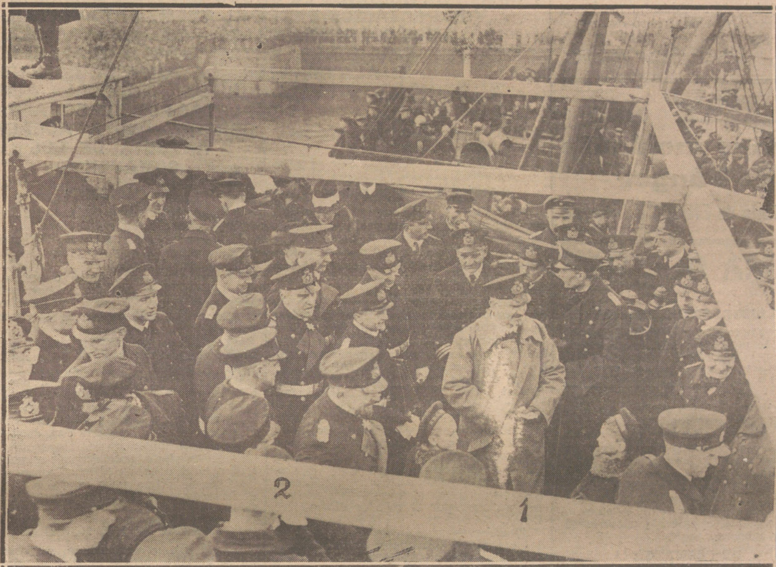
REGRESO A ALEMANIA DE LAS TRIPULACIONES DE LAS ESCUADRAS HUNDIDAS EN SCAPA FLOW.—LLEGADA DEL ALMIRANTE VON REPPNER (1), A BORDO DEL «LISBOA». EL CONTRAALMIRANTE VON TROTHA (2), QUE ACUDIO A RECIBIRLE.

Unos cuantos hombres—últimos vestigios del dilectantismo retórico—discuten sobre las cosas que suceden, como si discutiéndolas pudieran evitar que sucediesen. Ellos tienen la vana pretensión de creer que la conclusión de un silogismo en «Darepte» o en «Baroco» puede influir sobre la marcha de la humanidad, sin darse cuenta de que la humanidad, que ha justificado la Lógica, puede transformarla o invertirla. No es la Lógica la que debe orientar a los hombres, sino los hombres los que han de señalar la dirección de la Lógica. Una cosa no es lógica, ni «debe ser», cuando los que han inventado y sostenido un sistema dialéctico, lo abandonan por otro, que está más conforme con la realidad de un momento determinado. La mayoría, que tiene el poder absoluto de crear y destruir sistemas, no es nunca ilógica ni inconsecuente, ya que hace lo que necesita y lo que puede hacer. Es inútil que los representantes de los siste-