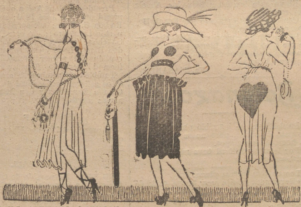
«Scaramouche et Pulcinella Gesticulent noirs sur la lune...»