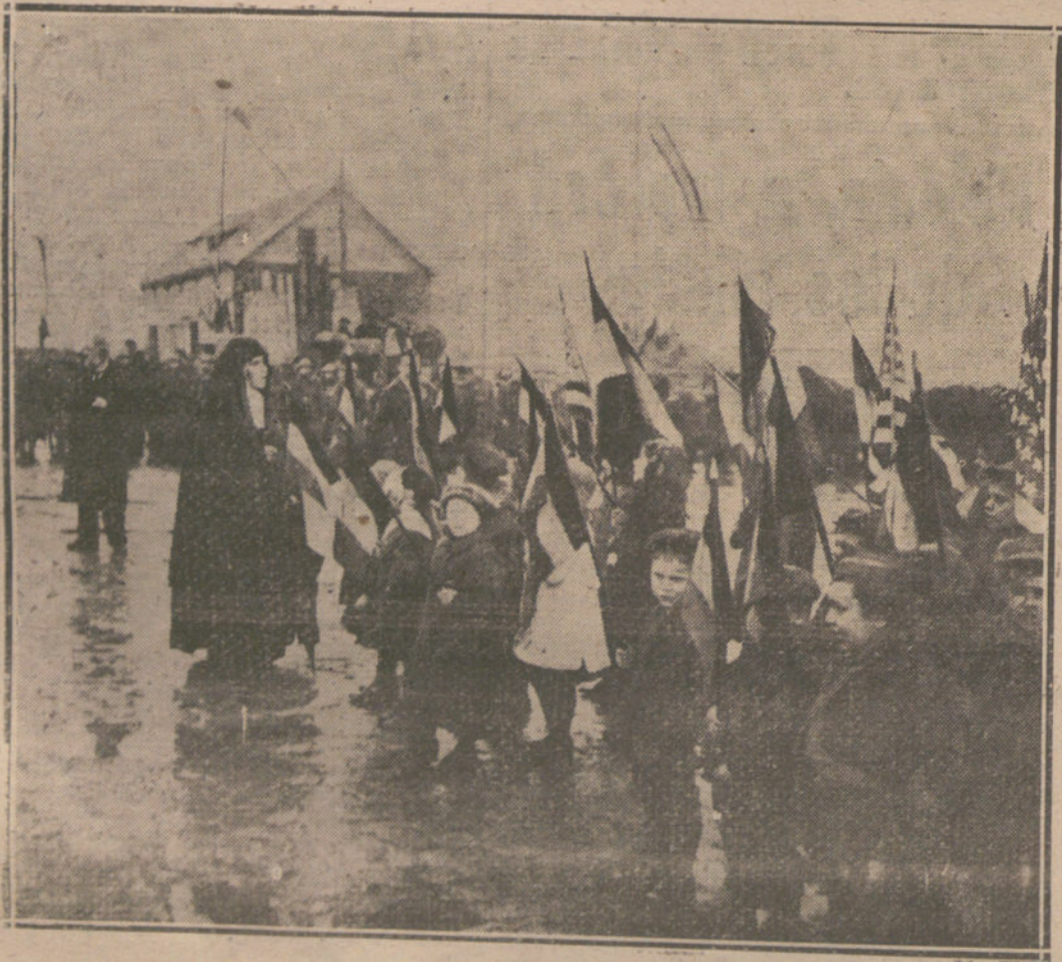
LAS CIUDADES DE LA GUERRA.—NINAS DE LAS ESCUELAS PUBLICAS DE DIXMUDE, DIRIGIDAS POR UNA RELIGIOSA URSULINA, CANTANDO LA MARSELESA A LA LLEGADA DE LAS AUTORIDADES QUE PRESIDIERON EL ACTO DE ENTREGAR LA CRUZ DE LA GUERRA A LA HEROICA CIUDAD.