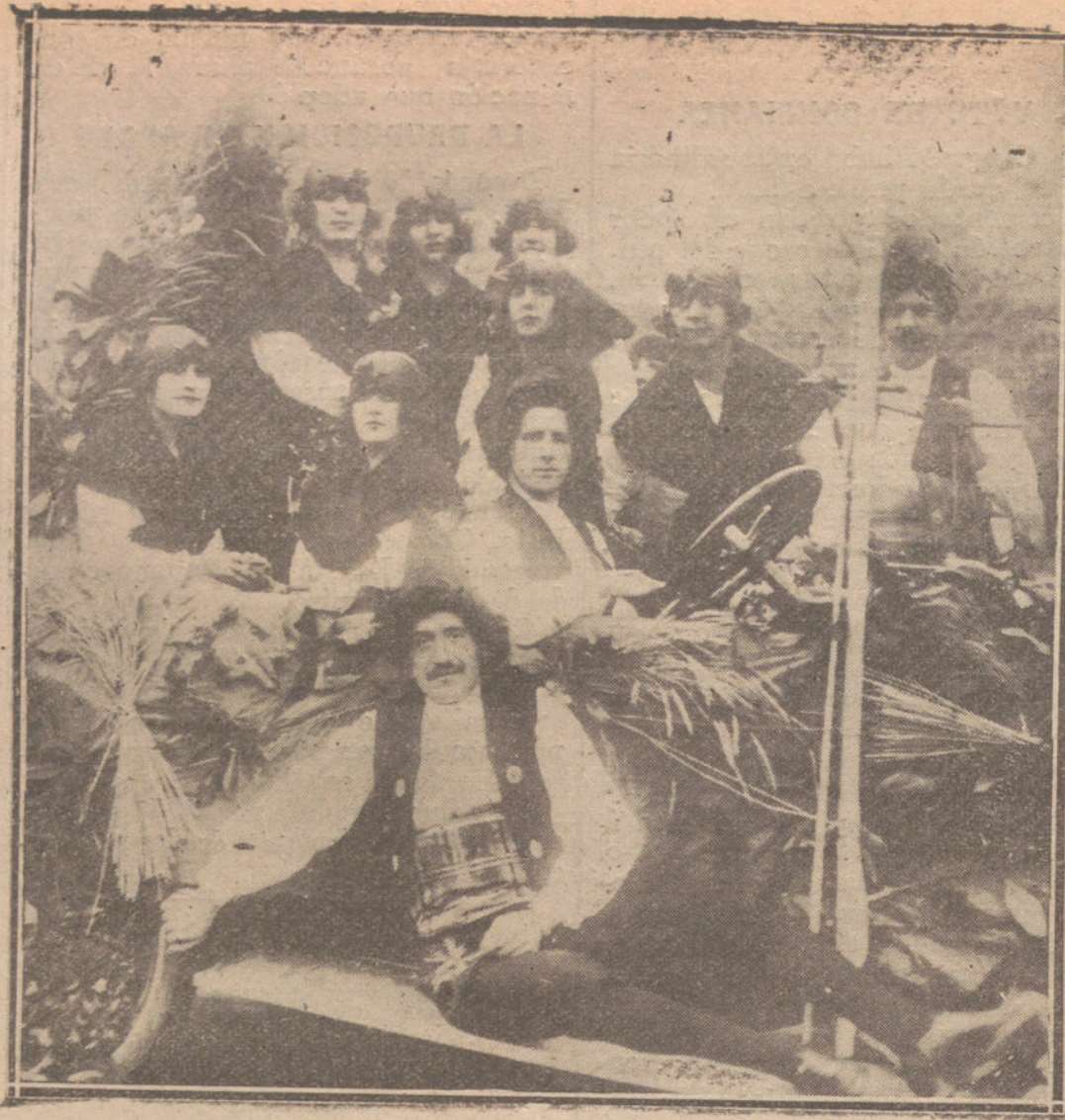
EL CARNAVAL EN MADRID.—COCHE TITULADO «MEU CARINO», QUE GANO EL SEGUNDO PREMIO.

Finalmente, mauristas y cervistas perduran en las mismas relaciones con el mi-