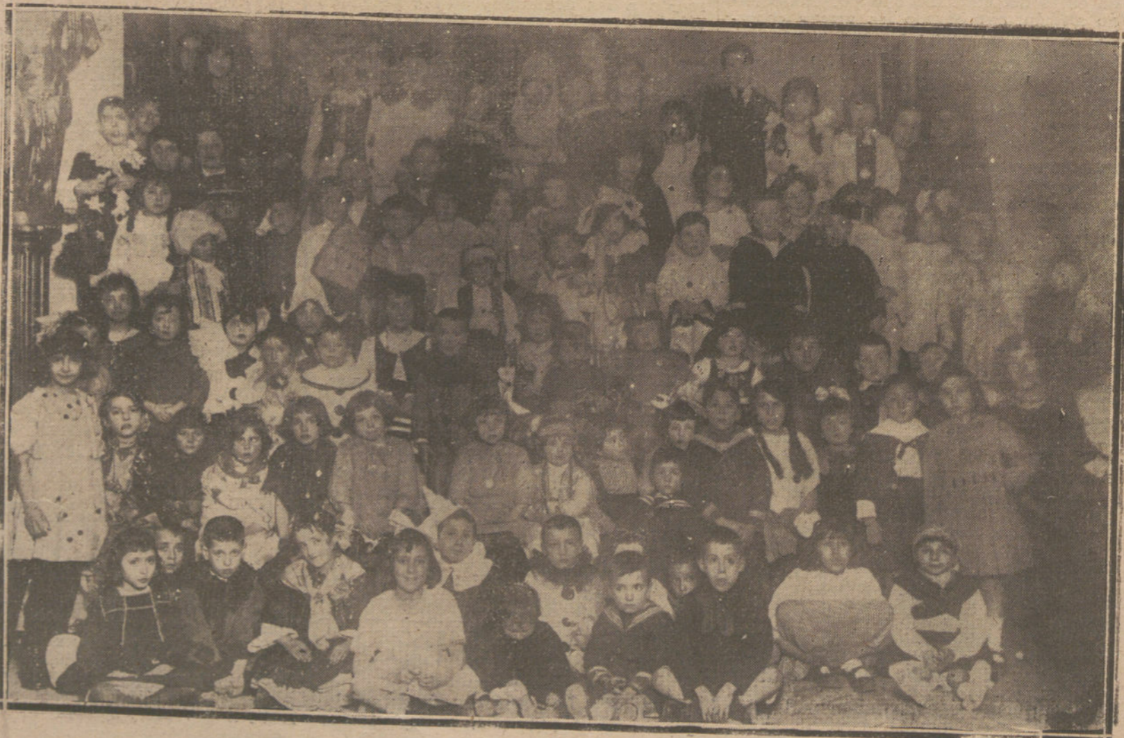
EL CARNAVAL EN MADRID.—UN DETALLE DEL BAILE INFANTIL, CELEBRADO EN EL CENTRO MANCHEGO.