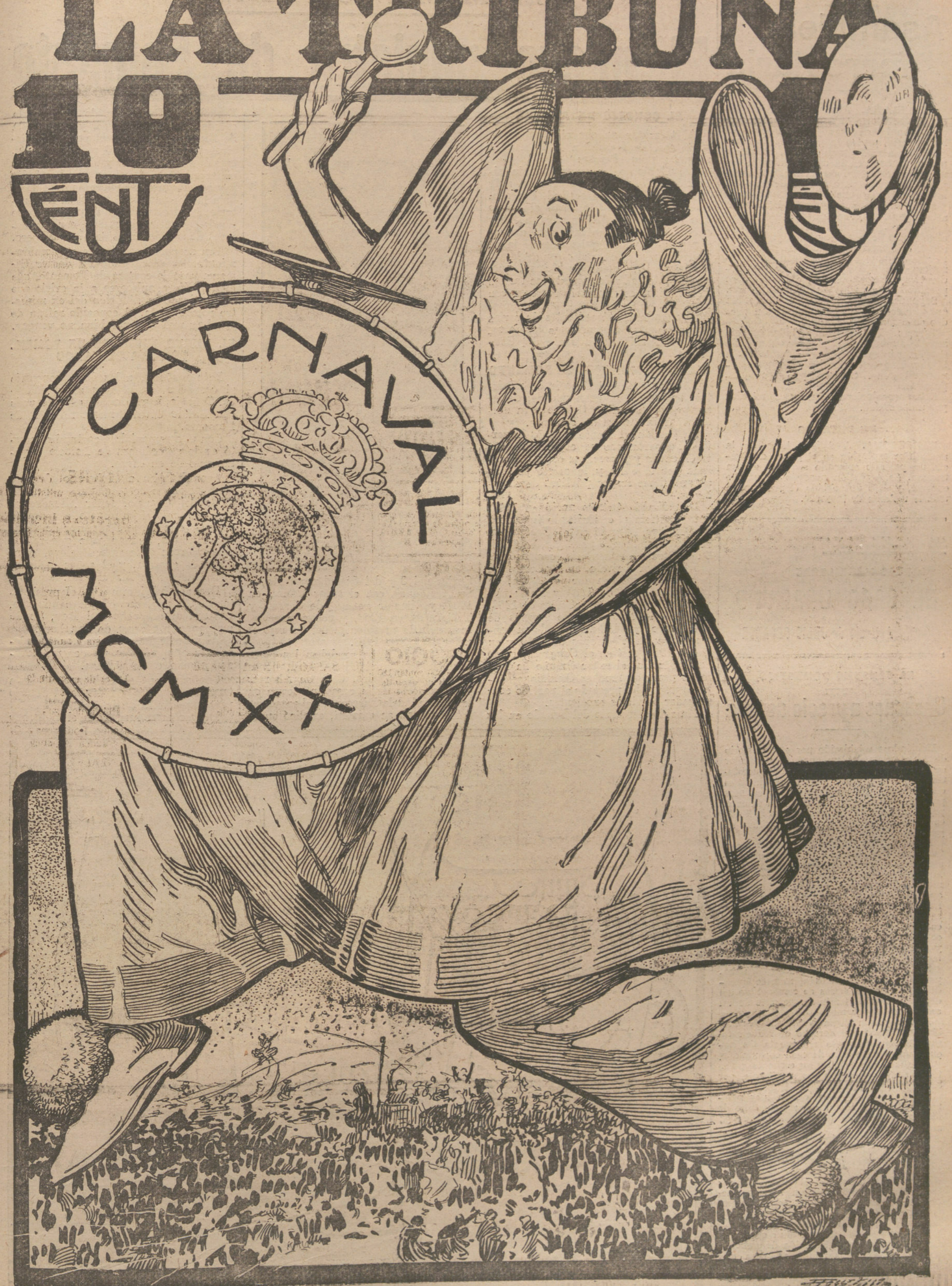
«MARTES DE CARNAVAL». — (ALEGORIA DE AGUSTIN.)