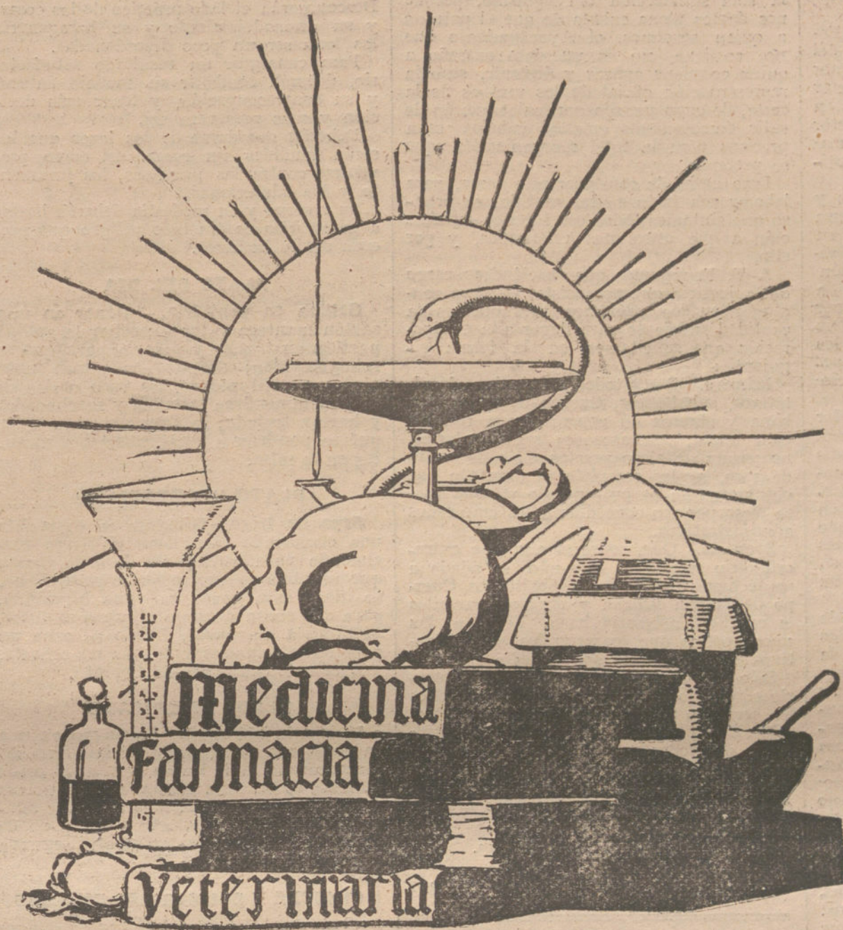
(ALEGORIA DE AGUSTÍN)