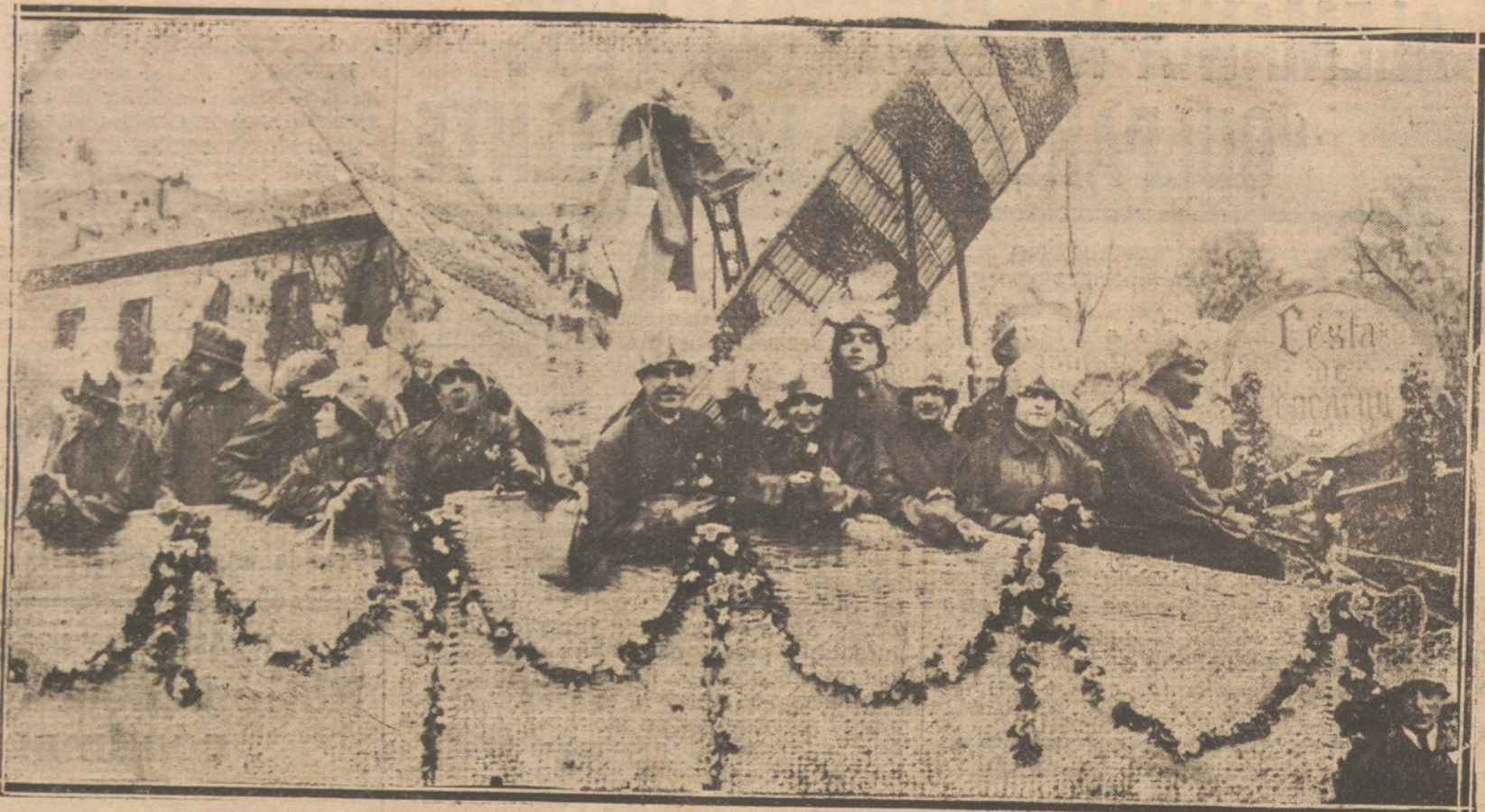
EL CARNAVAL EN MADRID.—CESTA DE ENCARGOS, CARROZA QUE SE HA PRESENTADO AL CONCURSO DE LA CASTELLANA.

Es la primera vez que en Lima se da corrida en día de trabajo.