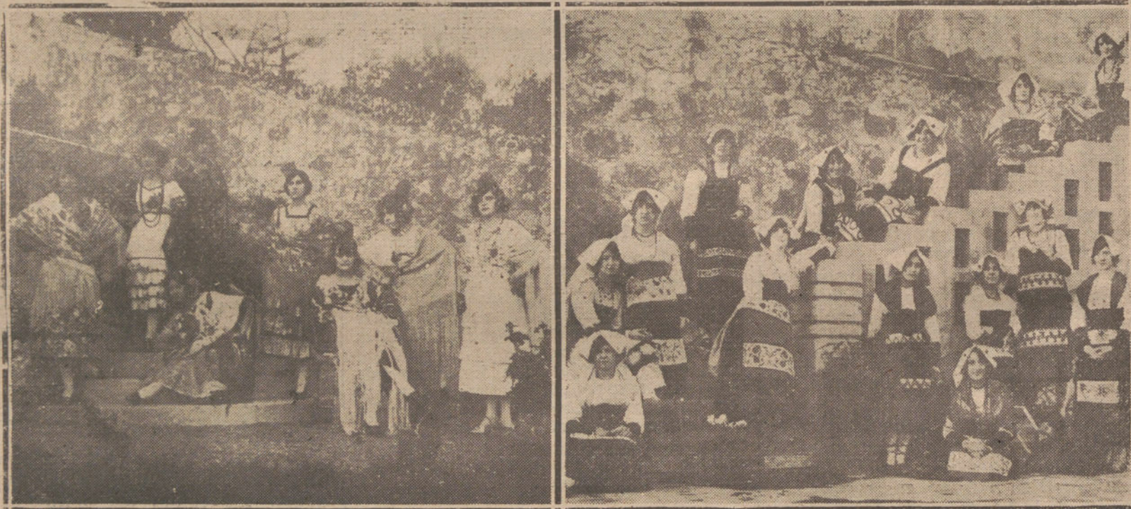
FIESTA BENEFICA EN SANTANDER.—GRUPO DE SEÑORITAS SANTANDERINAS, QUE REPRESENTARON LOS CUADROS ANDALUZ Y NAPOLITANO, EN LA FUNCION A BENEFICIO DE LOS POBRES CELEBRADA CON MOTIVO DE LAS FIESTAS DE CARNAVAL.