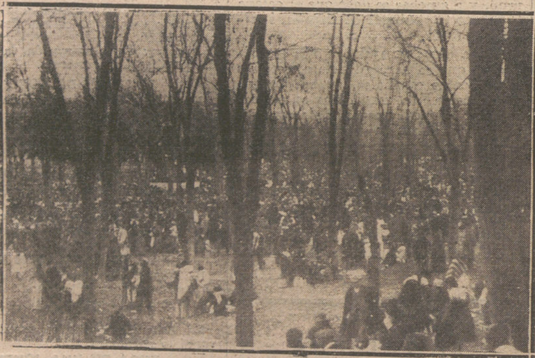
LA PRADERA DEL CORREGIDOR, EL DÍA DEL «ENTIERRO DE LA SARDINA»

No hay niños disfrazados el miércoles. Se han muerto o se han ido al cielo. Si