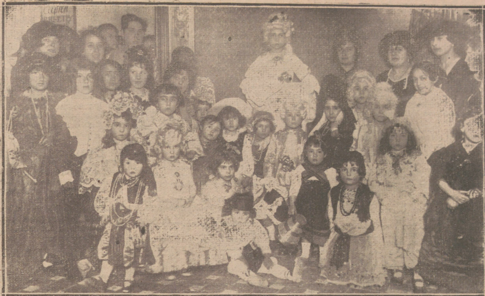
EL CARNAVAL EN MADRID.—ALGUNOS DE LOS DISFRACES QUE MÁS LLAMARON LA ATENCIÓN EN EL BAILE DE NIÑOS, ORGANIZADO AYER POR EL CENTRO DE NIÑOS DE MADRID.