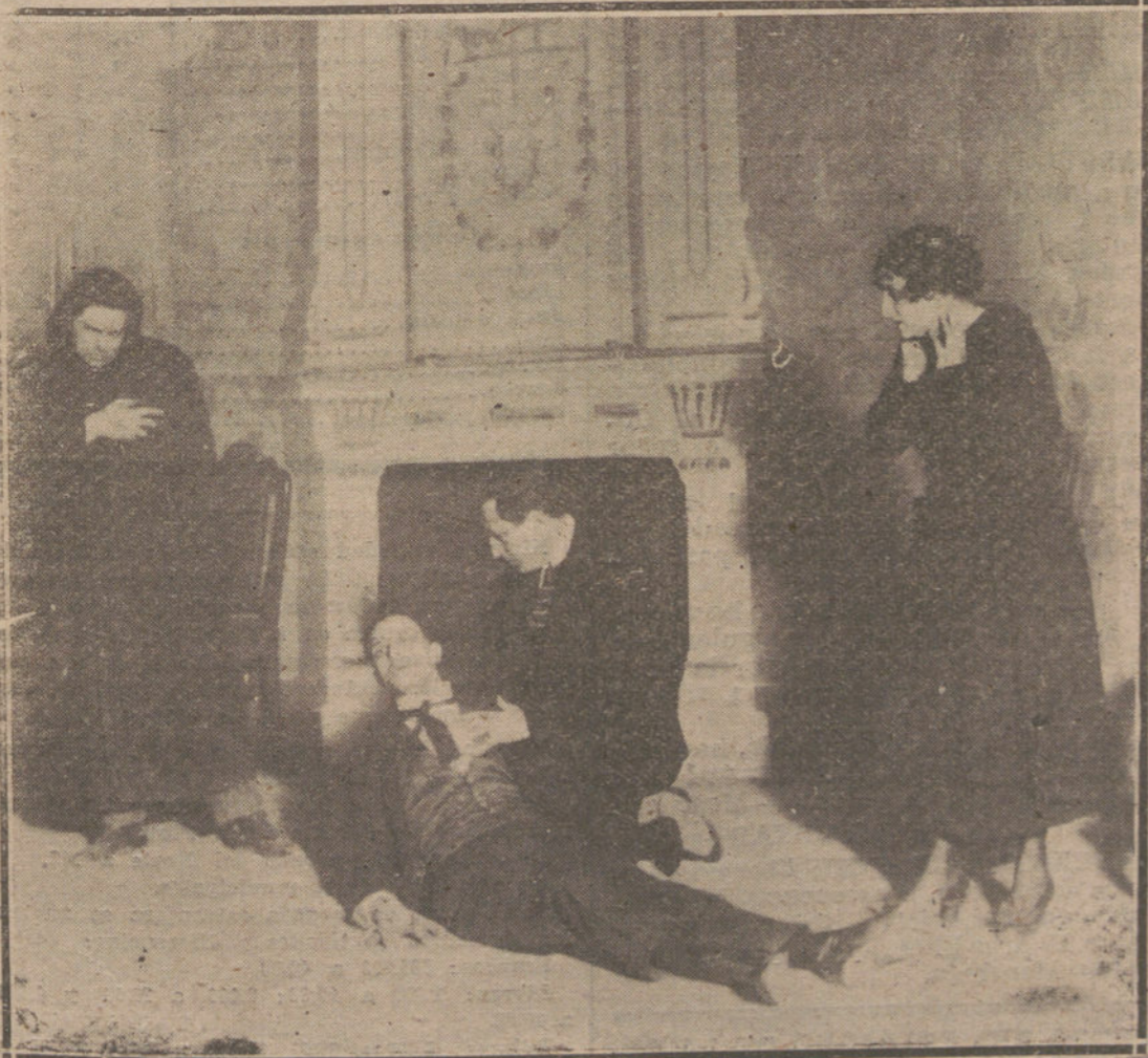
UNA ESCENA DE «UNA VOZ EN LA NOCHE», DRAMA POLICIACO, ESTRENADO EN EL TEATRO DE FUENCARRAL.

Historia los Gobiernos y su formación desde 1916 para hacer patente la actitud que ha tomado el conde de Romanones en la formación de estos Gobiernos, y dice que el conde de Romanones apenas es conocido de la gente, ya que alrededor de él se ha formado una falsa leyenda de intrigas, porque el conde de Romanones