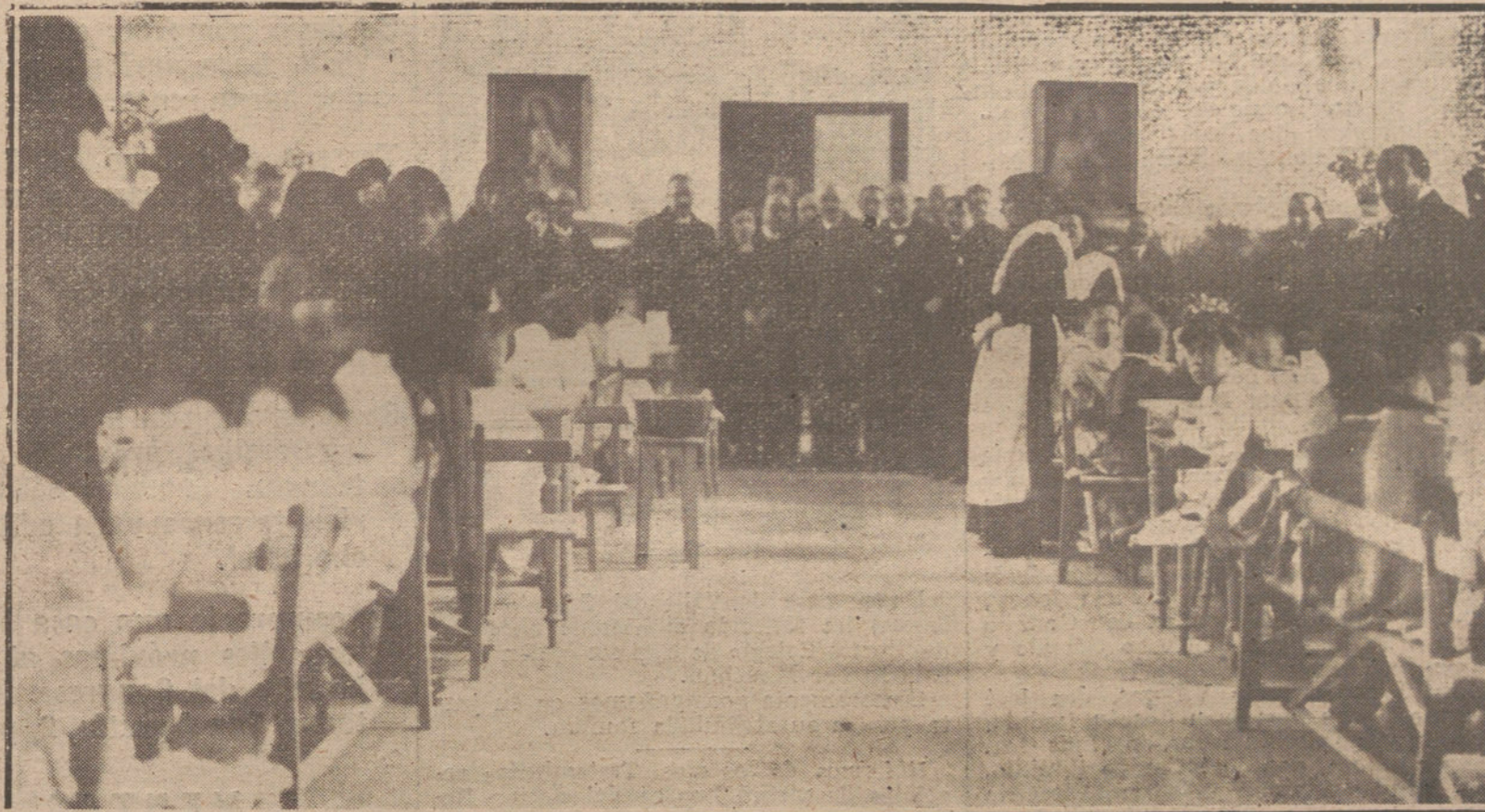
COMIDA EXTRAORDINARIA Y REPARTO DE ROPAS A LOS NIÑOS Y NIÑAS DE LA CANTINA ESCOLAR LOGROÑESA, ACTO AL QUE ASISTIERON LAS AUTORIDADES LOCALES.