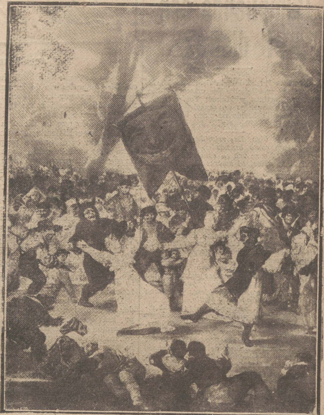
EL ENTIERRO DE LA SARDINA, CUADRO DE GOYA

por enmedio del campo como ratas, y algunas han volado por los aires.