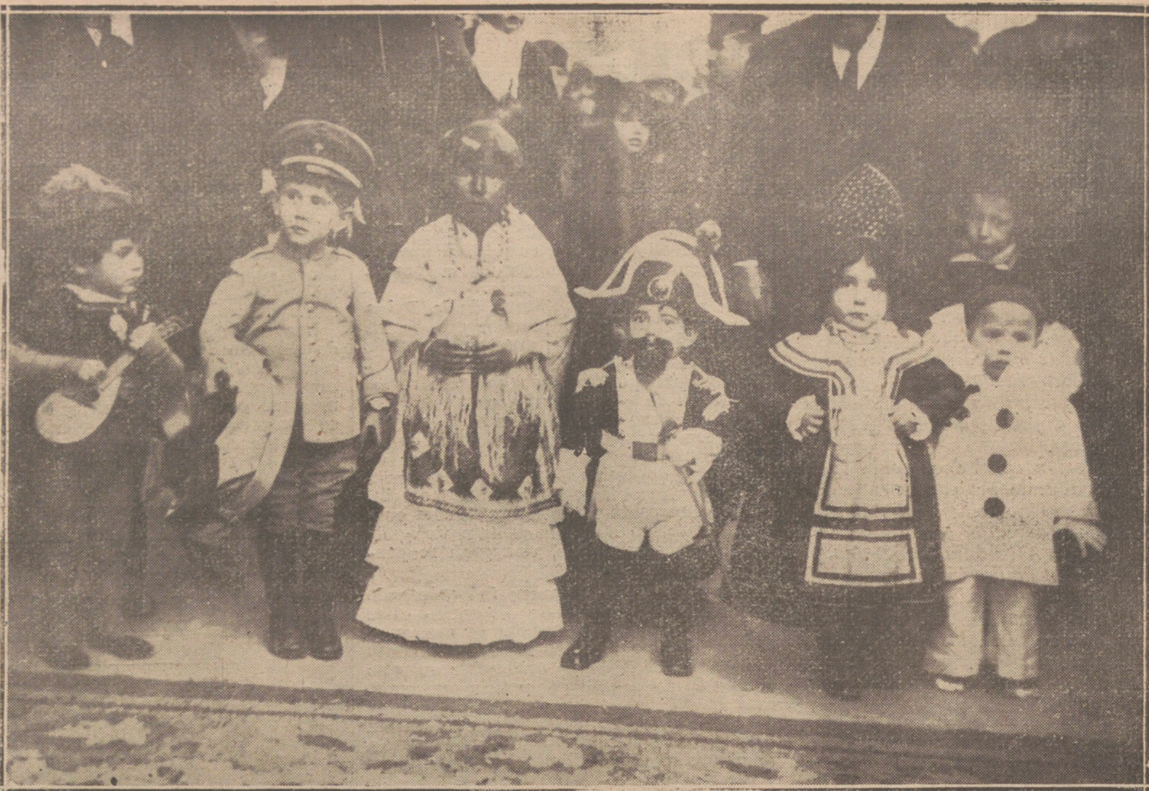
EL CARNAVAL EN BARCELONA.—ALGUNOS DE LOS NIÑOS PREMIADOS EN EL BAILE INFANTIL.

Después de la comida, la cual fué amenizada por la Banda de Ingenieros y la Orquesta Boldi, empezó el baile, al cual asistieron otras distinguidas familias, y resultó, como de costumbre, animadísimo.