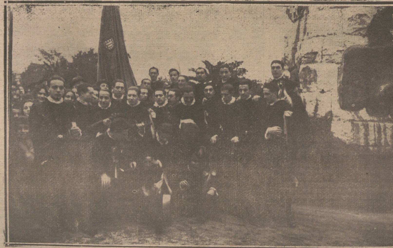
EL CARNAVAL EN SANTANDER.—LA TUNA OVETENSE, EN EL MOMENTO DE DEPOSITAR UNA CORONA AL PIE DE LA ESTATUA DE LA PARED.