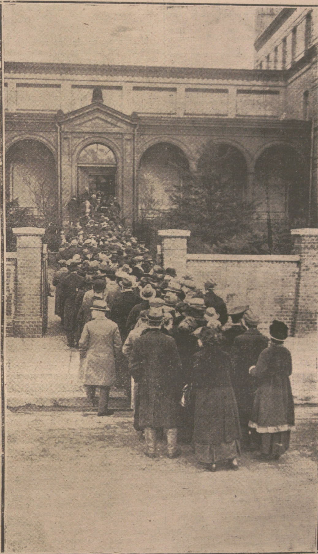
LOS ÚLTIMOS SUCESOS DE BERLIN. GRUPO DE GENTE, ENTRANDO EN EL DEPOSITO JUDICIAL PARA IDENTIFICAR LOS CADAVERES DE LAS VICTIMAS.

Añade que en el teatro «no llegó a triunfar». Si no conociéramos a nuestro Unamuno, sería caso de creer que juzgaba a Galdós, en esta parte, por lo