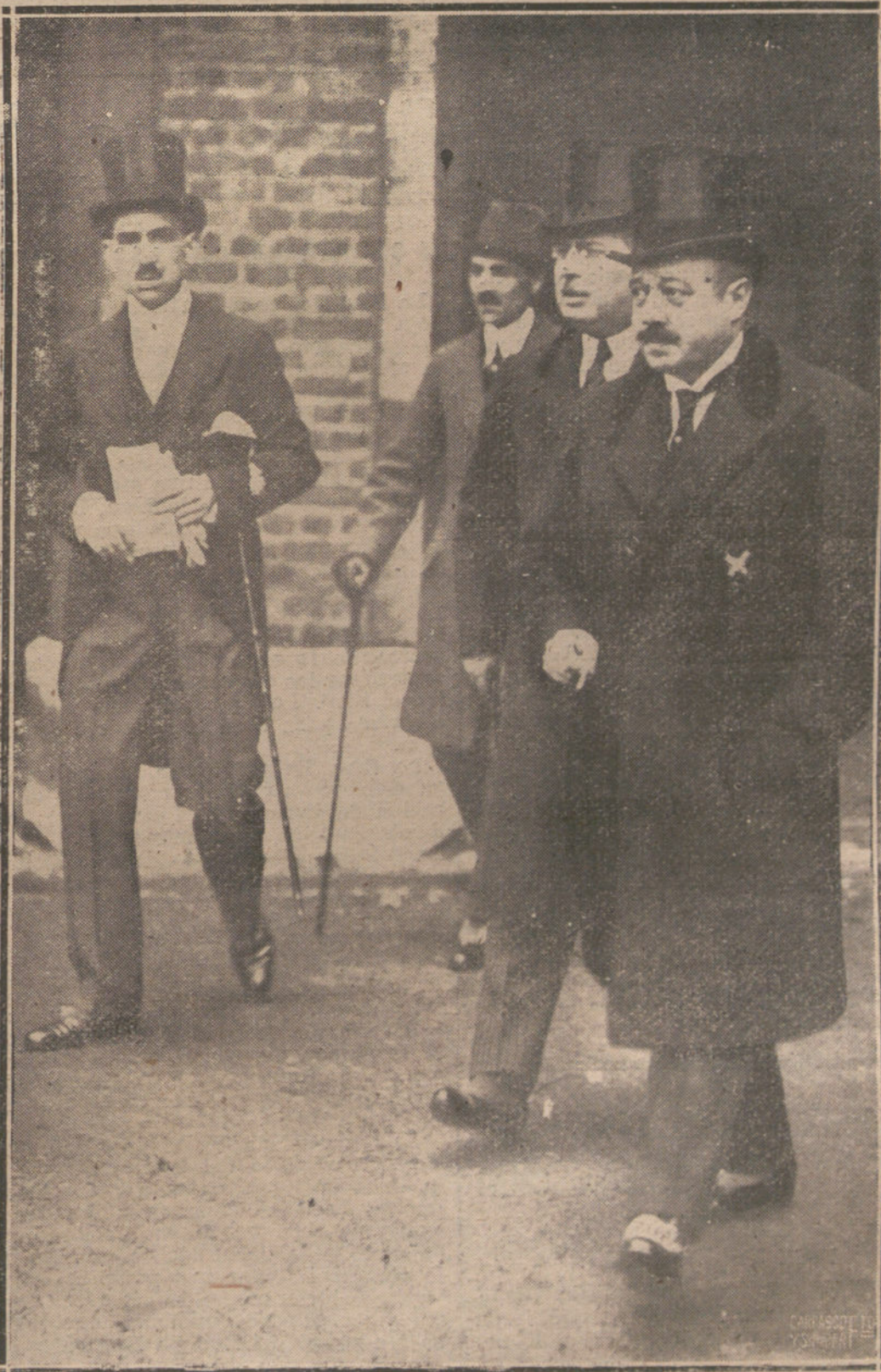
LAS CONFERENCIAS DE LA LIGA DE LAS NACIONES EN LONDRES.—EL REPRESENTANTE DE ESPAÑA, SEÑOR QUIÑONES DE LEÓN, SALIENDO DEL PALACIO, DONDE SE CELEBRAN LAS CONFERENCIAS..

OVIEDO. La Comisión del Sindicato minero presentó al gobernador las bases de mejoras reclamando a la Empresa de Comillas que les abone los salarios mínimos a los picadores que no han sacado el jornal a destajo en los meses de enero y febrero, aumento de precio en cada metro de avance.