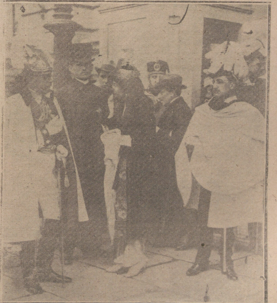
SALIENDO DE LA CAPILLA PUBLICA, CELEBRADA AYER EN PALACIO, CON MÚLTITUDES DE A SOLEMNIDAD DEL DIA

El ministro, después de oír al señor De Miguel las manifestaciones que le hizo relacionadas con las peticiones que se le tenían hechas, que ninguna había sido atendida, y que llegará el momento en que tendrán que cerrar sus establecimientos y chillar en la vía pública, único medio de que sean atendidos, manifestó a la Comisión que, al aceptar el cargo, lo había hecho animado de los mejores deseos; pero que al ponerlos en práctica, se encuentra en contra las influencias puestas en juego de prohombres que dicen representar los intereses que consideran limitados.