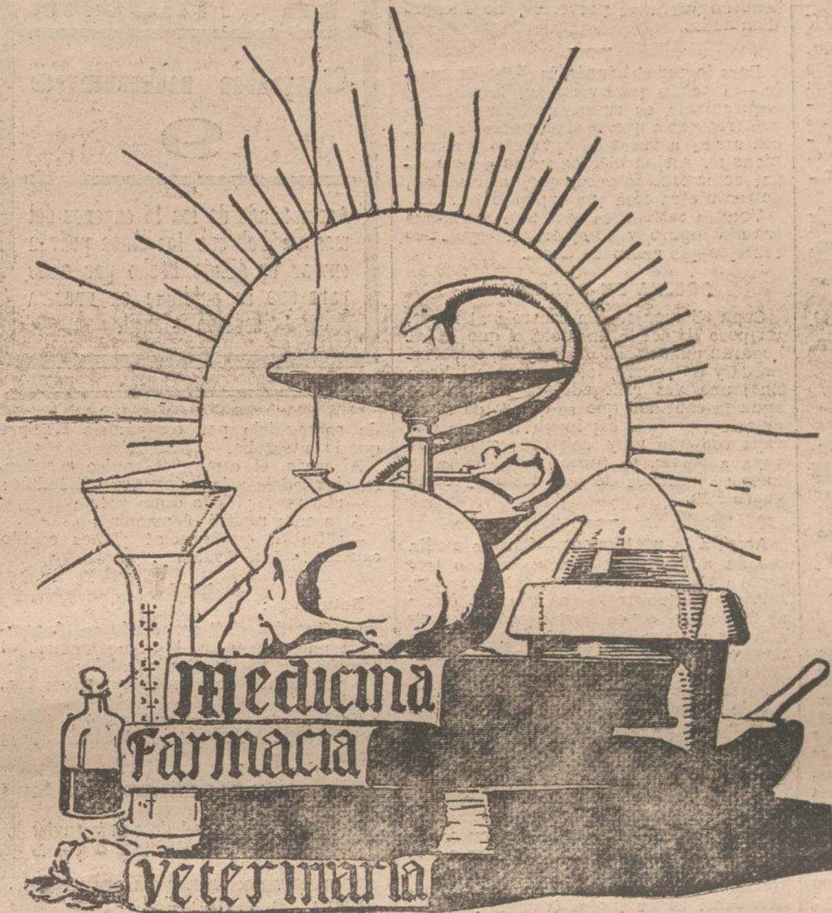
(ALEGORÍA DE AGUSTIN)

En el presente concurso se premiarán cuatro trabajos, con arreglo a las siguientes