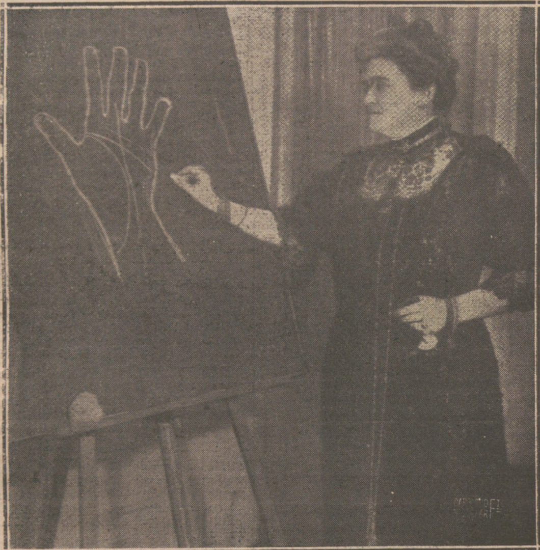
RETRATO DE LA FALLECIDA MADAME DE THEBES, EXPLICANDO SU CIENCIA EN UN TEATRO DE PARÍS.