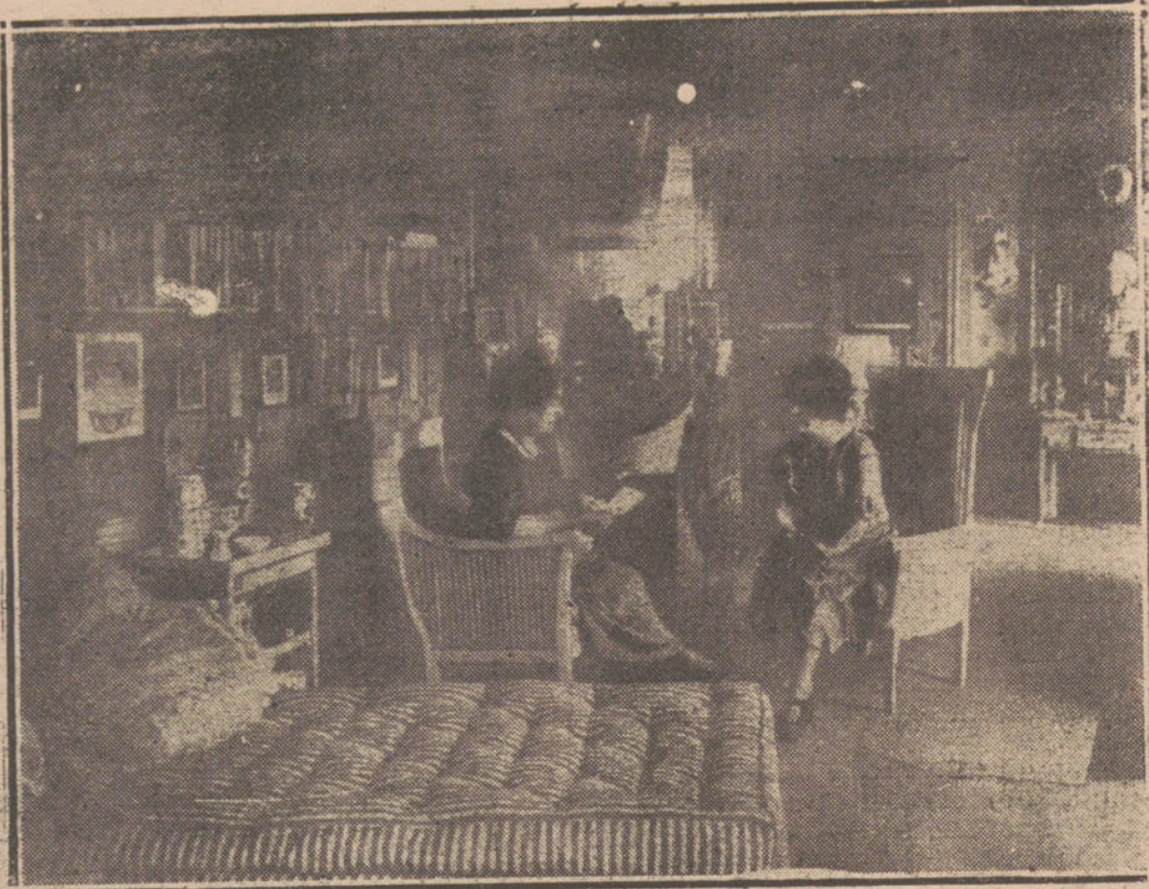
MADAME DE THEBES, EN SU GRAN SALON DE CONSULTAS.

si fuese una comadrona, para que adviniera lo que le va a pasar a alguien, que se siente muy mal... ¡Policlínica espiritual y misteriosa!