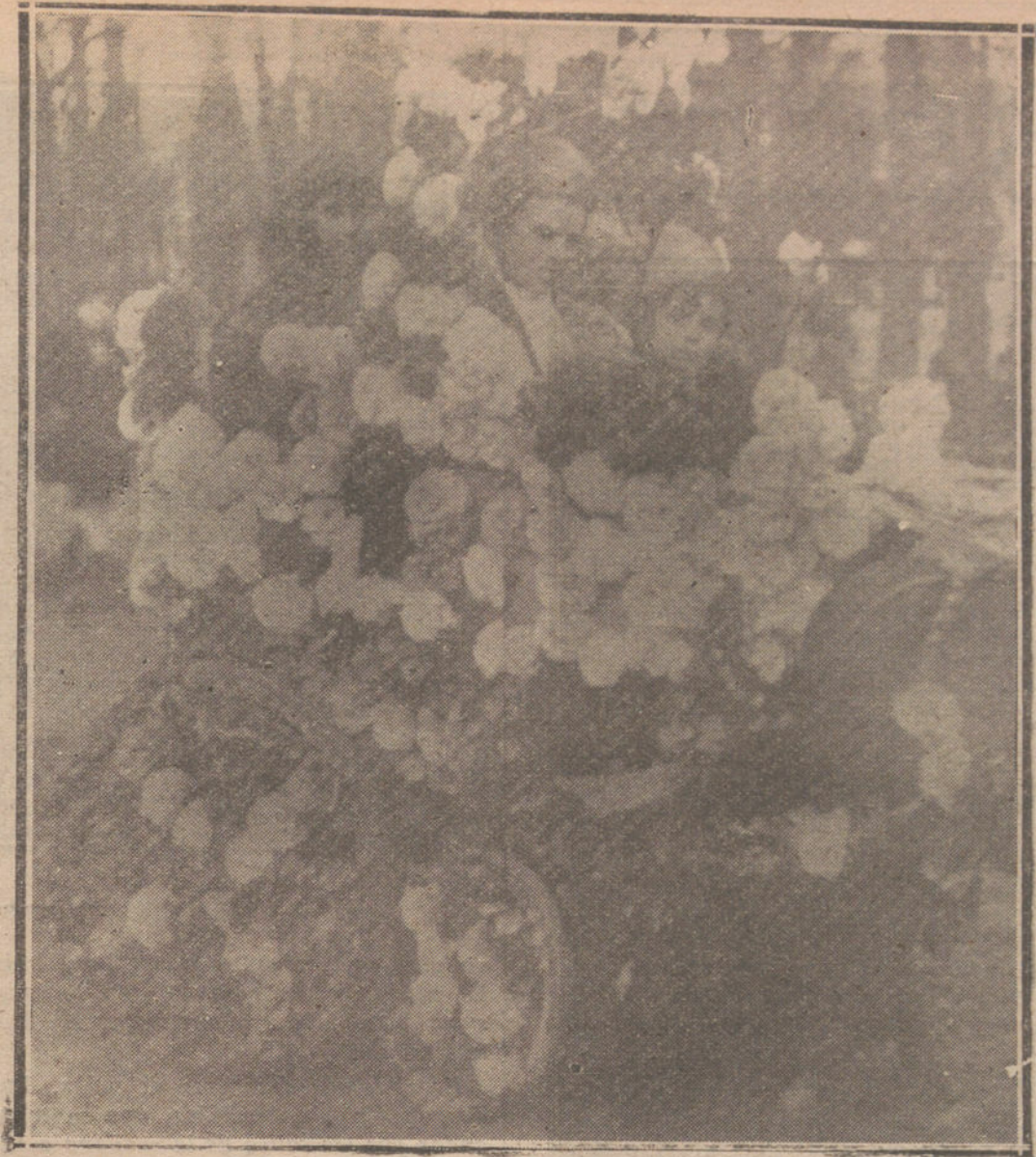
LA COLA DEL CARNAVAL.—COCHE DE NIÑOS QUE SE PRESENTO AYER EN LA PRADERA DEL CORREGIDOR.

Sigue subsistente la Real orden del señor La Cierva dejando sin efecto la del