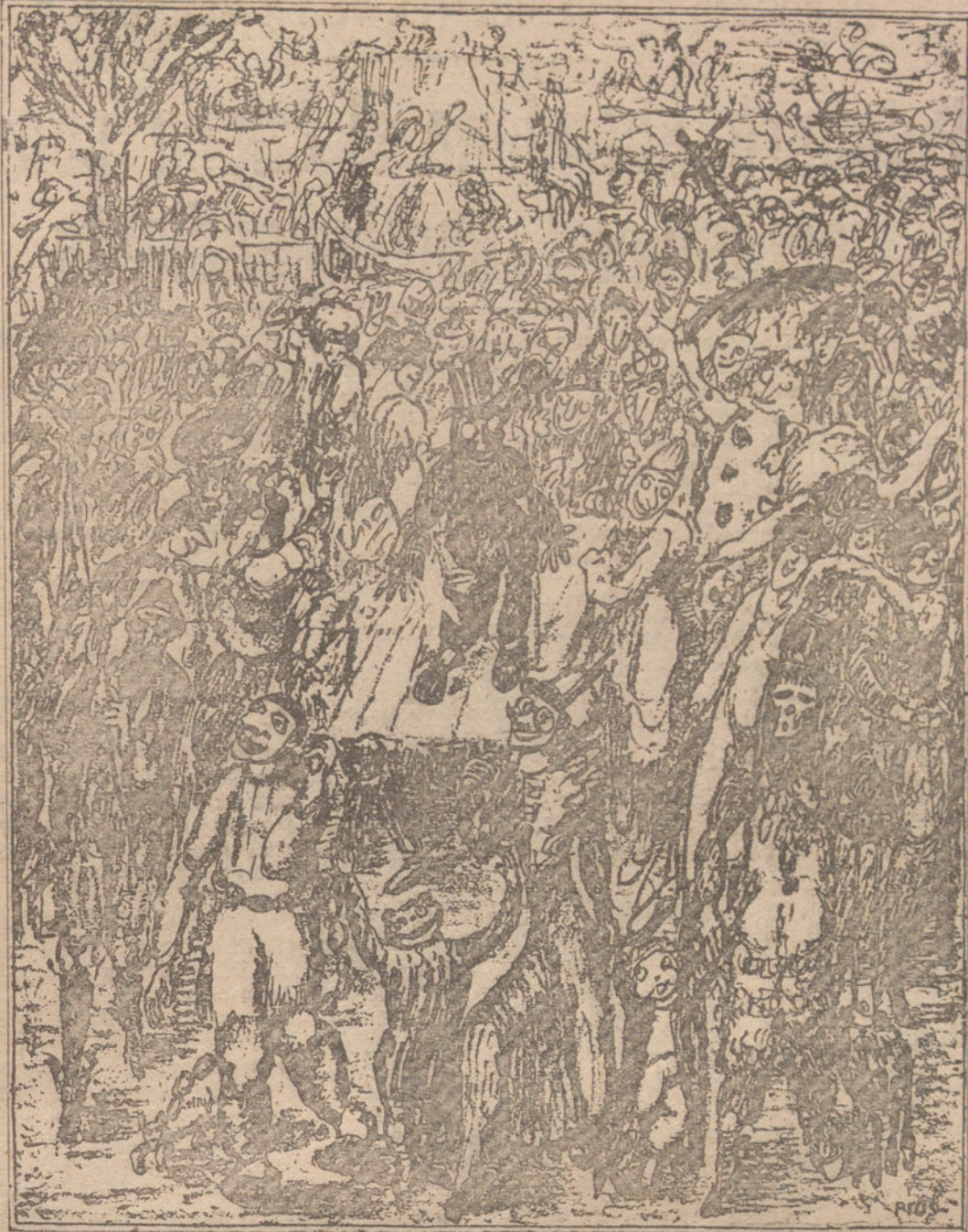
LAS MASCARAS PIDIENDO LA ABOLICION DE LA LIBERTAD

Nitti y Venizelos celebraron por la mañana una extensa entrevista, y discutieron con la mayor cordialidad asuntos que interesan a Italia y a Grecia en el Mediterráneo.—Radio.