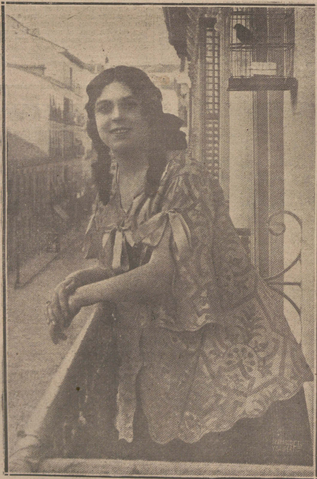
NUESTRA MODERNA MADAME DE THEBES, LA «ADIVINA DE CHAMBERI».

Ya la casa de la nueva pitonisa está llena de gente de a mañana a la noche, y a veces la llaman a la madrugada como