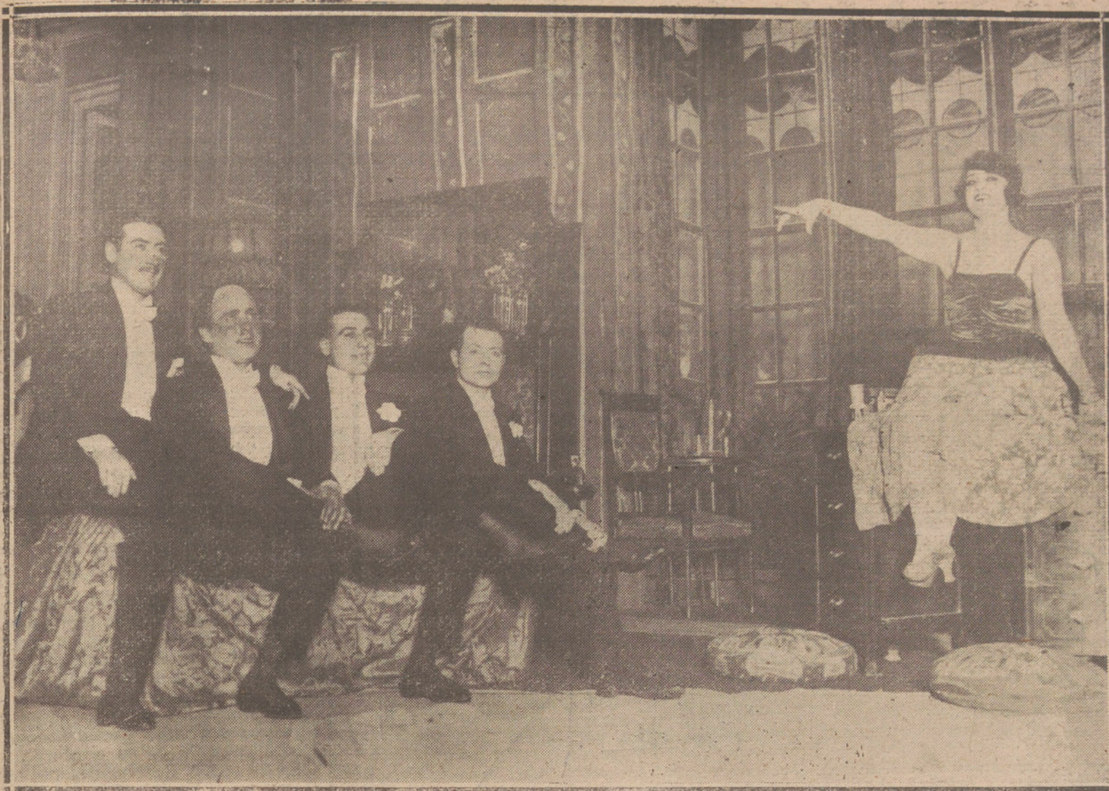
NA ESCENA DE LA OPERETA «UNA AVENTURA EN PARÍS», ESTRENADA CON ÉXITO EN EL TEATRO DEL CENTRO.

Scialoja, ministro italiano de Negocios Extranjeros, y la Delegación de Rumania, presidida por Vaida Voicod, presidente del Consejo rumano.