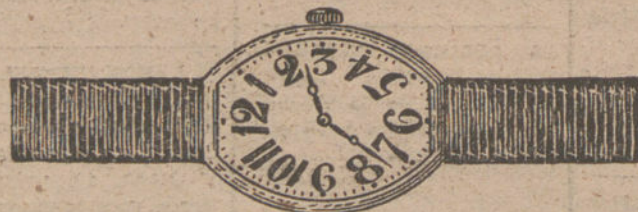
Núm. 3.—«Tonneau», máquina de precisión, oro de ley 18 quilates, con pulsera de moiré. Pesetas 100.