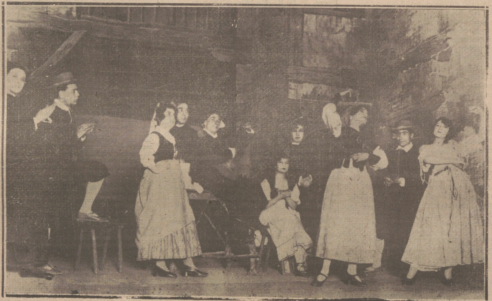
UNA ESCENA DEL SAINETE «LA MESONERA DE PINTO», ESTRENADO CON BUEN ÉXITO