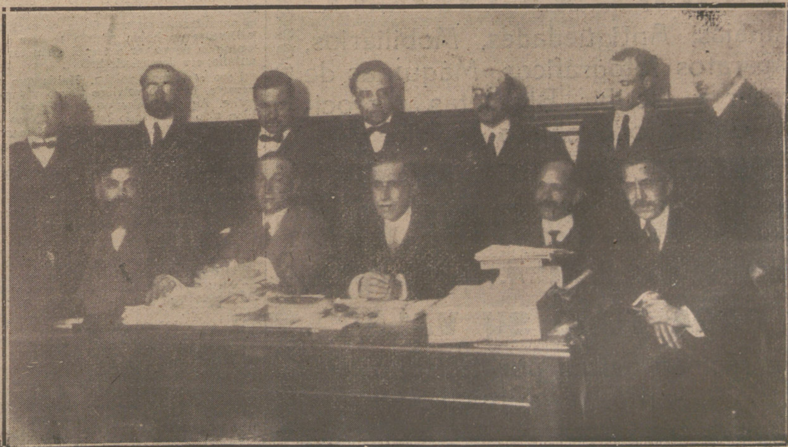
EL COMITE NACIONAL DEL PARTIDO SOCIALISTA, DURANTE UNA DE LAS REUNIONES QUE ESTA CELEBRANDO ACTUALMENTE.

Nos dice nuestro corresponsal en Zaragoza que el representante de la Empresa de aquella plaza regresó ya de Sevilla, y que su programa taurino es el siguiente: Inaugurar con una novillada de Miura; celebrar el 22 y el 23 de mayo dos corridas de toros, la primera con ganado de Albaserrada y la segunda con toros de Murube; los artistas de la primera serán