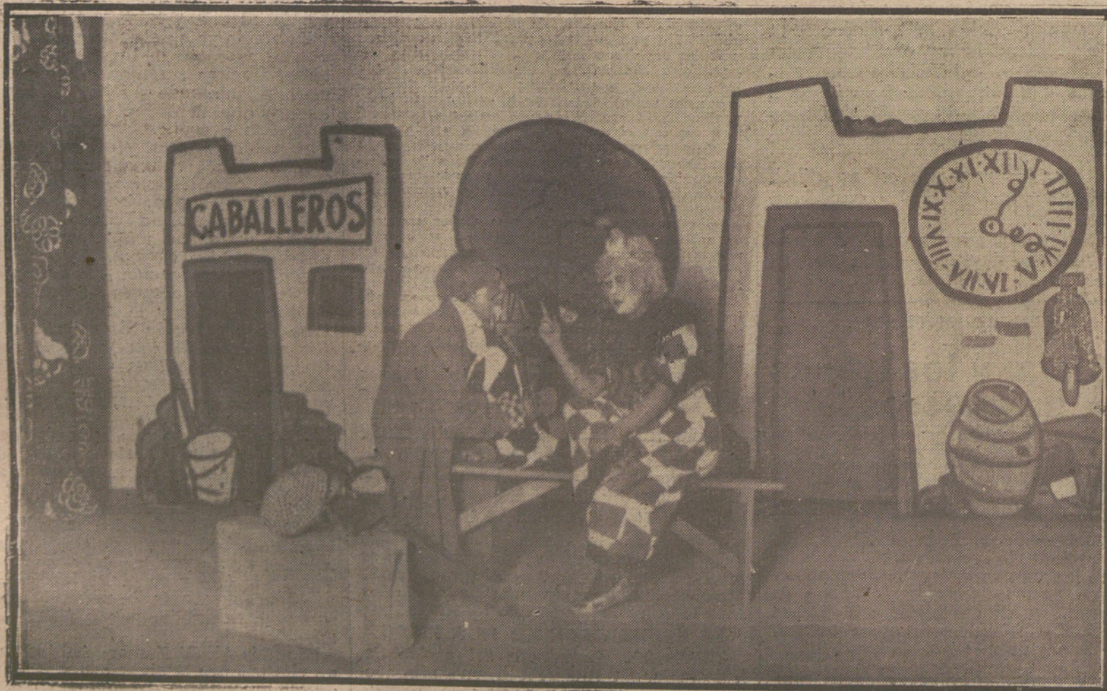
UNO DE LOS NÚMEROS DEL NUEVO ESPECTÁCULO «KURSAAL», QUE SE PRESENTA ESTA NOCHE EN EL TEATRO DE ESLAVA.

pretes, que obligaron a levantar varias veces la cortina, en justo homenaje de aliento para más fructíferas empresas.