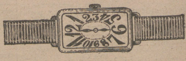
Núm. 6.—Rectangular, áncora de forma, oro de ley 18 quilates, con pulsera de moiré. Pesetas 175.