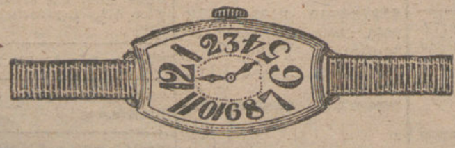
Núm. 5.—«Tonneau» curvado, áncora de forma, oro de ley 18 quilates, con pulsera de moiré. Pesetas 150.