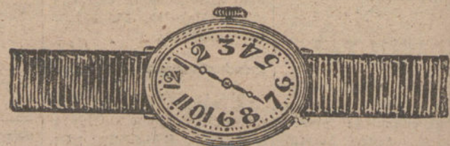
Núm. 4.—Ovalado, áncora 15 rubíes, oro de ley 18 quilates, con pulsera de moiré. Pesetas 125.