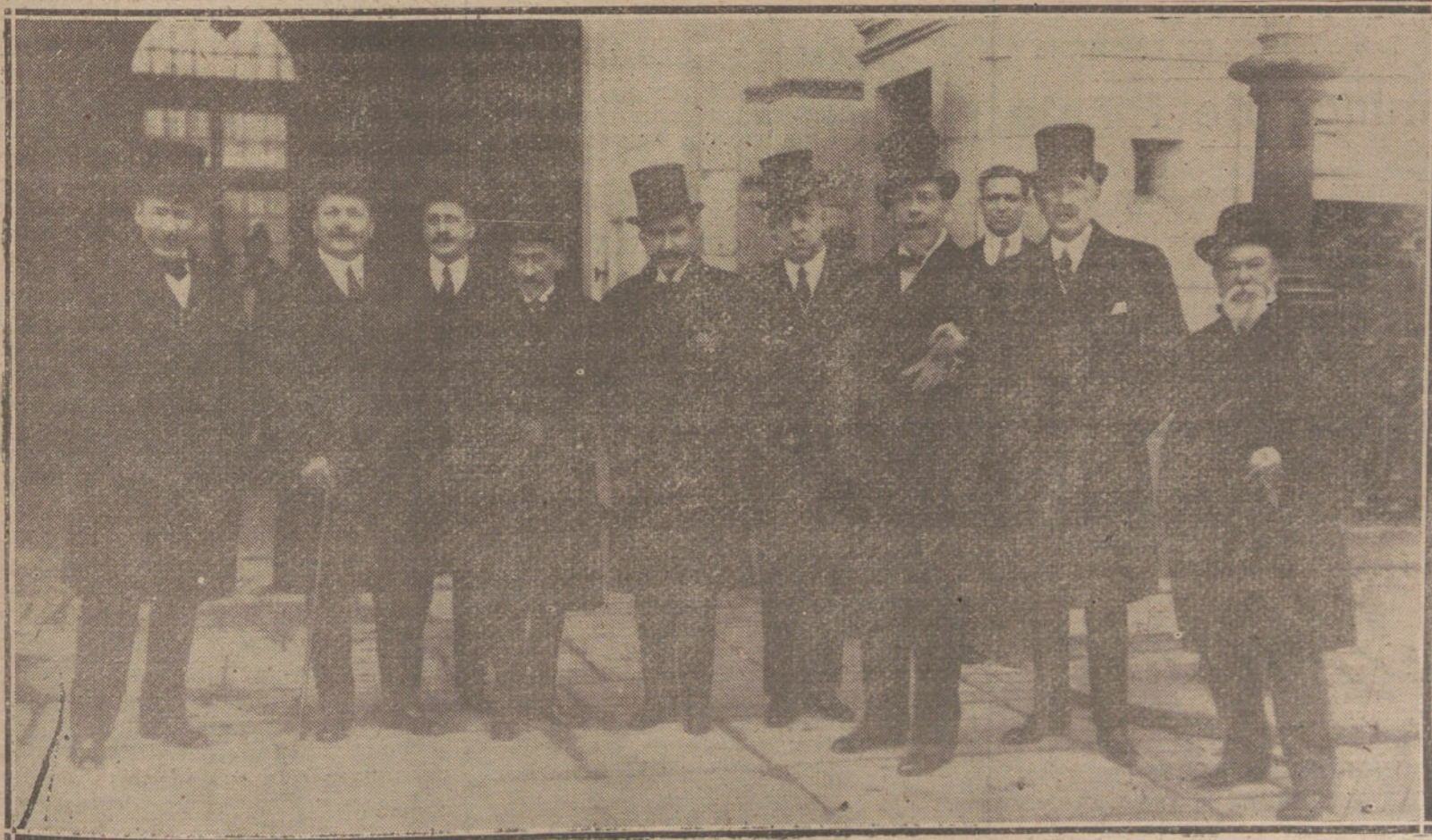
LA COMISION DE AUTORES Y ARTISTAS, QUE HA VISITADO AL REY, PARA INTERESARLE EN LAS PETICIONES QUE TIENEN FORMULADAS ACERCA DEL PROYECTO DE PROPIEDAD INTELECTUAL.

El embajador español en París anunció al ministro de Estado que el día 10 del actual se ha iniciado en el Tribunal de Presas frances el expediente relativo a la captura de mercancías descargadas de los vapores «Nuevo Ampurdanes» y «Amanzora», teniendo los interesados el plazo de dos meses, a partir de aquella fecha, para presentar su reclamación.