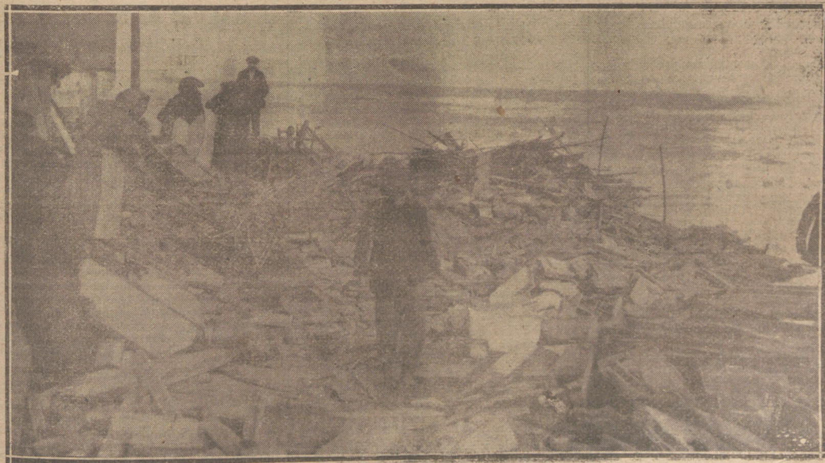
EL TEMPORAL EN BARCELONA.—ESTRAGOS CAUSADOS POR LAS OLAS EN LAS VIVIENDAS DEL BARRIO DE «PEKIN». (FOT. BADOSA.)

Dos años después, casi en vísperas de la guerra, la figura de M. Joseph Cailleaux reapareció bruscamente en plena actualidad, con motivo de uno de esos sucesos que hacen época en la crónica de los grandes escándalos. En realidad, no se trataba de un escándalo, sino de un crimen. Madame Cailleaux había dado muerte a Gastón Calmet, en su despacho de la Dirección de «Le Figaro». En aquellos debates sensacionales que siguieron al crimen y que parecían, más que la vista de un proceso, una admirable crónica, representada en vivo, de un parisinismo refinado, quintaesenciado, fué donde yo adquirí la convicción de que este hombre frío y antipático posee una inteligencia excepcional y una energía formidable. Es, además, de inteligente, flexible y duro como el acero. Ni un instante, durante las largas sesiones del proceso de su mujer, aparece abatido. Razona como un gran