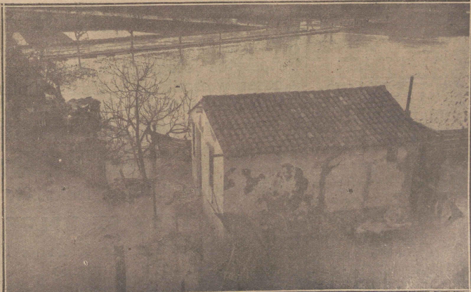
LOS ESTRAGOS DEL TEMPORAL EN VALENCIA.—ASPECTO DE LAS HUERTAS DEL POBLADO DE NAZARET INUNDADAS POR EL DESBORDAMIENTO DEL TURIA.