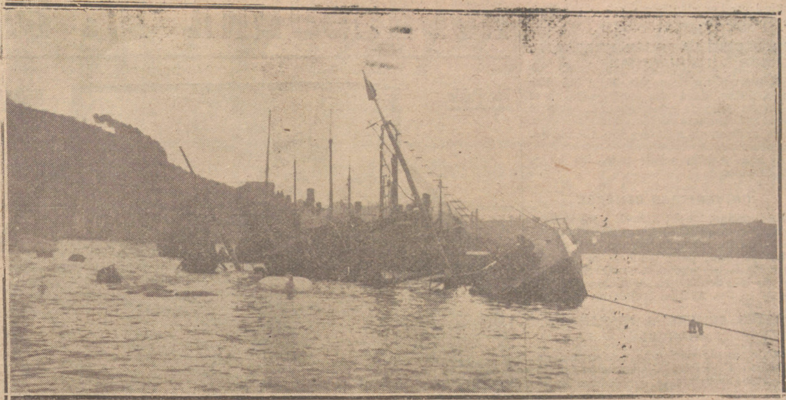
LOS ESTRAGOS DEL TEMPORAL EN SAN SEBASTIAN.—BARCOS HUNDIDOS, A CONSECUENCIA DEL IMPONENTE OLEAJE.

publica diariamente una SECCION DE ALQUILERES, donde se anuncian las peticiones y demandas de viviendas.