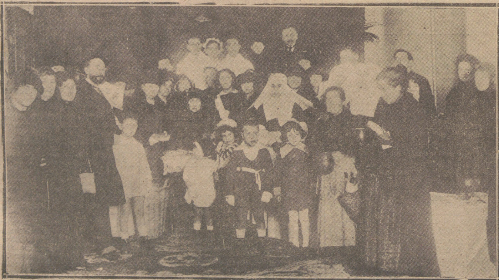
REPARTO DE COMIDAS, VERIFICADO AYER, CON ASISTENCIA DE SU MAJESTAD LA REINA VICTORIA EN EL ASO DE CIEGOS DEL PA. CÍFICO.