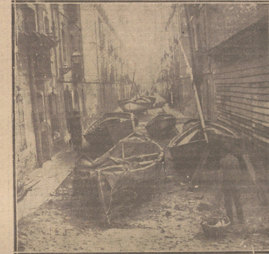
ESTRAGOS DEL TEMPORAL EN BARCELONA.—ASPECTO DE UNA CALLE DE LA BARCELONETA DONDE SE REFUGIARON LAS BARCAS DE LOS PESCADORES, DURANTE EL IMPONENTE TEMPORAL.

El hombre público que acaba de comparecer para ser juzgado ante el Senado francés, trató a España, más que con desdén, con brutalidad en aquellos difíciles días en que nos vimos envueltos por un acto de energía de Canalejas (el desembarco en Larache y la marcha sobre Alcazarquivir), en los grandes peligros de aquel grave suceso internacional que M. Tardieu ha llamado, sirviéndole de título para un libro, «Los misterios de Agadir». España quedó como al margen del suceso. No tuvimos verdadero papel en el drama internacional