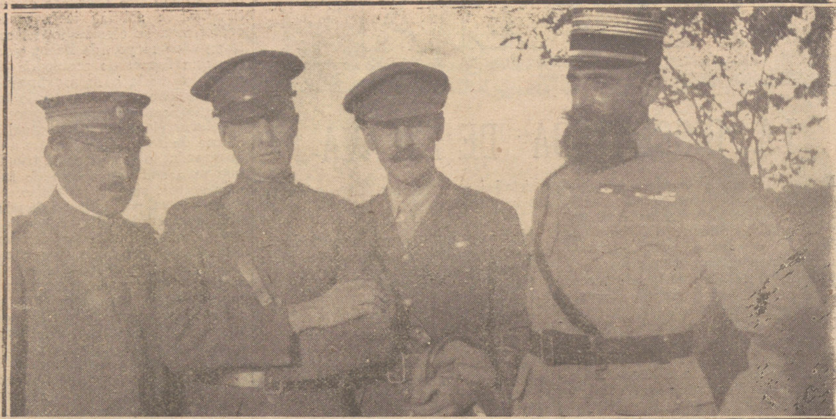
LOS REPRESENTANTES MEDICOS DE LOS EJERCITOS ITALIANO, NORTEAMERICANO INGLES Y FRANCES, QUE, ENVIADOS POR LA TROPICA LIGA DE LAS SOCIEDADES DE LA CRUZ ROJA, HAN ESTADO EN POLONIA, ESTUDIANDO LA EPIDEMIA TIFICA.

Por otra parte, el Gobierno de Moscú ha contratado en Estocolmo a 4.000 obreros metalúrgicos, que estaban en huelga, con el sueldo de 4.000 coronas anuales,