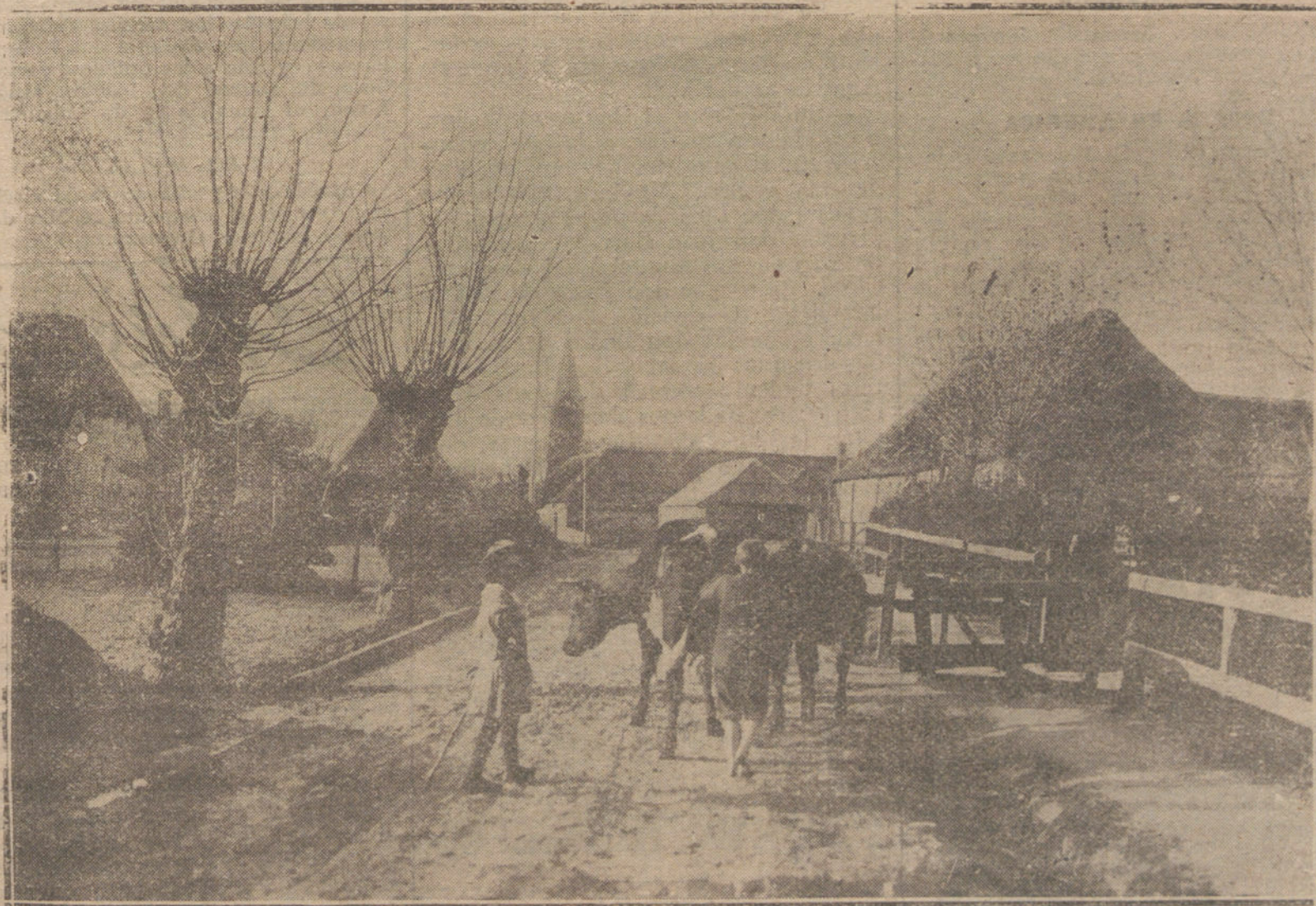
LA RECTIFICACION DEL MAPA DE EUROPA.—UN PAISAJE DE LA REGION DE HOLSTAIM, CUYA NACIONALIDAD DEFINITIVA HA SIDO SOMETIDA, DESPUES DEL TRATADO DE VERSALLES, A UN PLEBISCITO PUBLICO.

española sea, ni siquiera los nombres de las cosas.