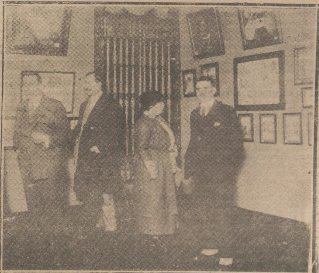
UN DETALLE DE LA NOTABLE EXPOSICION DE CUADROS DEL PINTOR ANGEL COUSILLAN

NUMERO DEL TELEFONO DE LA ADMINISTRACION DE «LA TRIBUNA» PLAZA DE CANALEJAS, 6, 25-5