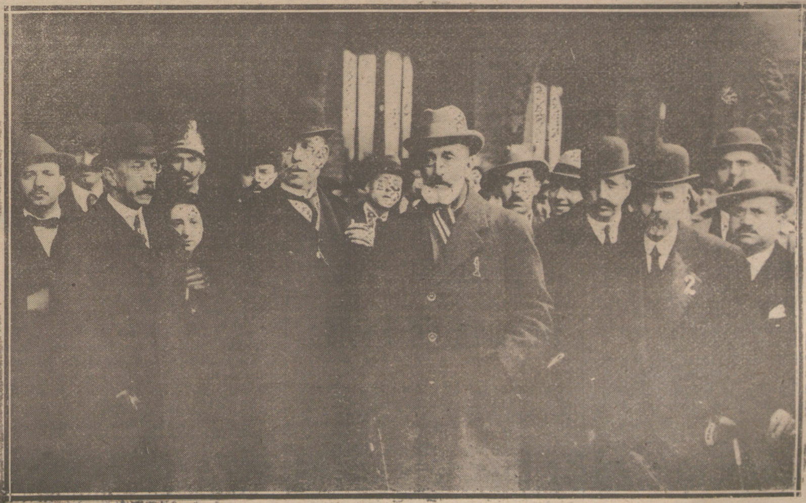
LLEGADA A MADRID ESTA MAÑANA DEL EX CAPITAN GENERAL DE CATALUNA SEÑOR MILANS DEL BOSCH (1), AL QUE HAN RECIBIDO, ENTRE OTRAS PERSONALIDADES, EL GOBERNADOR CIVIL DE BARCELONA, SEÑOR MAESTRE.