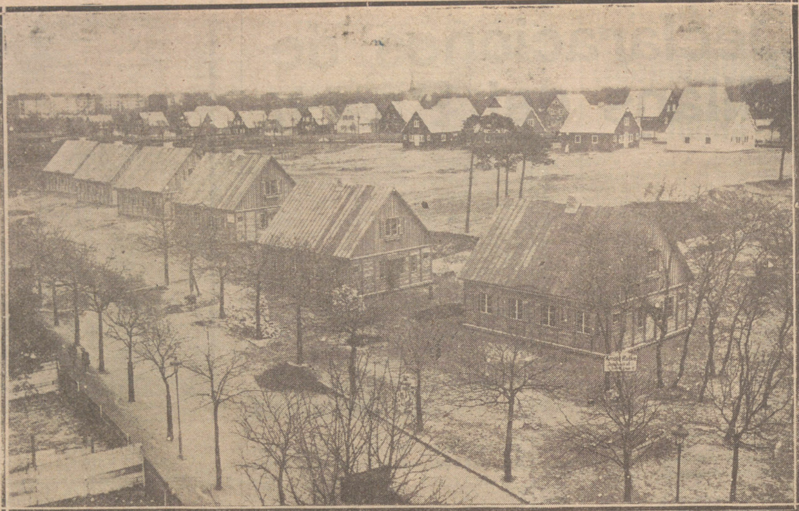
LA ESCASEZ DE VIVIENDAS EN ALEMANIA.—CASAS DE MADERA, CONSTRUIDAS EN POCAS HORAS, EN STEGLITZ, CERCA DE BERLIN, POR INICIATIVA DE AQUEL MUNICIPIO.

En Lara se estrenará en la semana próxima la comedia inglesa «Wu-Li-Chang», creación de Ernesto Vilches, y que llamará poderosamente la atención por su presentación excepcional y su vivo interés.