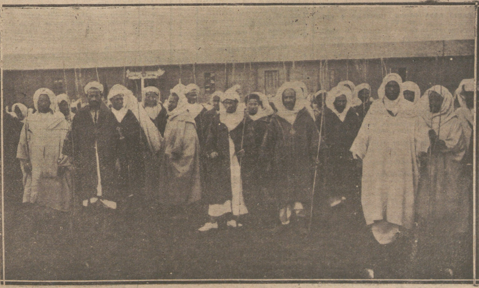
NUESTRA ACCION EN AFRICA.—MOROS DE LAS KABILAS DE MARISSA, DISPONIENDOSE A PLANTAR ARBOLES, DURANTE LA FIESTA CELEBRADA EN EL POBLADO DE NADOR.

NUMERO DEL TELEFONO DE LA ADMINISTRACION DE «LA TRIBUNA», PLAZA DE CAÑALEJAS, 6, 25-51