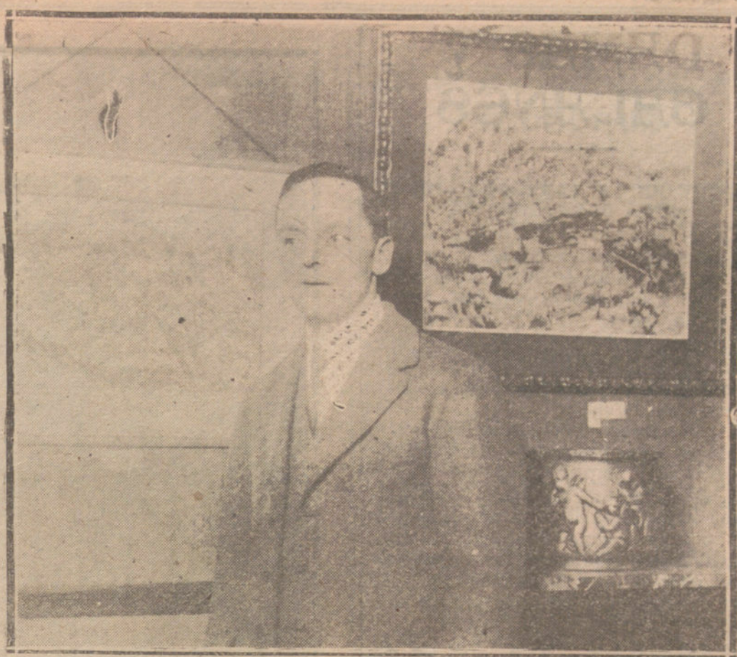
EL DISTINGUIDO ARTISTA ALEMAN HANS POPPELREUTER, QUE ACTUALMENTE CELEBRA UNA INTERESANTE EXPOSICION EN EL SALON ARTE MODERNO.

Una Comisión de harineros ha interesado en el día de hoy, en una visita que