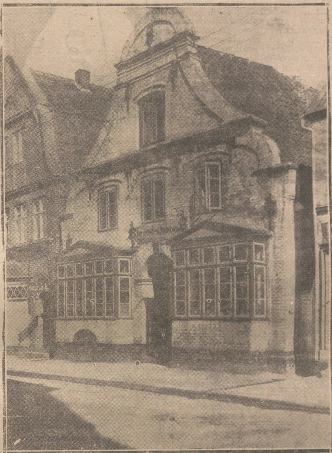
LA RECTIFICACION DEL MAPA DE EUROPA.—LA REGION DE HOLSTAIM, CUYA NACIONALIDAD DEFINITIVA HA SIDO SOMETIDA, DESPUES DEL TRATADO DE VERSALLES, A UN PLEBISCITO PUBLICO, QUE SE ESTA CELEBRANDO ACTUALMENTE. LA VIEJA FONDA, UNA DE LAS CONSTRUCCIONES MAS TIPICAS.

Digo inoportunidad, porque la fiesta habría de hacerse este abril, que ya nos pisa los talones. ¿Qué fiesta o qué marrachada se haría de aquí a dos meses o mes y medio? Aunque políticos y gobernantes no pensasen en otra cosa más que en la deuda que con Cervantes contrajeron con el decreto de antaño y su devoción con el héroe de Lepanto fuera tan honda que con su recuerdo se desayunasen y con él se fuesen a dormir, no había tiempo para preparar nada digno de tal ingenio. Pero de lo que menos se acuerdan gobernantes y políticos es de tales cosas. Ni siquiera se acuerdan ya de cosas de política. Todo es ahora personal: las ideas han caído en desuso. Personales son y nombres personales llevan los partidillos en que los grandes partidos se desmembraron. Celadas y zancadillas para echar del Poder al que ayer lo consiguió, con la triste esperanza de dejarlo mañana: tal es la historieta política, que no llega a historia, de estos últimos años. Hemos perdido ya la cuenta de los Ministerios que en dos años hemos tenido. Ya el título de ex presidente del Consejo es tan ordinario, que casi suena más el de ministro de Abastecimientos. Y cuidado que han andado mal los tales ministros y sus abastos, o «subsistencias», como ahora han dado en llamarlos para que no quede en España cosa que