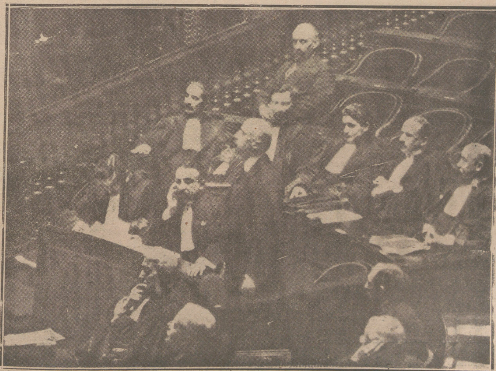
EL PROCESO CAILLAUX.—EL EX MINISTRO FRANCÉS, DECLARANDO ANTE EL TRIBUNAL QUE LE JUZGA, EN EL PALACIO DE LUXEMBURGO. (FOT. ILLUSTRATION.)

La familia de un fraterno amigo mío, al que salvé la vida una noche de combate en un campamento africano, invítome a pasar una temporada en Barcelona,