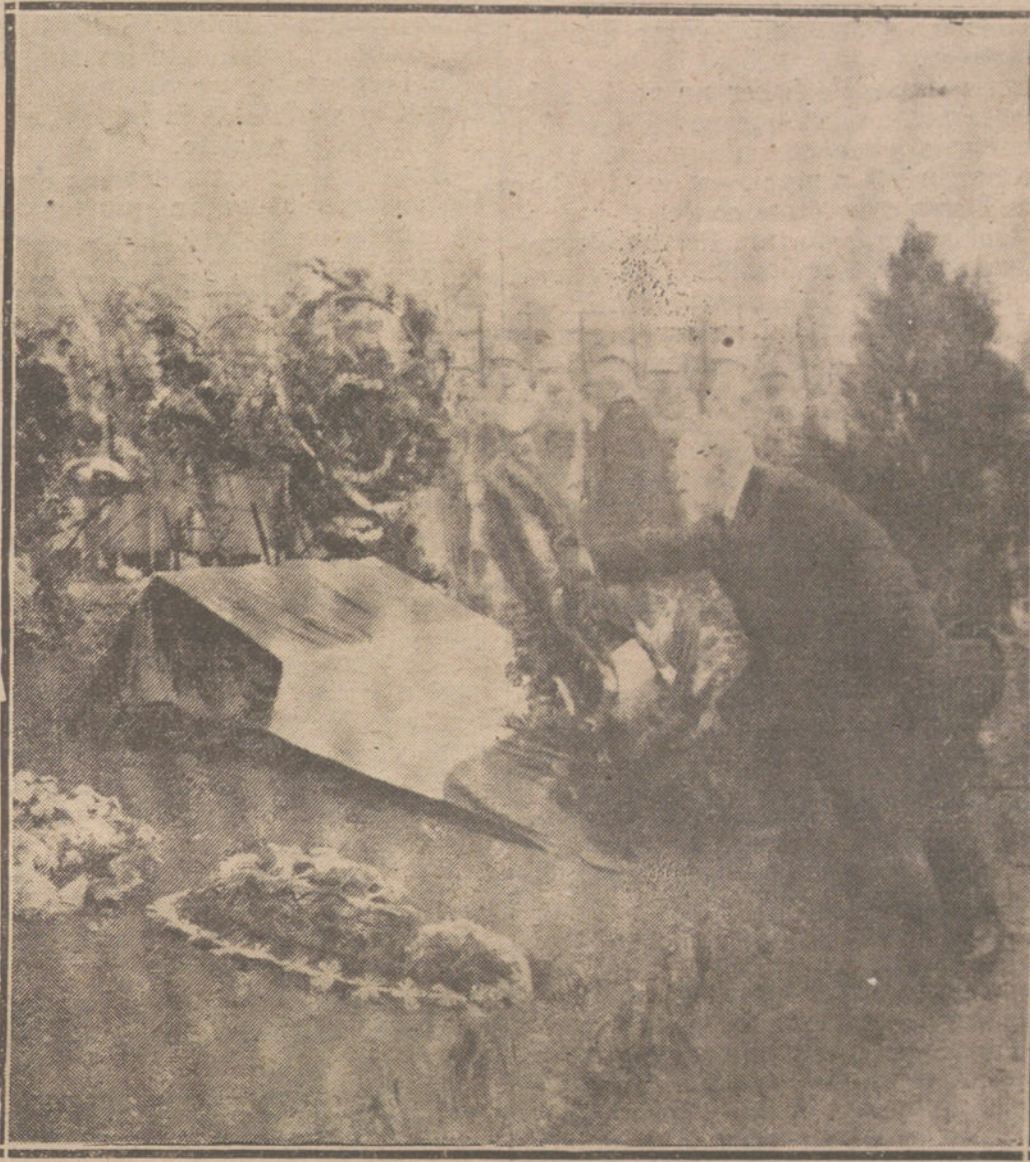
LOS ULTIMOS ACTOS OFICIALES DE POINCARÉ.—EL EX PRESIDENTE DE LA REPUBLICA FRANCESA, COLOCANDO UNA CORONA CON LA DOBLE PALMA FRANCESA, EN EL CEMENTERIO MILITAR DE PAVE, ACTO CON EL QUE SE HA DESPEDIDO DE SU VIDA OFICIAL.

cios una circular: «Junta extraordinaria».