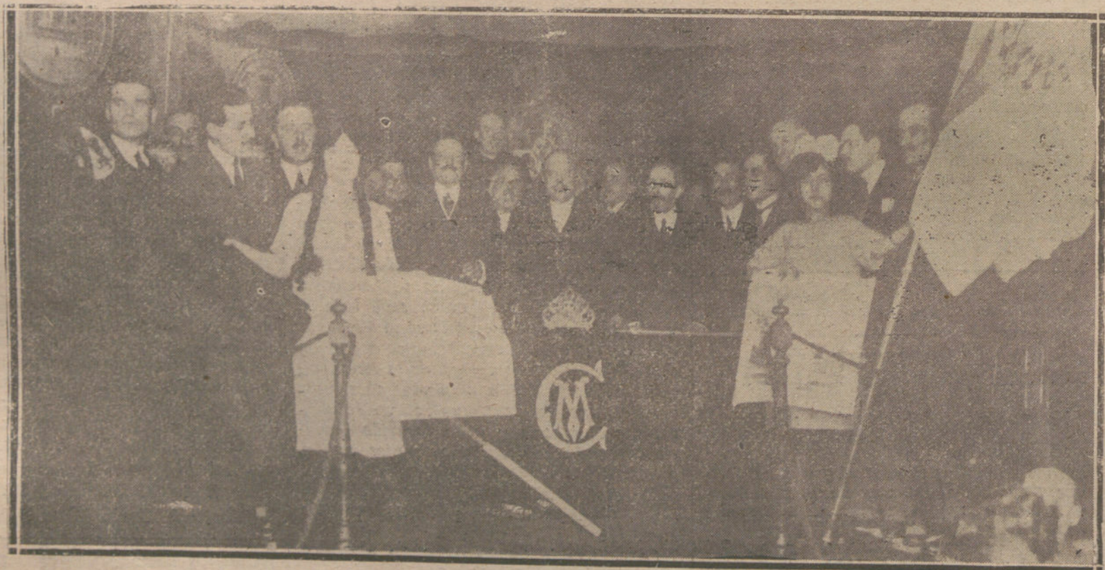
REPARTO DE PREMIOS, VERIFICADO EN EL CENTRO MANCHEGO, BAJO LA PRESIDENCIA DE AGUILERA.