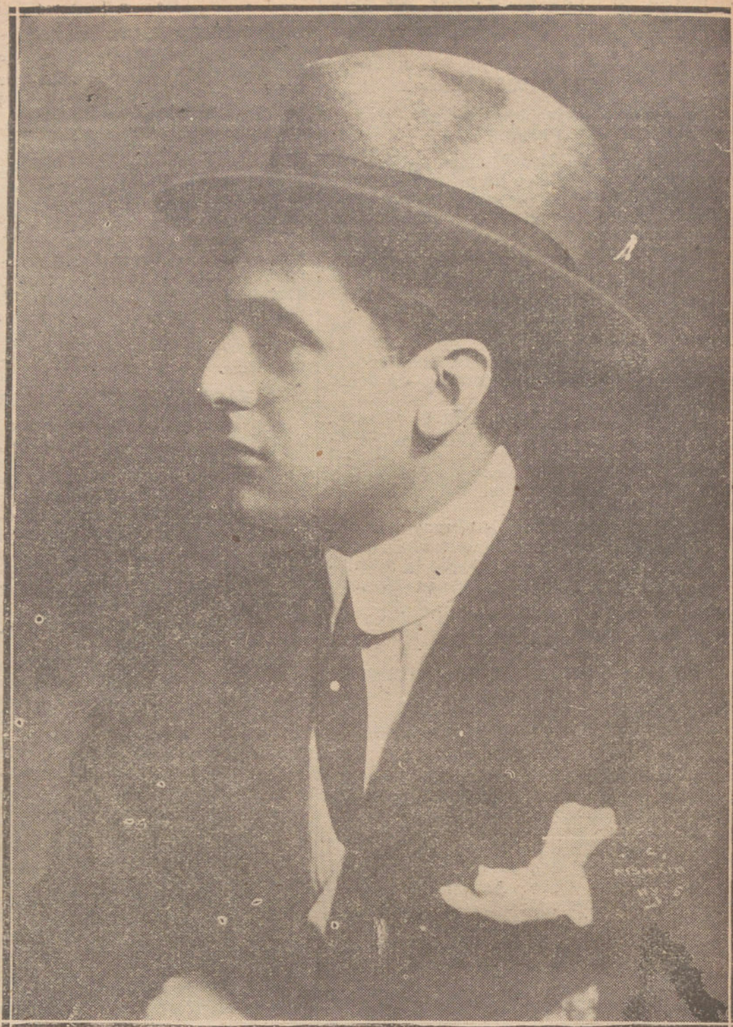
EL NOTABLE BARITONO MONTESANTO, QUE ACABA DE OBTENER UN GRAN ÉXITO, CANTANDO LA ÓPERA «MARUXA» EN EL TEATRO REAL.

La compañía del teatro de la Princesa, entretenida en un menester teatral