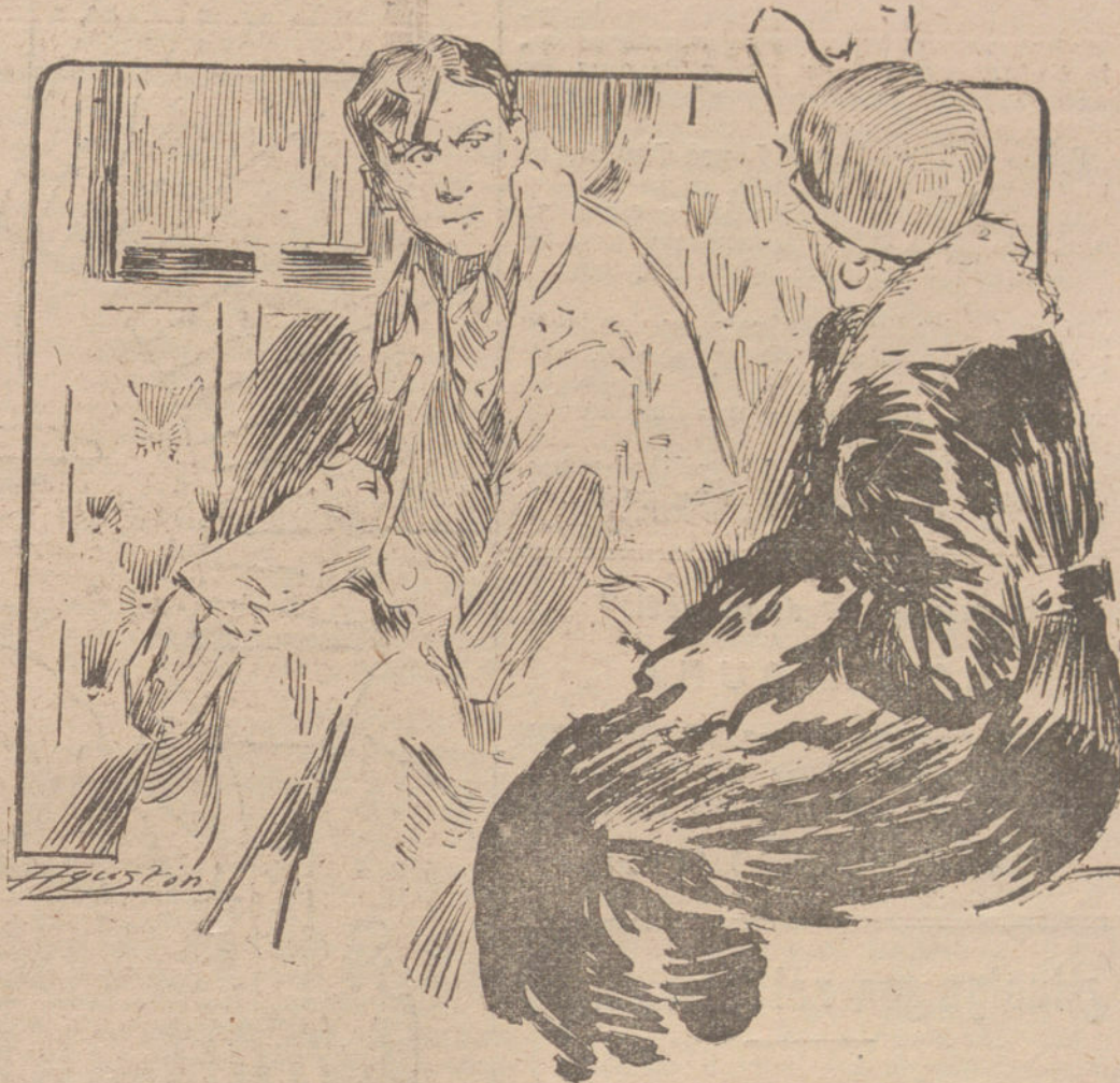
Al arrancar el tren subió a mi coche... Campoamor.

Trasladábame desde Valencia a Cádiz. Mi tío Javier, coronel del octavo montado de Artillería, hallábase, en uso de licencia temporal, en la encantadora ciudad del Sur, gravemente enfermo.