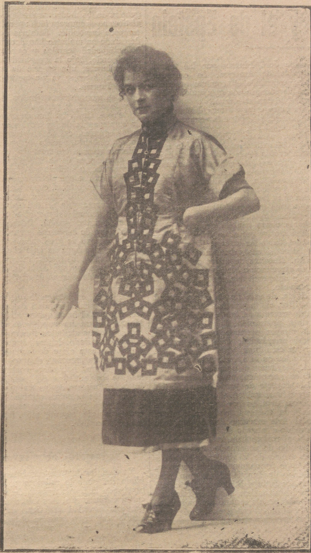
ORIGINAL TRAJE-ABRIGO, MODELO DE LA CASA GOYAERTS.

brientos, de pordioseros, de infortunados.