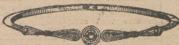
Núm. 1.—Un brillante y diamantes.

CON BRILLANTES DE PRIMERA CALIDAD :: :: DIAMANTES ROSAS DE HOLANDA MONTURAS DE PLATINO FINO Y ORO DE LEY 18 QUILATES CONTRASTADO