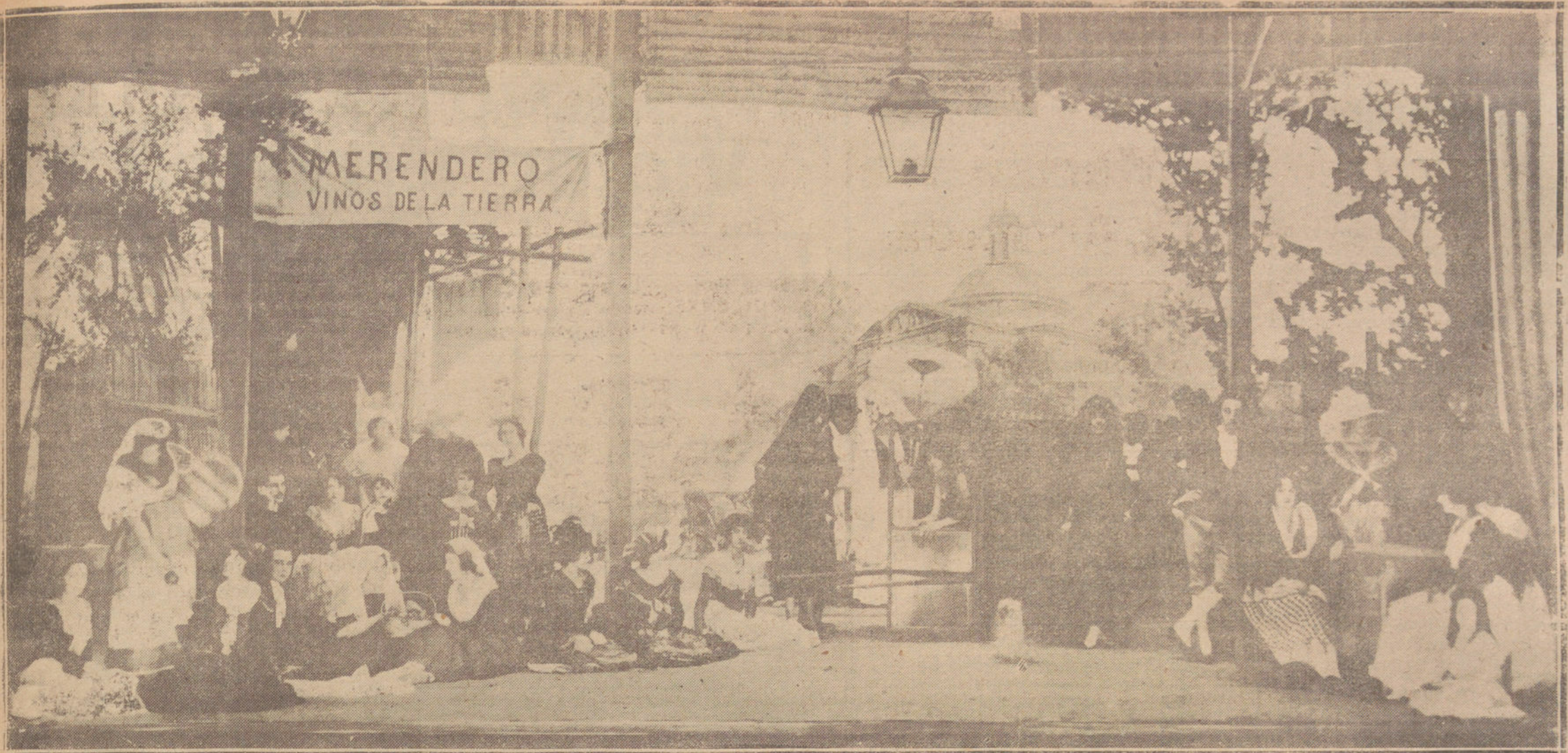
UNA DE LAS COMPOSICIONES DE ESCENAS GOYESCAS, DIRIGIDA POR MORENO CARBONERO, QUE SE EXHIBIRÁ ESTA NOCHE EN EL TEATRO DE LA PRINCESA, EN LA FUNCIÓN ARISTOCRÁTICA A BENEFICIO DE LAS VÍCTIMAS DE LOS TERREMOTOS DE MEJICO.