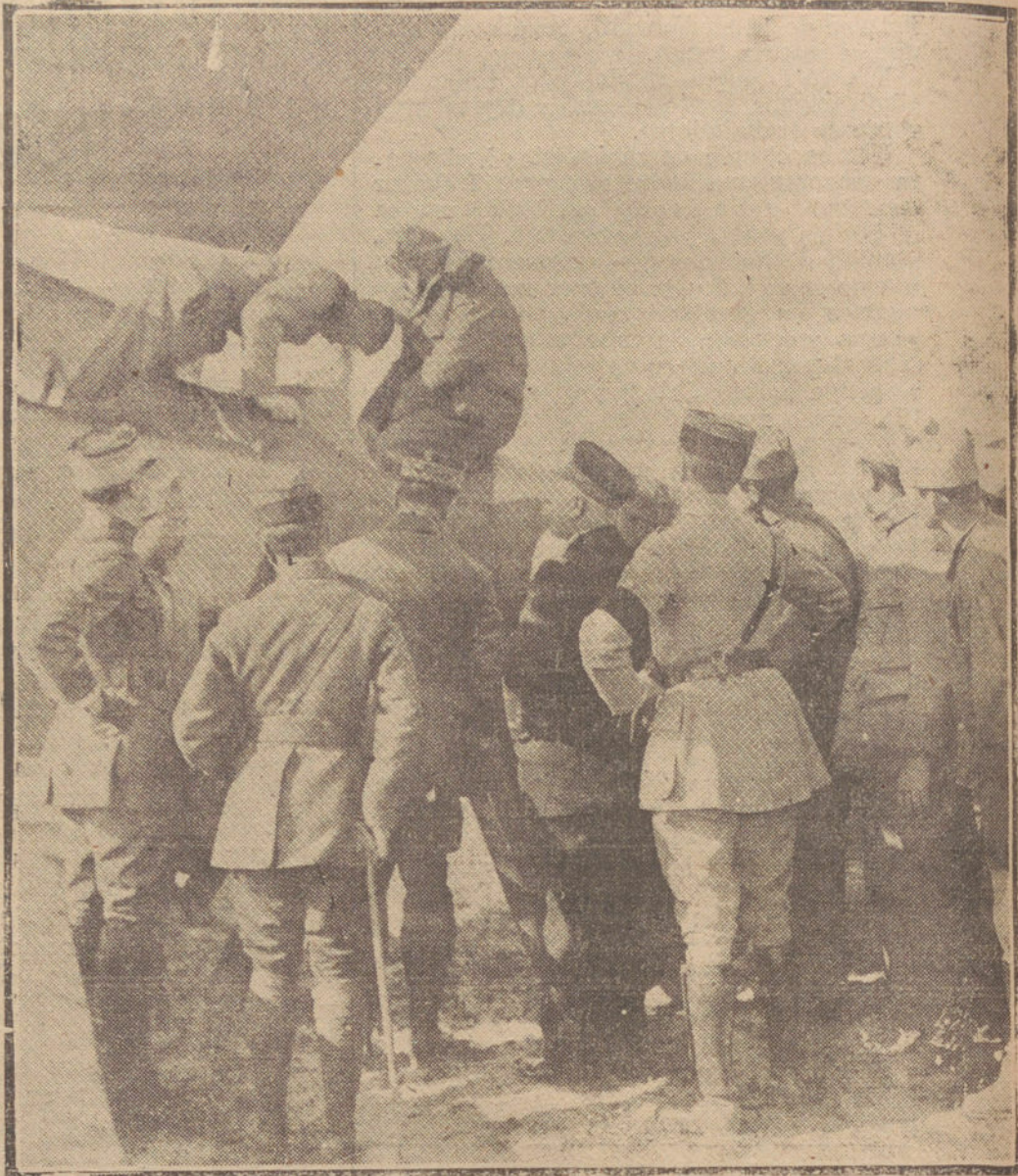
EL «RAID» AEREO AL GERTOMBUCTION.—EL GENERAL NIVELL DESPIDIENDO A LOS TREPIDOS AVIADORES, EN EL MOMENTO DE EMBARCAR ESTOS EN EL AERODROMO DE HUSSEIN-DEY.

Hallábase el criminal, Mamerto, Lázaro, de treinta y tres años, descargador en la plaza de los Mostenses, trabajando en su oficio, cuando se encontró con otro mozo, llamado Manuel Fer-