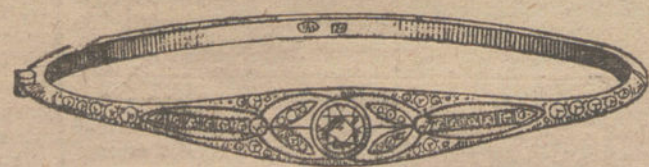
Núm. 4.—Tres brillantes y diamantes.