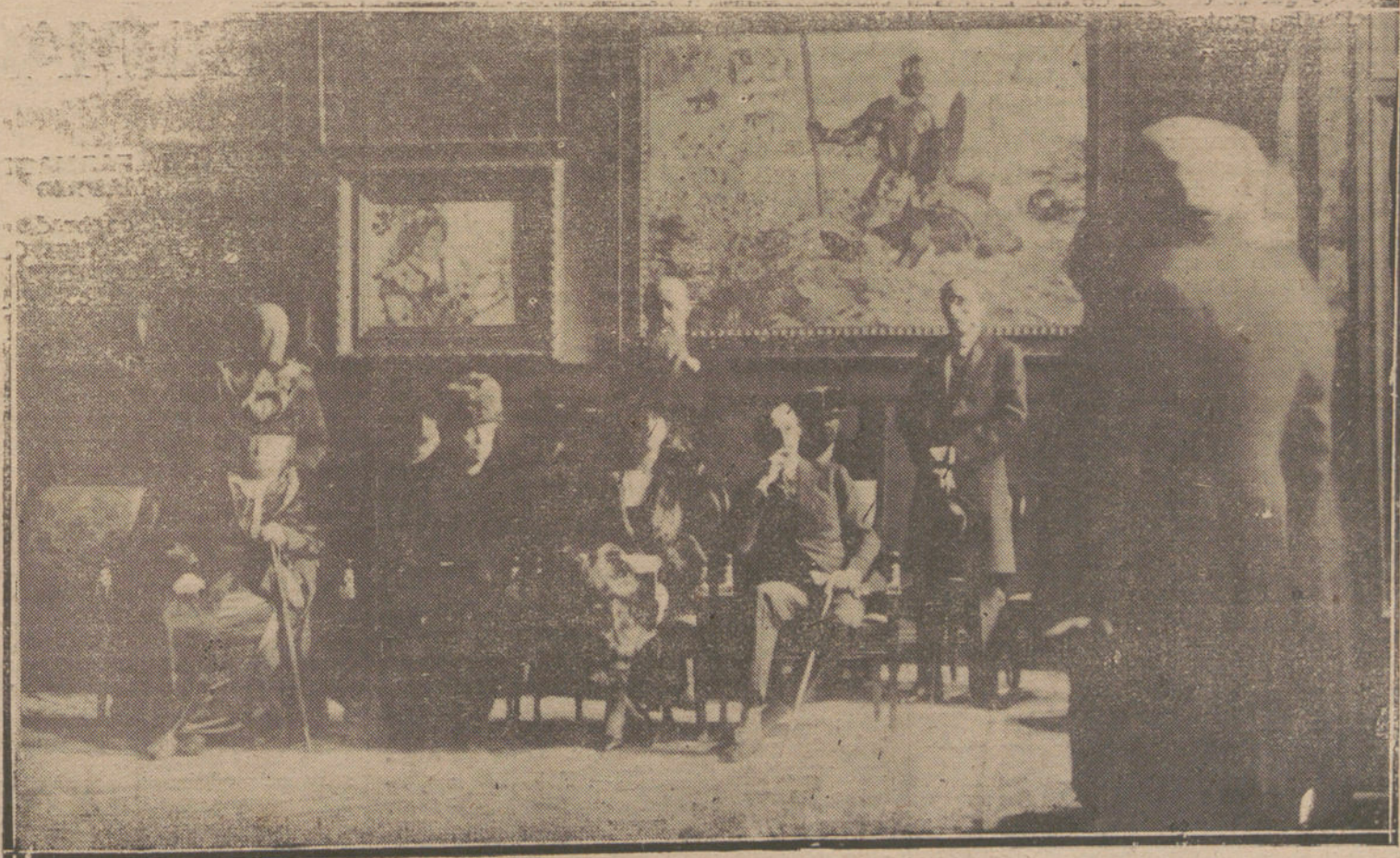
LA FAMILIA REAL, PRESIDIENDO LA SOLEMNE INAUGURACION DE LA SALA CERVANTES DE LA BIBLIOTECA NACIONAL.

Y ahora, entre nuestros nuevos escritores, entre la juventud, se va diseñando y se afina el sentido humorista. Penosa orientación que es la prueba de nuestra organización social, tan gastada, tan descompuesta en sus rasgos de sinceridad, honor, y hasta fe y sed de idealidad. Deo de ellos, sobre todo, son ya verdaderas figuras del nuevo estilo, diestros humoristas de temperamento plenamente definido; con, naturalmente, W. Fernández Flores y Julio Camba. En otros muchos, aun en el mismo Ramón Gómez de la Serna—más dado a la parodia—, se cuecha el borbotar del humorismo, saltar de pronto, en una frase, en una ima-