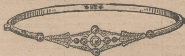
Núm. 3.—Nueve brillantes y diamantes.