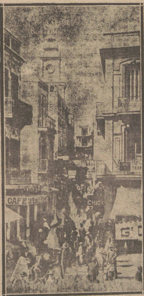
LA CALLE PRINCIPAL DE TÁNGER, DEL MAS GENUINO CARÁCTER ESPAÑOL, CON SU IGLESIA ESPAÑOLA, SUS EDIFICIOS ESPAÑOLES, SUS TÍPICOS CAFÉS ESPAÑOLES, SU RULLOROSO TRANSITO, SU ALEGRIA ANDALUZA.