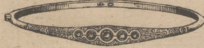
Núm. 2.—Cinco brillantes y diamantes.