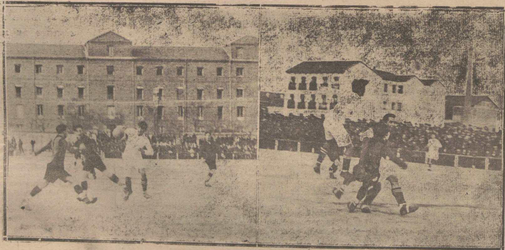
ALGUNOS MOMENTOS INTERESANTES DEL PARTIDO DE FOOTBALL JUGADO ENTRE LOS EQUIPOS DEL RACING Y MADRID F. C.

Al examinar la actitud de Mustafá Homa, M. Denis Cochin dice, al terminar, que parece escogido el momento para hablar de paciencia y de reconciliación con Turquía.—Radio.