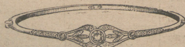
Núm. 5.—Tres brillantes y diamantes.