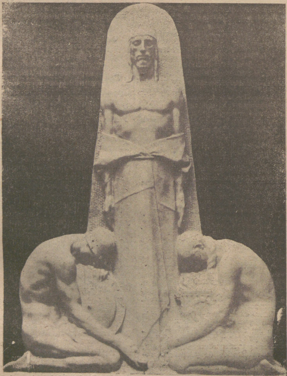
MAUSOLEO PARA CEMENTERIO DE BUENOS AIRES, OBRA DEL ESCULTOR MATEO INURRIA.