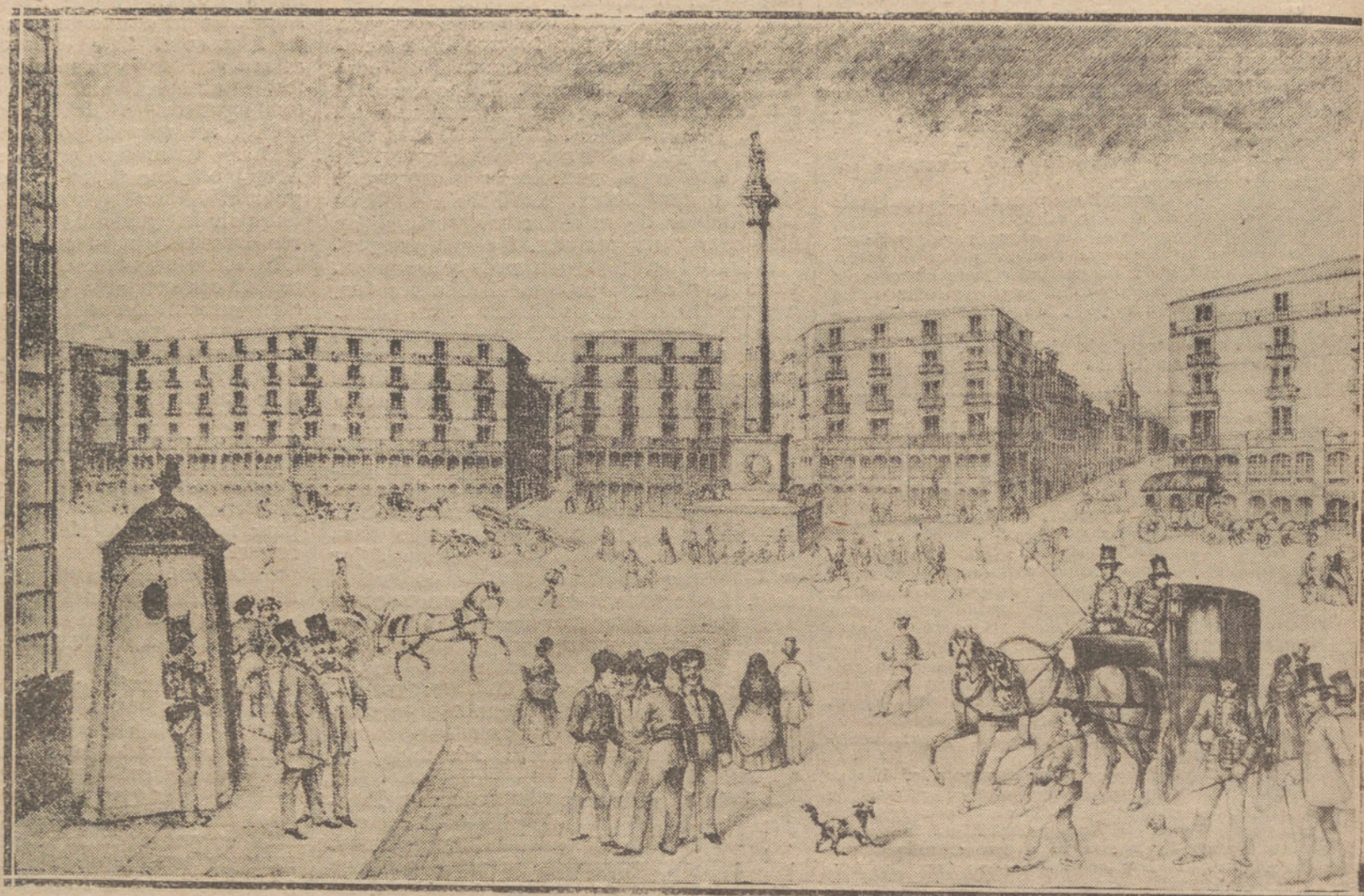
PERSPECTIVA DE LA PUERTA DEL SOL TAL CUAL SERA, DEDUCIDA DE LOS PLANOS EXPUESTOS POR EL AYUNTAMIENTO, CON LAS MODIFICACIONES PROYECTADAS EN ELLOS Y EN EL ORNATO DE LA NUEVA PLAZA; PARA COMPLETA INTELIGENCIA DEL PLANO LITOGRAFIADO EN COLORES, EN QUE SE ENCUENTRAN LAS REFORMAS QUE DEBEN SUFRIR LAS PLANTAS DE LOS EDIFICIOS. (DE UN GRABADO DE EPOCA.)

Muestra de uno de los interesantísimos grabados que figurarán en nuestro extraordinario