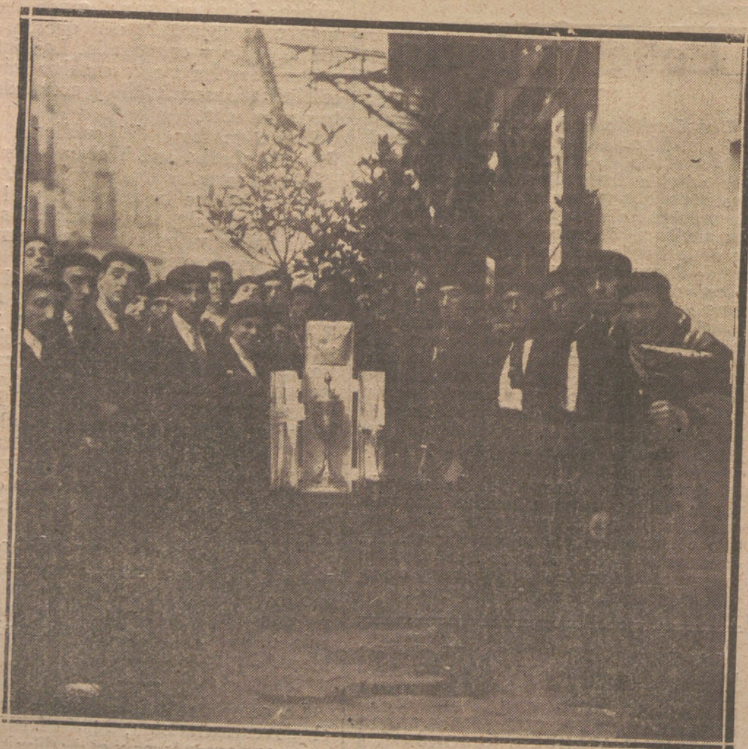
LOS DEPORTES EN SAN SEBASTIAN.—GRUPO DEL EQUIPO BILBAO QUE GANÓ LA COPA DE NUESTRO CORRESPONSAL GRAFICO «PHOTO-CARTE». EN EL CROSS DEL SARTAKO.

Clase especial de lectura y escritura en Braille, Solfeo, Guitarra, los lunes, miércoles y viernes, de seis a ocho; Violín, martes, jueves y sábados, de seis a ocho; Piano, los mismos días, de cuatro a seis; Asientos de rejilla, lunes, miércoles y viernes, de seis a ocho, y Asientos de anea, en iguales días, de ocho a diez.