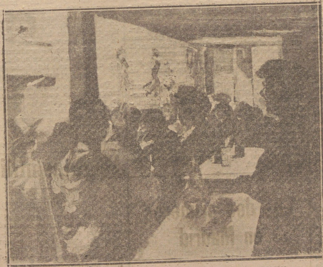
«EL CAFE CANTANTE». POR FILIPE.

En vista de la actitud francamente inquebrantable de los oficiales, los patronos les han dado un plazo de cuatro días, pasado el cual admitirán operarios nuevos.