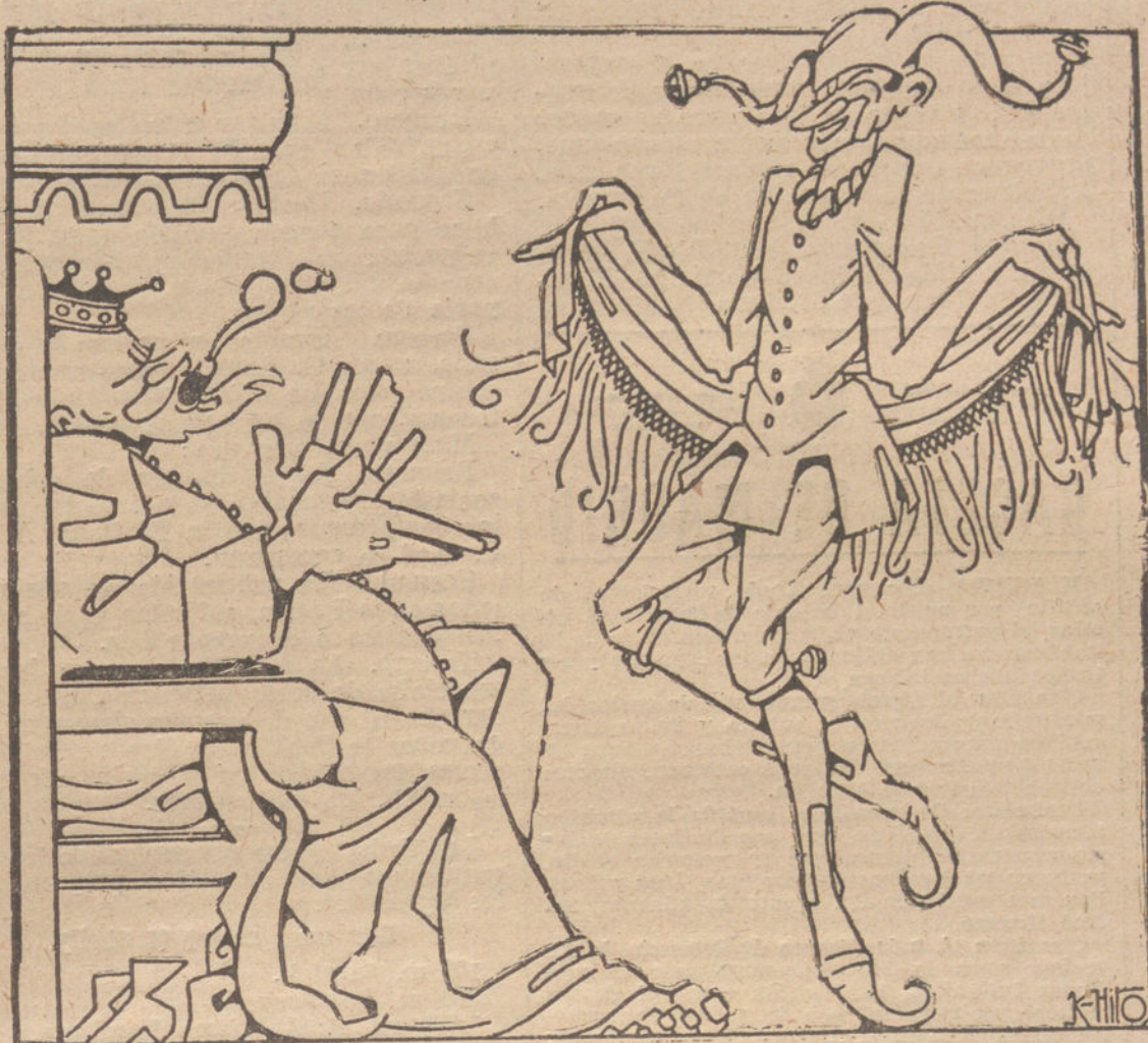
PORTADA DEL CATALOGO DEL VI SALON DE HUMORISTAS. (DIBUJO DE «K-HITO».)