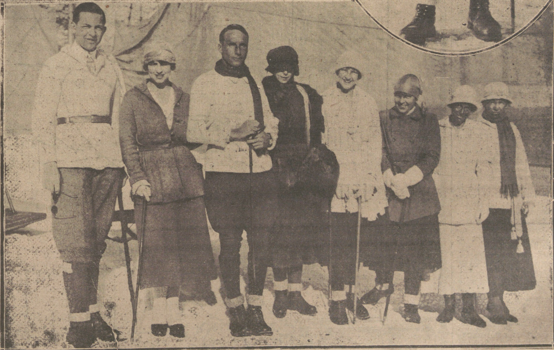
LOS DEPORTES DE INVIERNO EN SAINT MORITZ (SUIZA).—EL MAYOR BEAUMONT Y SU SEÑORA, CAMPEONES DE SKATING. EL EX KEY CONSTANTINO DE GRECIA, QUE TOMO PARTE EN LOS CONCURSOS DEPORTIVOS. INTERESANTE GRUPO DE PATINADORES FOR- MADO POR (DE IZQUIERDA A DERECHA) EL PRINCIPE PABLO DE GRECIA, LA PRINCESA ELENA, EL INFANTE DON ALFONSO DE OR- LEANS, LA PRINCESA BEATRIZ DE SASSONI, LA PRINCESA IRENE Y LAS SEÑORAS MUIRHEAD MENDE Y HULL.