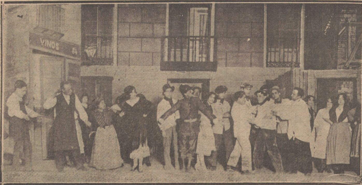
UNA ESCENA DE «EL SUCESO DE ANOCHE», SAINETE ESTRENADO AYER EN EL TEATRO DE NOVEDADES.