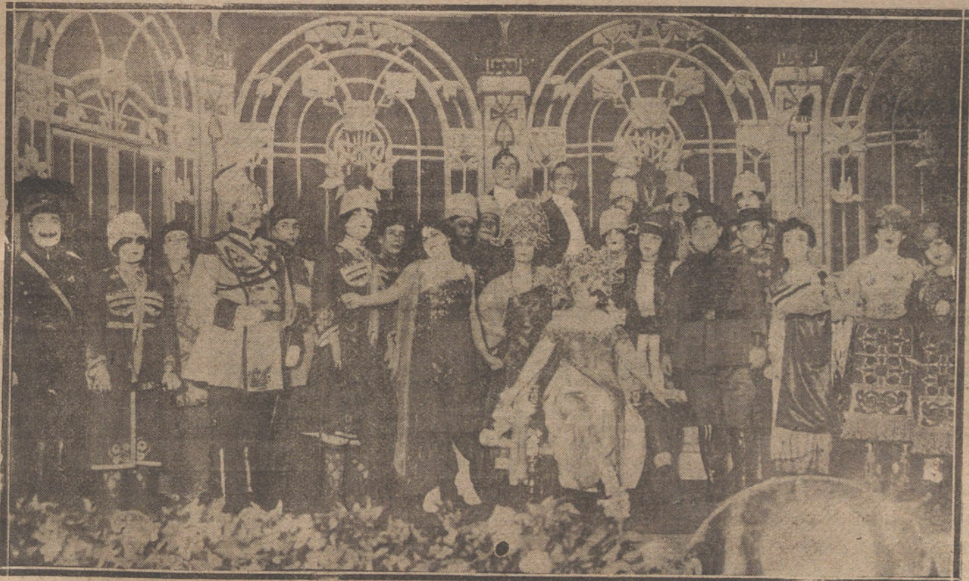
UNA ESCENA DE LA NUEVA OPERETA «LA PRINCESA DE LOS BALKANES», ESTRENADA AYER EN EL TEATRO DE LA ZARZUELA.