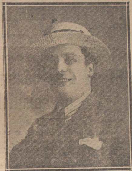
AUGUSTO SOTO, PRIMER TENOR COMICO PERUANO DE LA COMPANIA DE ESPERANZA IRIS, QUE HA DEBUTADO CON GRAN EXITO EN LA OPERETA «SIBYL»

Al final del primer cuadro y al caer el telón definitivamente los autores fueron llamados al proscenio.—D. G.