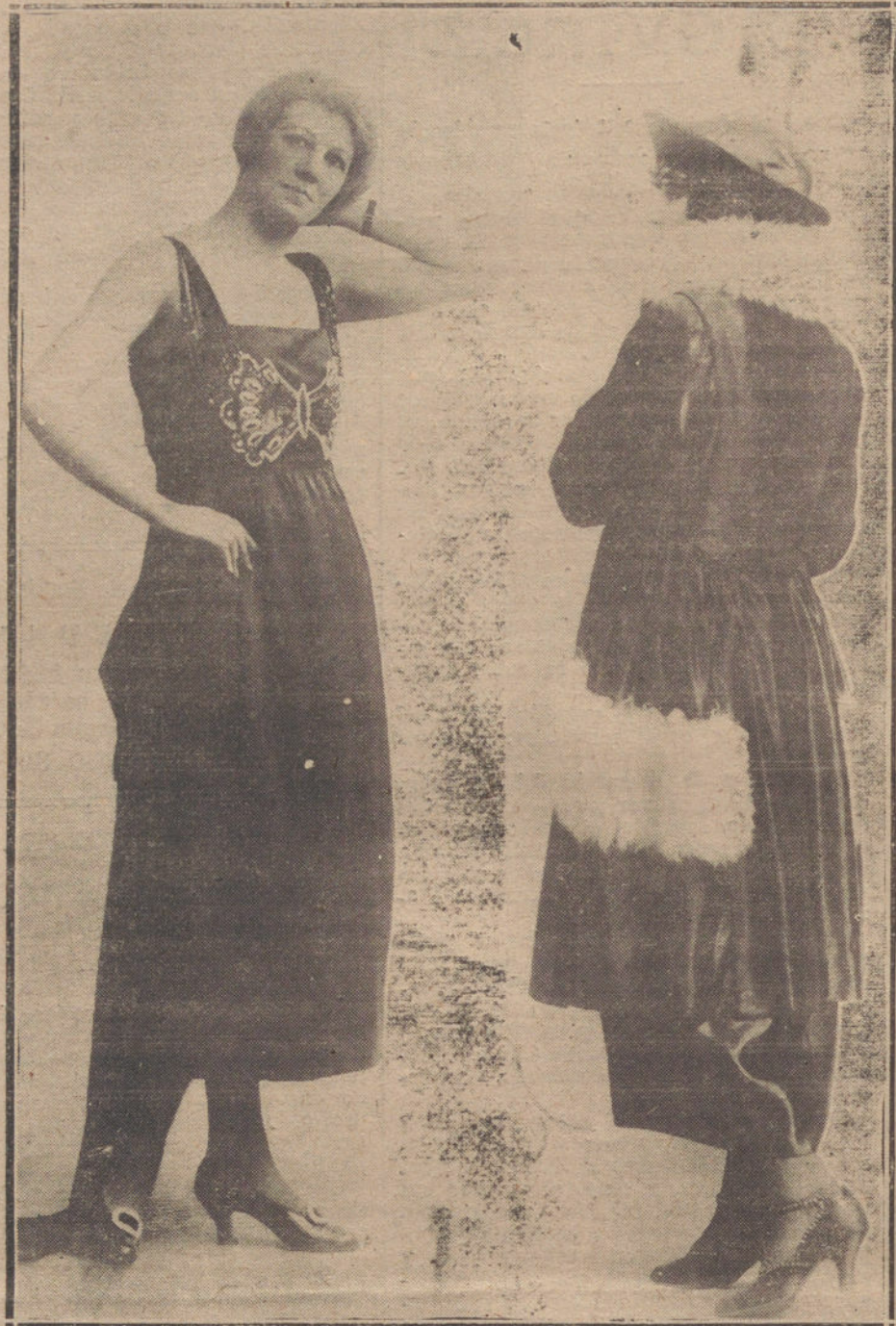
DOS MODELOS INTERESANTES DE TRAJES DE SALON Y CALLE, PRESENTADOS POR LA CASA MILLE DE CHAQUE

mos suprimido en los capítulos de gastos, aquí, 100.000 francos; allá, 200.000; en otras partes, un millón o más.