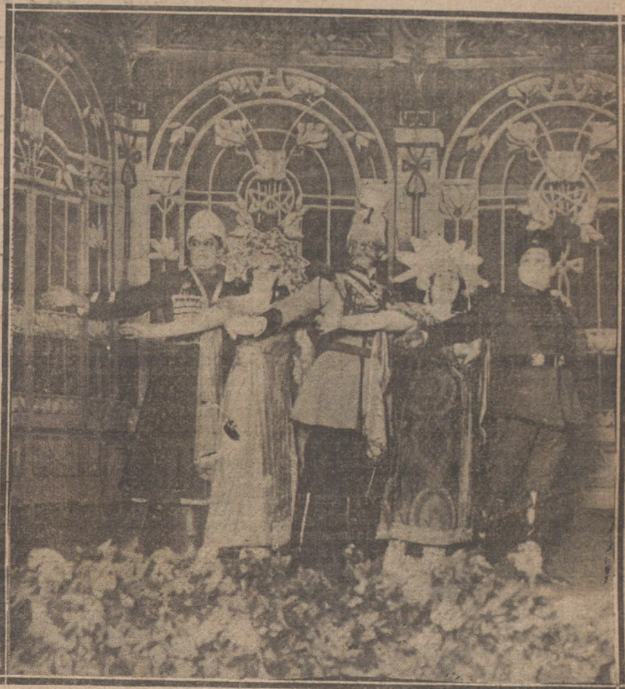
UNO DE LOS NUMEROS MAS SALIENTES DE «LA PRINCESA DE LOS BALKANES», REPRESENTADA AYER EN LA ZARZUELA, EN LA FUNCION A BENEFICIO DE LA ASOCIACION DE LA PRENSA (FOT. VIDAL).

Yo me temo que algunos profesores tiemblan de la libre competencia. El día que los discípulos se viesen necesitados a buscar aquellos profesores que