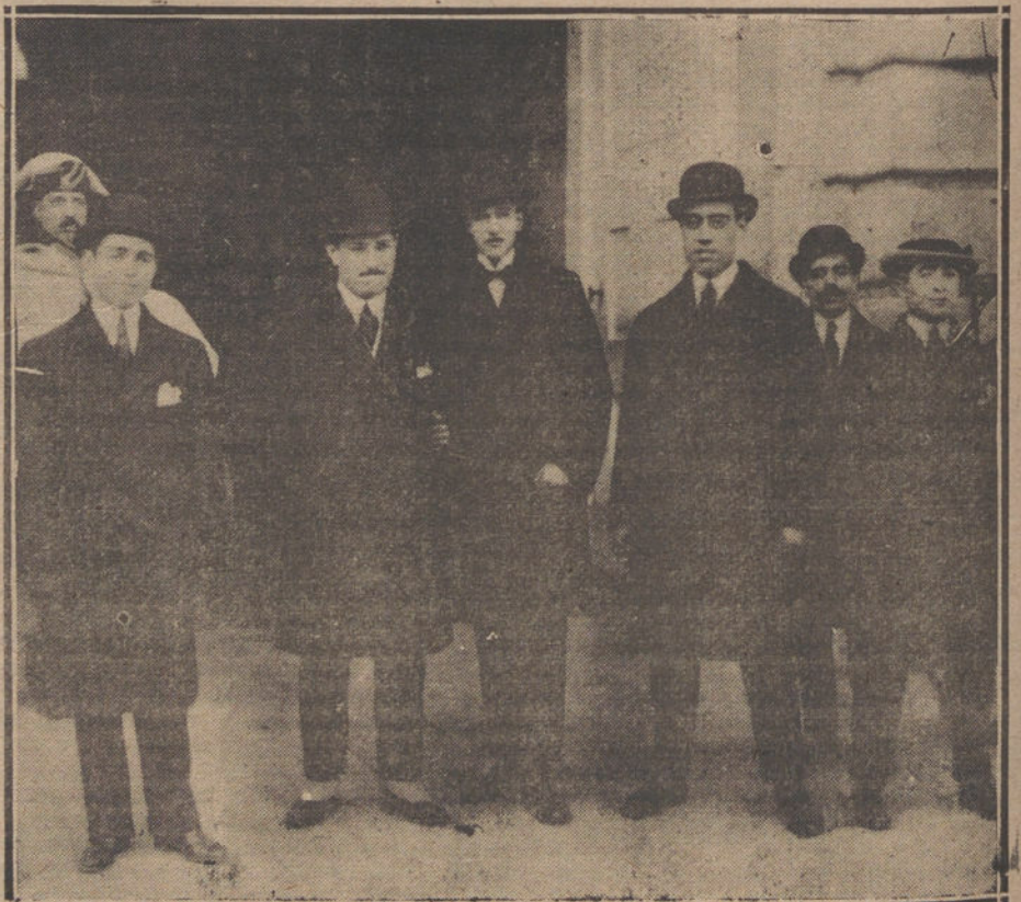
COMISION DE LA ASOCIACION DE ALUMNOS DE INGENIEROS Y ARQUITECTOS, AL SALIR DE PALACIO DESPUES DE HABER SIDO RECIBIDA POR S. M. EL REY.

tegral y crítica que ha presentado al Congreso de los Diputados el presidente de la Asociación sobre todas y cada una de las diferentes fórmulas que hasta la fecha se han ideado para solucionar el problema ferroviario de España. La copia de este último trabajo ha sido pedida para estudiarla por los jefes de fuerzas políticas señores conde de Romanones, La Cierva y don Melquiades Alvarez.