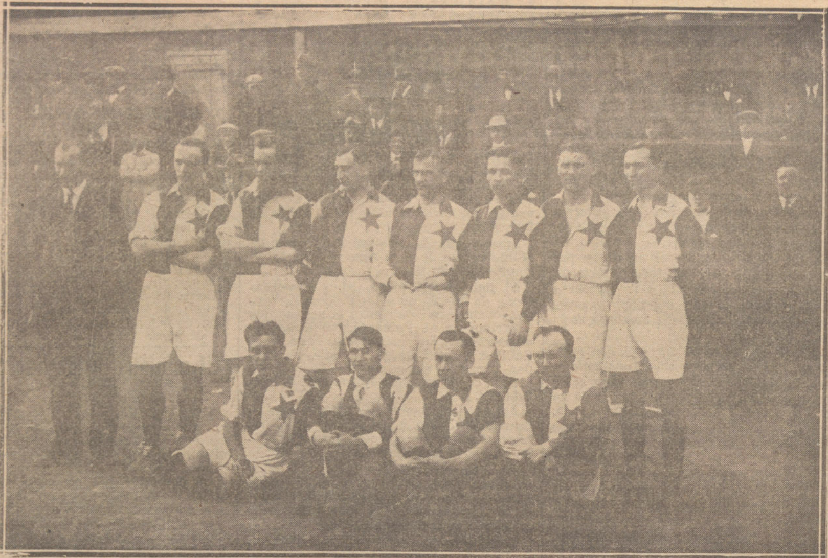
EL EQUIPO DE FOOT-BALL «SLAVIA», DE PRAGA (CHECO SLOVAQUIA), QUE ESTOS DIAS JUEGA EN BARCELONA CON EL «F. C. BARCELONA», CAMPEÓN DE CATALUNA.

PARIS. La Comisión del Régimen interior de la Cámara de Diputados tiene el propósito de presentar una proposición pidiendo que las dietas que cobran los diputados, que ahora son de 15.000 francos, se eleven en lo sucesivo a 30.000. La proposición se discutirá el próximo miércoles.—Hallet.