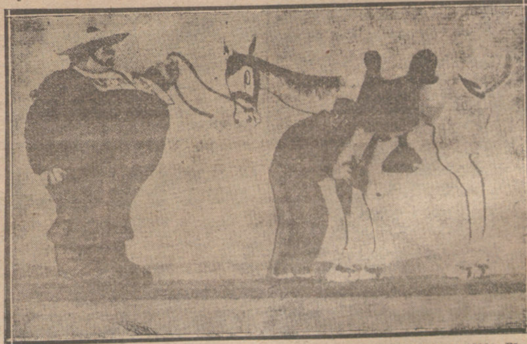
EL JAMELO SINDICALISTA.—NO SERIA PESADO QUE NOSOTROS EXIGIERAMOS EL JF NETE DE TAMAÑO NATURAL...