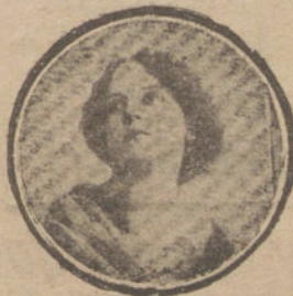
Nombre y dirección muy claros.

PIDASE EN TODAS LAS farmacias el purgante The Civil. Caja de una dosis, 20 centimos.