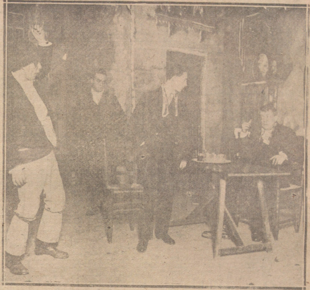
UNA ESCENA DEL DRAMA «EN MITAD DEL CORAZÓN», ESTRENADO EN EL TEATRO NOVEDADES, DE BARCELONA, POR LA COMPANIA MORANO.

¿Qué pintura es, pues, la verdaderamente sincera? ¿Esta de los paisajes ingleses, dando la impresión lógica, ordinaria y real, en su calidad y simbolismo, o esa otra de los paisajes de