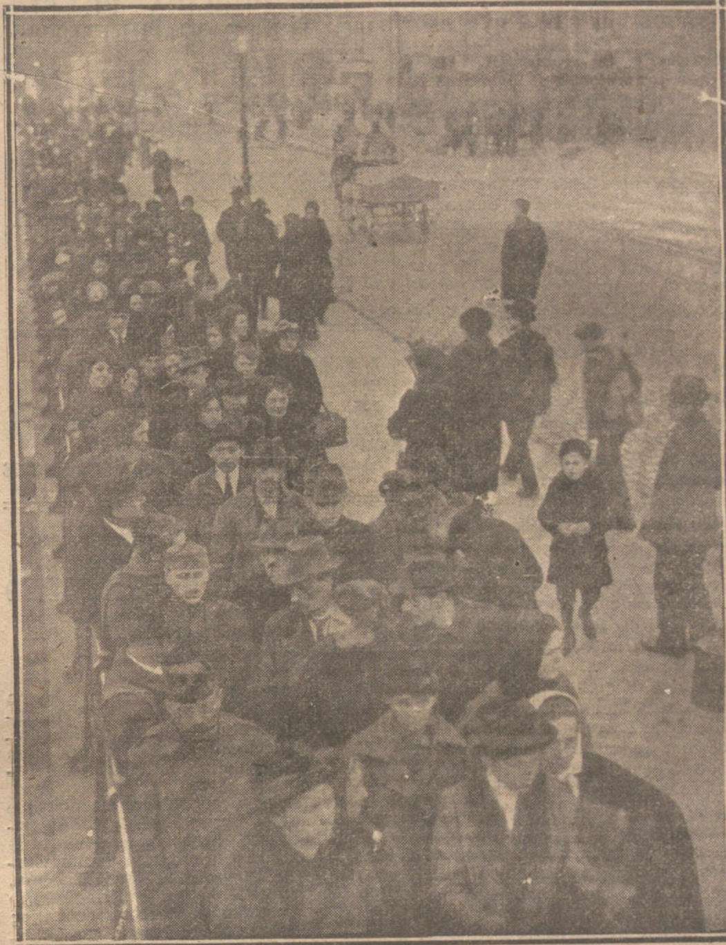
LA SITUACION DE AUSTRIA.—COLA FORMADA A LA PUERTA DEL EDIFICIO OCUPADO EN VIENA POR LA MISION ALIADA, PARA INSCRIBIRSE EN LA LISTA DE SOCORROS PARA EL REPARTO DE LAS SUBSISTENCIAS ENVIADAS DE AMERICA.

Un mar de tinta se vertió sobre satinado papel para justificar y avalar las acusaciones; en las probanzas pú- tose a contribución la lógica, la fotografía, la pintura y el cinegrabado.