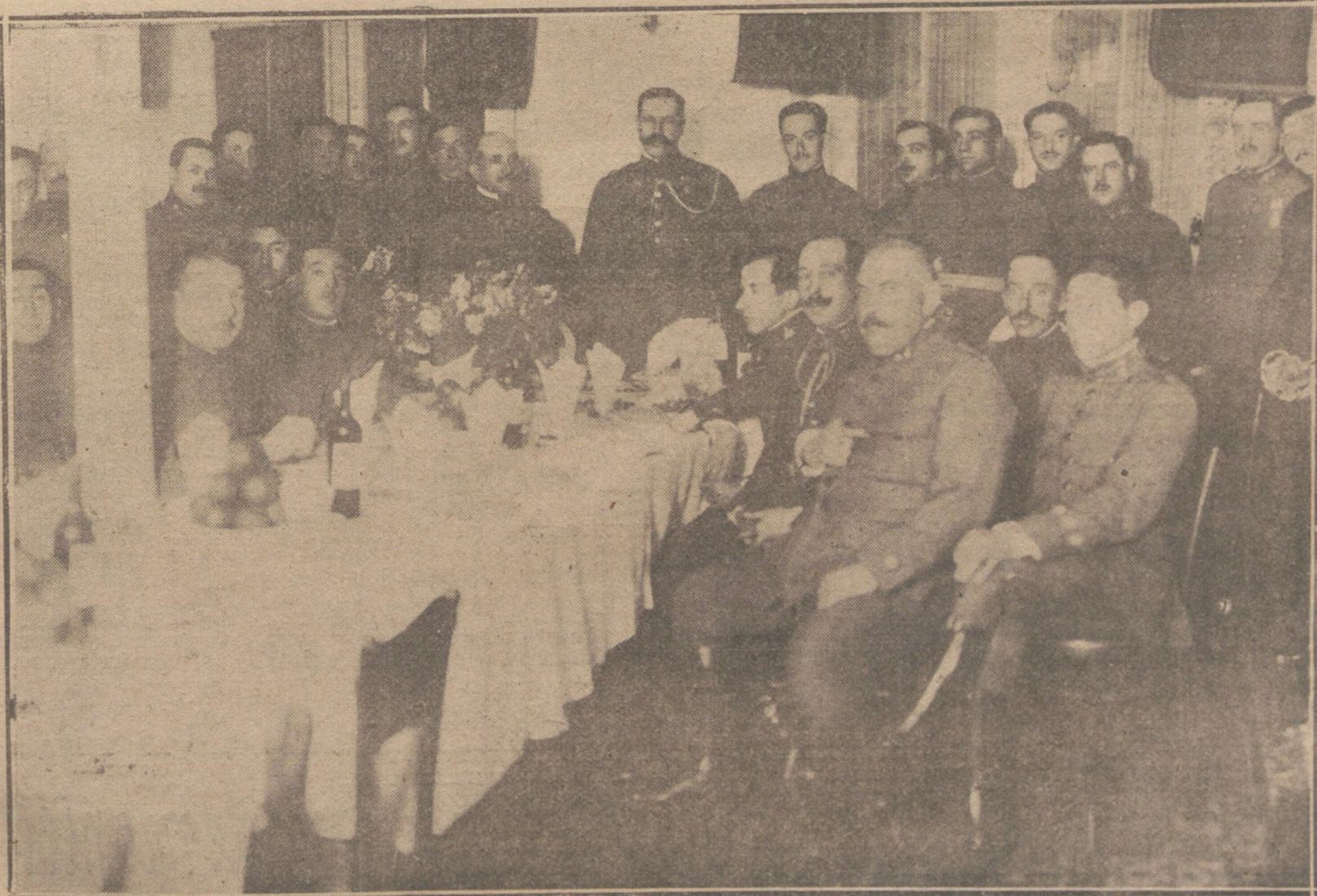
ANQUETE MENSUAL CELEBRADO EN MELILLA POR LOS JEFES Y OFICIALES DE LAS FUERZAS INDIGENAS, A CUYO ULTIMO ACTO ASISTIO EL GENERAL FERNANDEZ SILVESTRE PRONUNCIANDO UN ELOQUENTE Y PATRIOTICO DISCURSO.

Otra aclarando y completando los conceptos de la Real orden de 16 de diciembre de 1918, atemperándolos a la legislación general del Escalafón del Magisterio, y muy especialmente a las Reales órdenes y Real decreto que se indican.