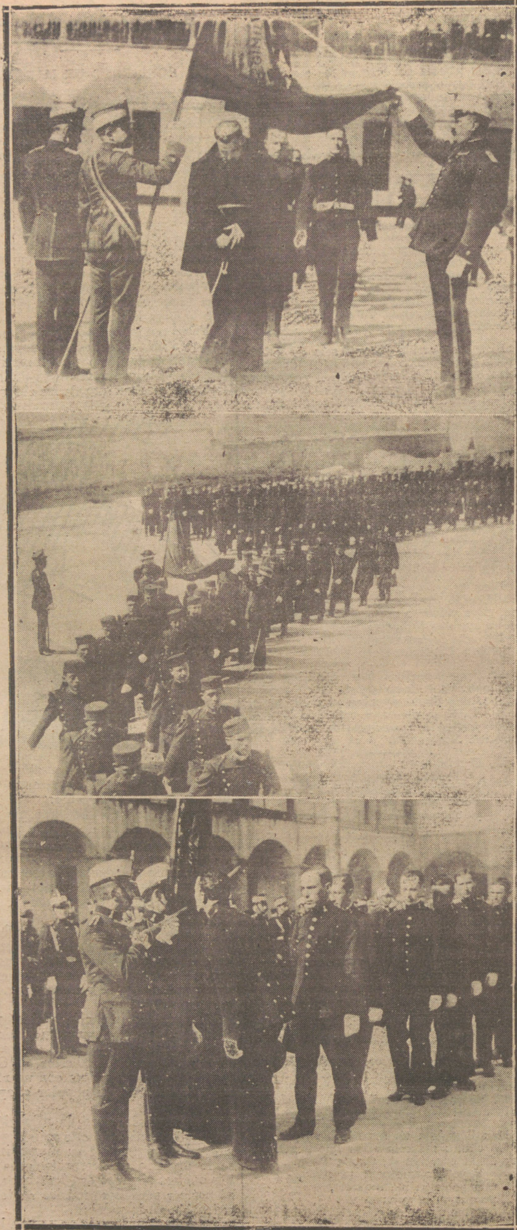
LA JURA DE LA BANDERA.—UN RECLUTA, FRAILE, JURANDO LA BANDERA EN EL REGIMIENTO DE COVADONGA. EL ACTO DE LA JURA POR LOS NUEVOS RECLUTAS DEL REGIMIENTO DE LEÓN. LA JURA EN EL REGIMIENTO DE FERROCARRILES.

Es tan abundante el material de estudio médico-histórico en Europa, que el conferenciante ha podido reunir en su excursión científica, más de 5.000 cuartillas de datos, completamente desconocidos en la bibliografía médica española. Abogó por la creación de un Museo de