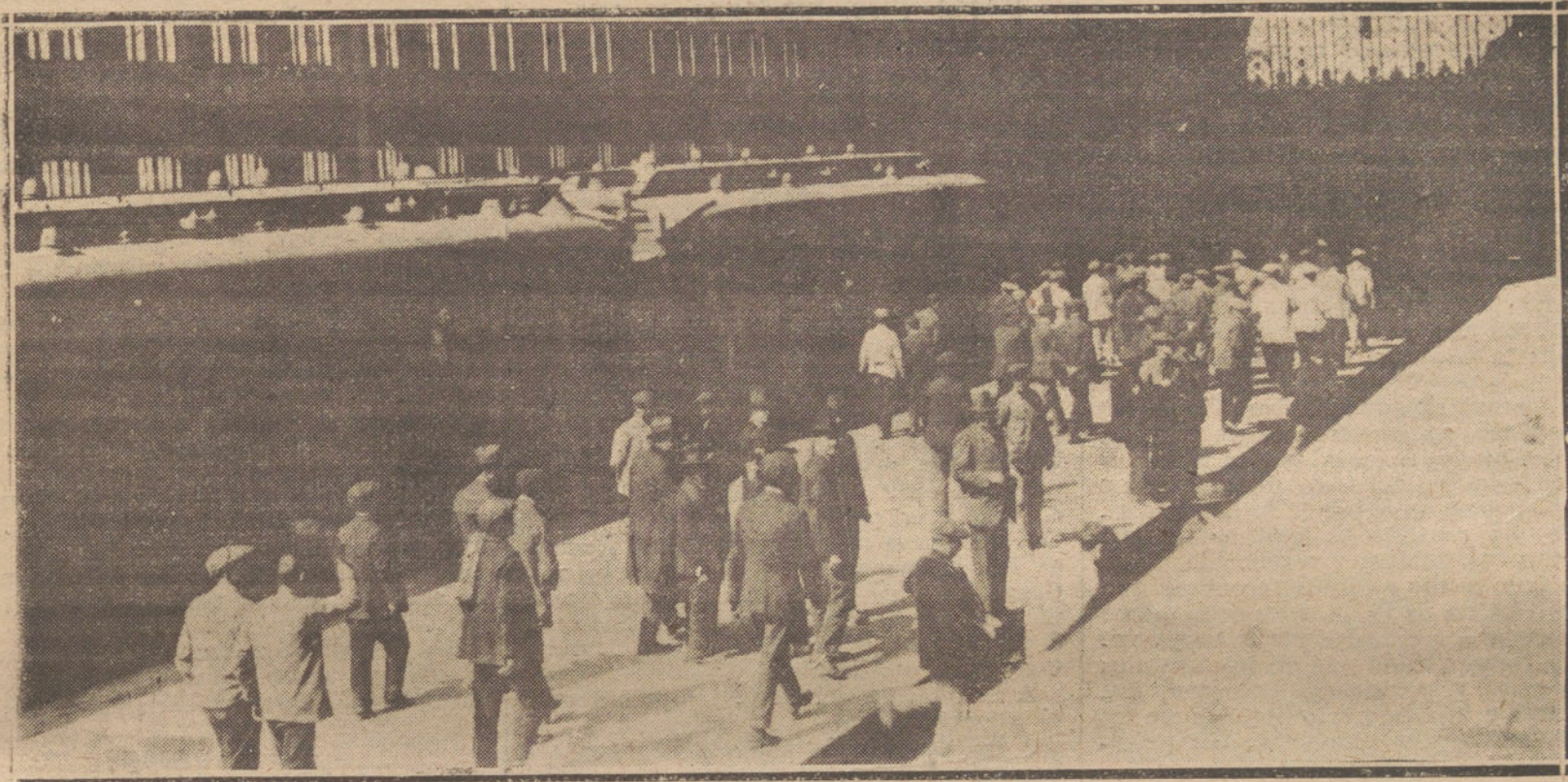
LA HUELGA DE FERROVIARIOS.—OBREROS ABANDONANDO EL TRABAJO EN LA ESTACION DEL MEDIODIA.