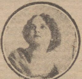
Nombre y dirección muy claros.

LOS NO HAY NADA MEJOR para curar la mentolina del doctor Buena. En todas las farmacias.