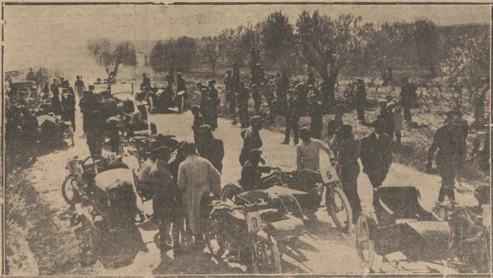
LOS DEPORTES EN BARCELONA.—CARRERAS DE MOTOCICLETAS, ORGANIZADAS POR EL REAL MOTO-CLUB DE CATALUÑA, Y CELEBRADAS EN LA CUESTA DE LOS BRUCHES

—Que el interés por averiguar mi nom-bre no era real, puesto que al oír el mis-mo nombre repetido pocos años después, no recordó. Que la fijeza de mis líneas en su mente era, junto con lo otro, otra gran