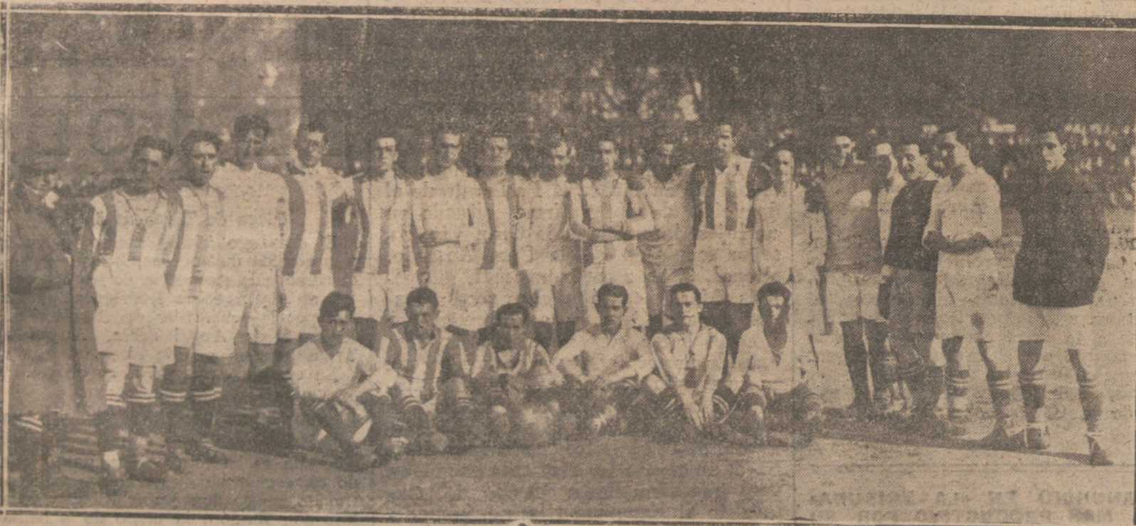
LOS DEPORTES EN SAN SEBASTIAN.—EQUIPOS DE LA REAL SOCIEDAD Y RACING DE SANTANDER, QUE HAN JUGADO SENSACIONALES PARTIDOS DE FOOT-BALL QUEDANDO VENCEDOR EL PRIMERO. (FOTOGRAFIA CARTE)

—Incluyendo en el número 8 en el plan de carreteras del grupo occiden-