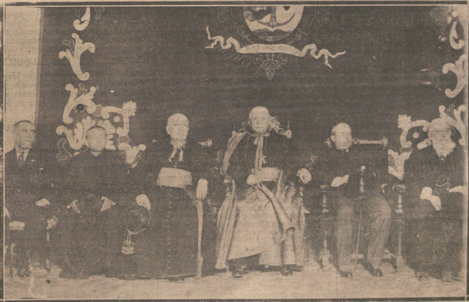
EL NUNCIO DE SU SANTIDAD, MONSEÑOR RAGONESSI, PRESIDIENDO LA VELADA CELEBRADA EN LOS SALESIANOS, PARA CONMEMORAR EL CENTENARIO DEL DANTE.

Cuarta. Que la extradición de sus puestos culpables no puede concederse