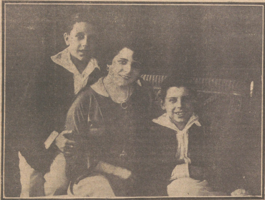
LA GENTIL ARTISTA MEXICANA ESPERANZA IRIS PASA LARGOS RATOS JUGANDO CON SUS HIJOS, COMO UNA DULCE AMIGUITA. SUS HIJOS Y SU ALTE SON LA PREDILECCION DE SU VIDA

El nombre de Esperanza Iris, de esta sugestiva y triunfadora actriz mejicana, tiene ya en sí mismo un extraño misterio, un conjuro de relumbrosidad, como el bello arco de los colores. Dijérase que Esperanza Iris es la artista refulgente. Todo en ella cobra un vivo sentido de luminosidad; todo en ella es centelleo refulgente: el mirar de sus ojos, que tienen flamar de llamas; la risa que salta de sus dientes blanquitos, tal que un borboteo de cascabeles; la vivacidad de sus movimientos, de alegría bulliciosa; hasta la fastuosidad de sus piedras preciosas, del rico tesoro de brillantes con que exorna su figura, como un manto de plata, que la envuelve en chorros de luz.