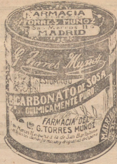
LATAS ECONOMICAS DE 1 1/2 KILOS

Litohum, Saldo 3.000 piezas a mitad precio. Telf. 20-20. Se mas. 5, Carranza, 5.