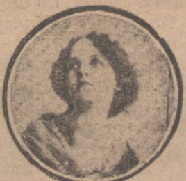
Nombre y dirección muy claros.

LOS NO HAY NADA ME- jor para curarla que la mentación del doctor Buen- na. En todas las farmacias.