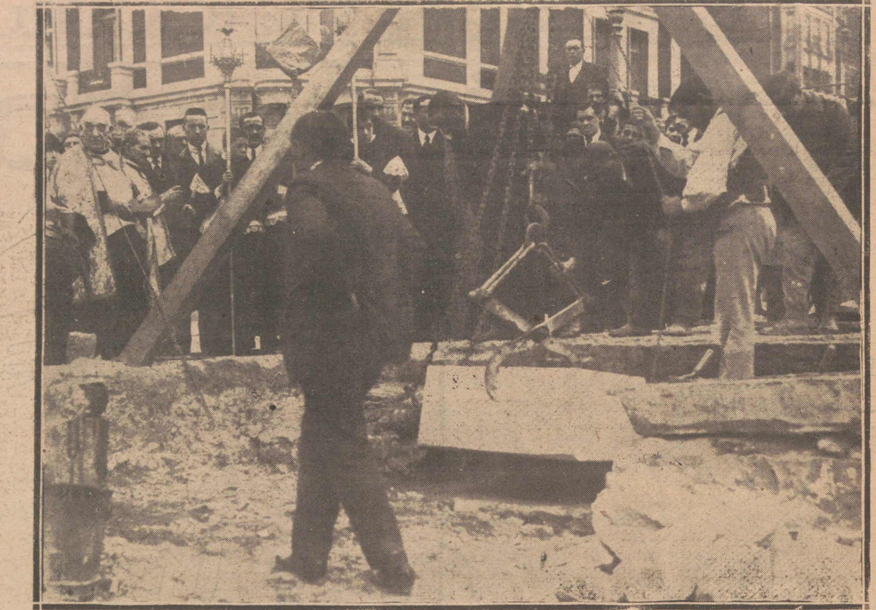
COLOCACION DE LA PRIMERA PIEDRA DE LA CAJA MUNICIPAL DE AHORROS DE BILBAO.

El Viernes Santo, de doce a tres de la tarde, se practicará el santo y piadoso ejercicio de las