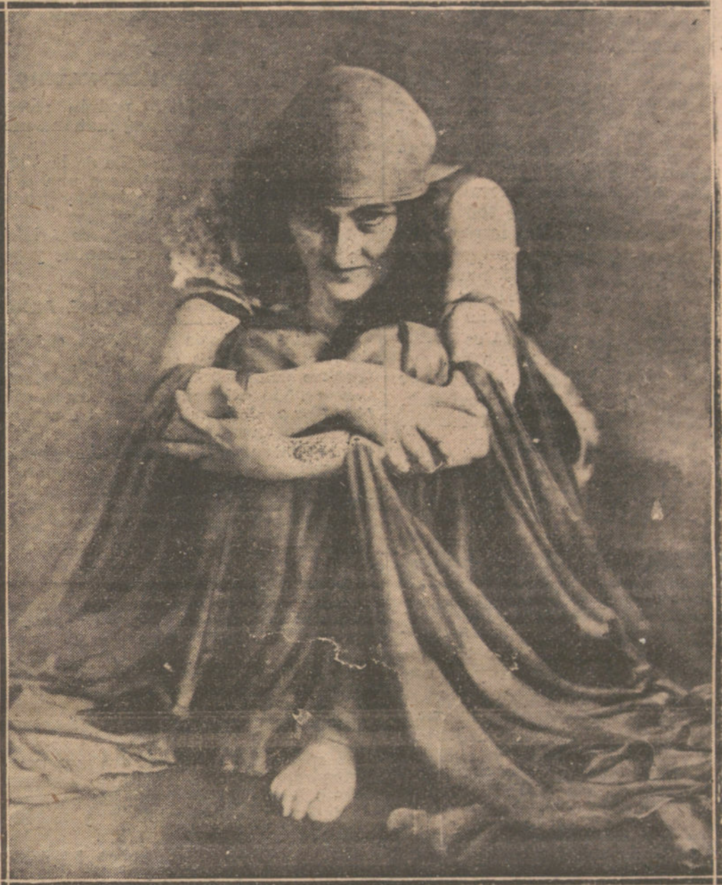
LA GRAN TRAGICA INGLESA SYBIL THORNDIKE, QUE SE HA PRESENTADO EN «HOT-BORN EMPIRE», DE LONDRES, PRODUCIENDO ENORME IMPRESION POR SU MODO PERSONALISIMO DE INTERPRETAR LA TRAGEDIA DE EURIPIDES, «MEDEA»

quiavelo», escribió: «Todas las guerras que se propongan rechazar a los usurpadores, mantener derechos legítimos, garantizar la libertad del Universo y evitar las violencias y opresiones de los ambiciosos, están conformes con la justicia.»