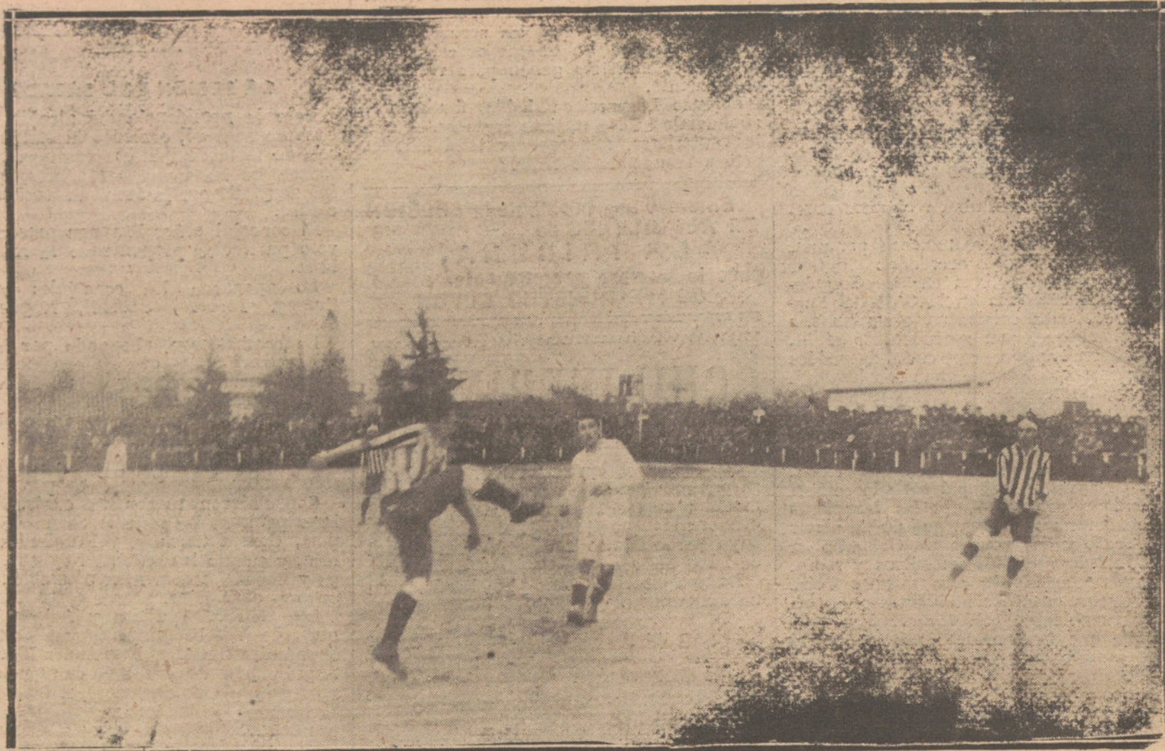
UNA JUGADA INTERESANTE DEL PARTIDO DE FOOT-BALL, SEMIFINAL DE CAMPEONATO DE ESPAÑA, JUGADO AYER TARDE ENTRE EL «ATHLETIC», DE BILBAO, Y EL «MADRID F. C.»

Por último, Sanjurjo dió las gracias, hondamente emocionado, escuchando uná- nime y prolongada ovación de simpatía.