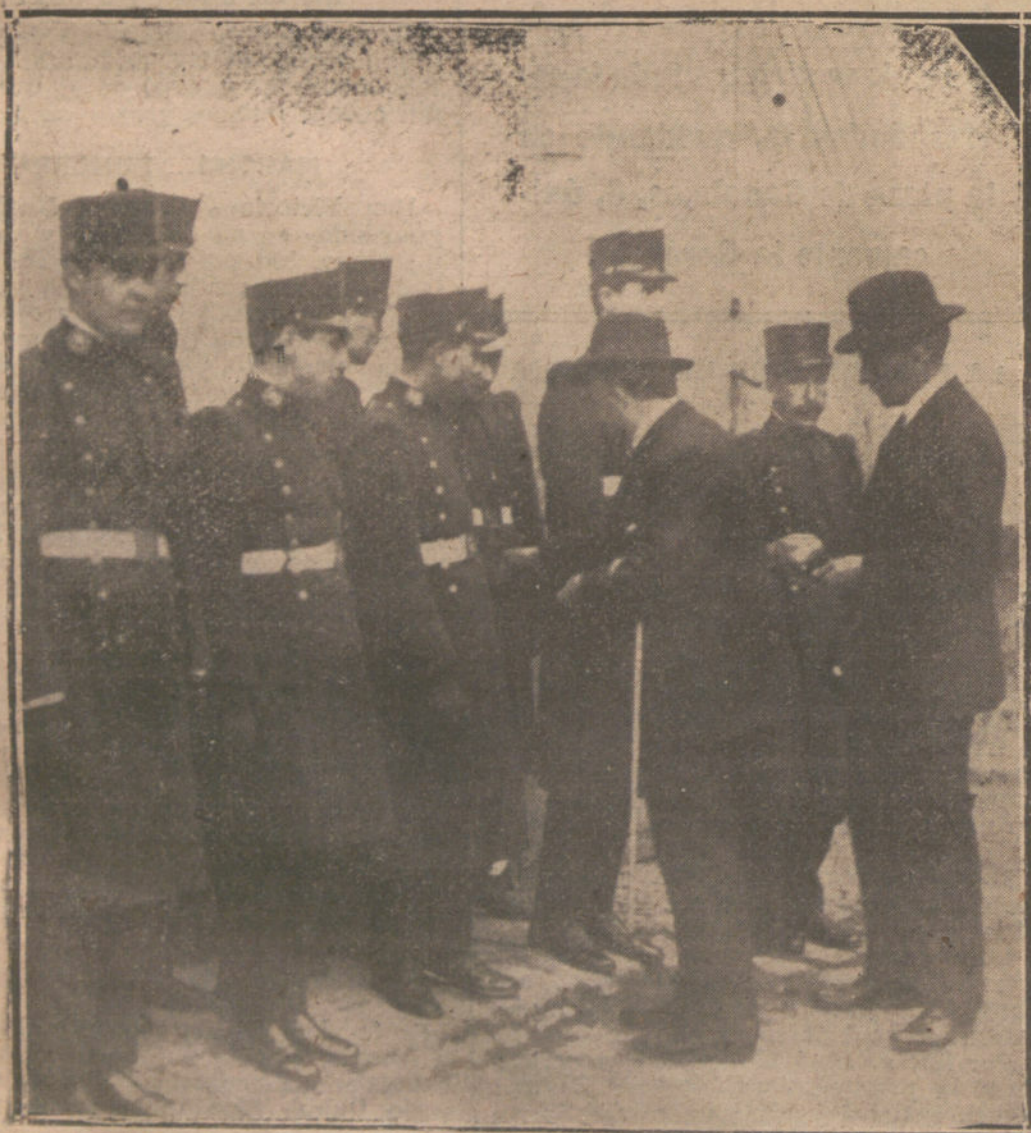
EL PROPIETARIO DE LA CASA INCENDIADA DE LA CALLE DEL MARQUES DE URQUIJO, ENTREGANDO DONATIVOS A LOS SOLDADOS DE SANIDAD MILITAR, QUE CONTRIBUYERON A LA EXTINCIÓN DEL INCENDIO, ACTO VERIFICADO AYER.