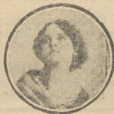
Nombre y dirección muy claros.

MOTOCICLETAS: VENDEN varias Harley sidecar, Harley solas, Indian sidecar, una Scott, todas a prueba; baratísimas. Razón: Garage César, calle Arapiles, 5. Teléfono 4-686-J.