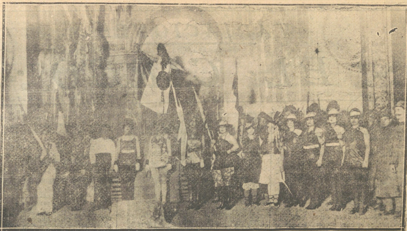
UNA ESCENA DE «BLANCO Y NEGRO», REVISTA ESTRENADA ESTA TARDE EN EL TEATRO DEL CENTRO.

Terminó diciendo que el próximo lunes se celebrará Junta de tenientes alcaldes para cambiar impresiones respecto al problema de subsistencias, pues era parida, río da que se hiciera una política conjunta.