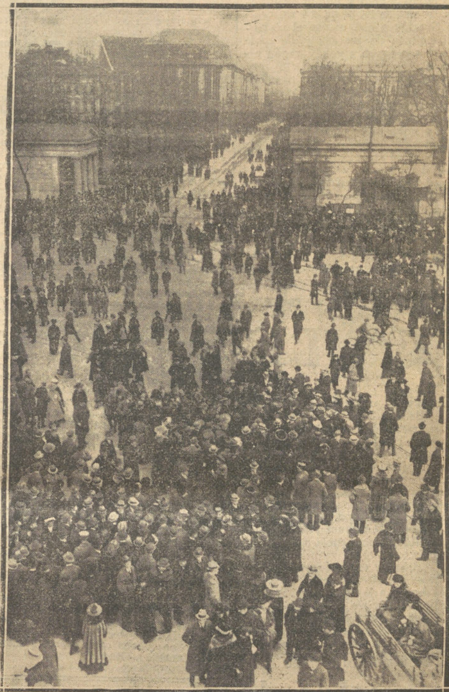
LA REVOLUCION EN ALEMANIA.—LA GENTE COMENTANDO LOS SUCESOS DEL GOLPE DE ESTADO, EN LA POTSDAMER PLATZ.

El punto culminante está en la cita del mismo mensaje que han dirigido a sus conciudadanos en 3 de enero último los jefes de los Estados del Imperio británico: primer ministro de In-