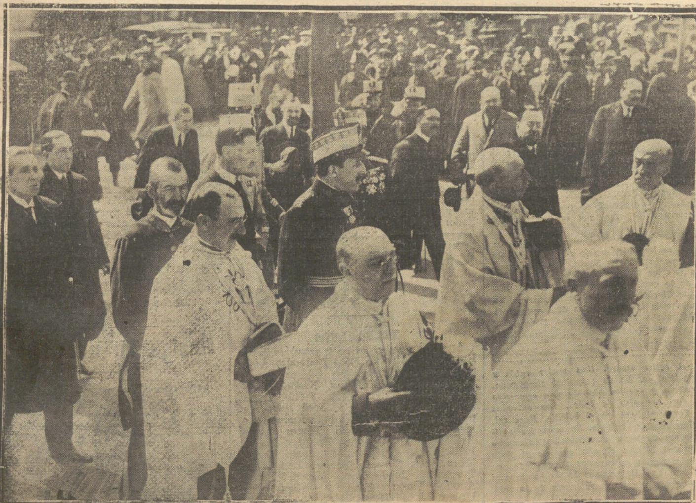
EL VIERNES SANTO EN MADRID.—SU MAJESTAD EL REY SALIENDO DE LA IGLESIA DE LAS TRINITARIAS DESPUES DE ASISTIR A LOS OFICIOS DEL VIERNES SANTO.

LAS NOTICIAS, AVISOS Y COMUNICACIONES NO ADMINISTRATIVAS DEBE DIRIGIRSE A NUESTRA REDACCION JARDINES, 4 AL 8