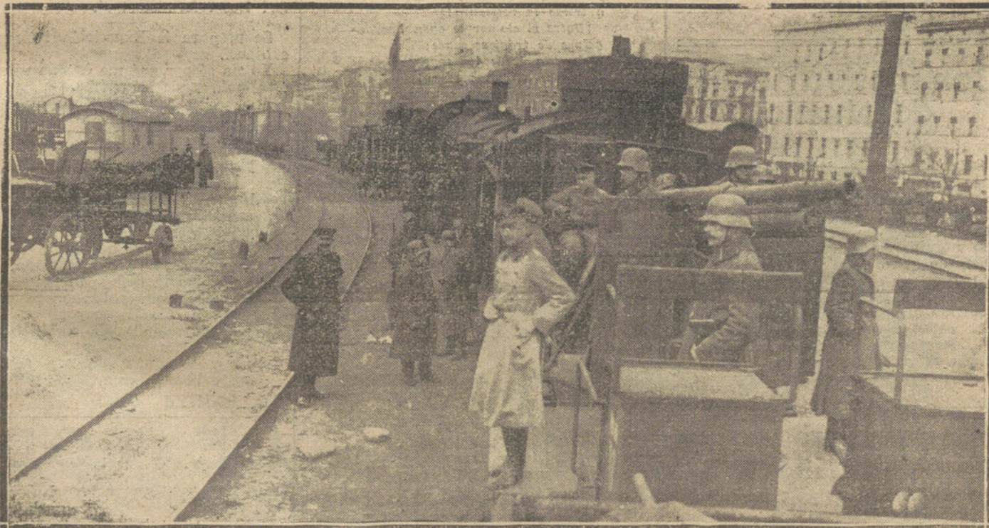
LA REVOLUCION EN ALEMANIA.—TREN BLINDADO, APROVECHADO POR LOS REVOLUCIONARIOS PARA LA DEFENSA DE BERLIN

laterra, mister Lloyd George, por la Gran Bretaña; sir Robert Borden, por el Canadá; mister W. J. Massey, por Nueva Zelanda, y mister R. A. Squires, por Terranova. Oye lo que dicen tan grandes políticos: