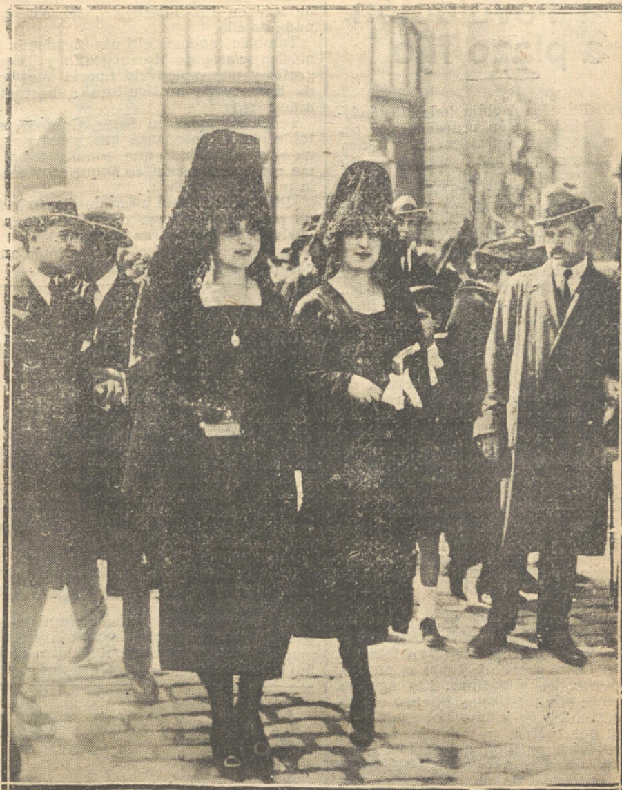
EL VIERNES SANTO EN MADRID—A LA HORA DE LA PROCESION.