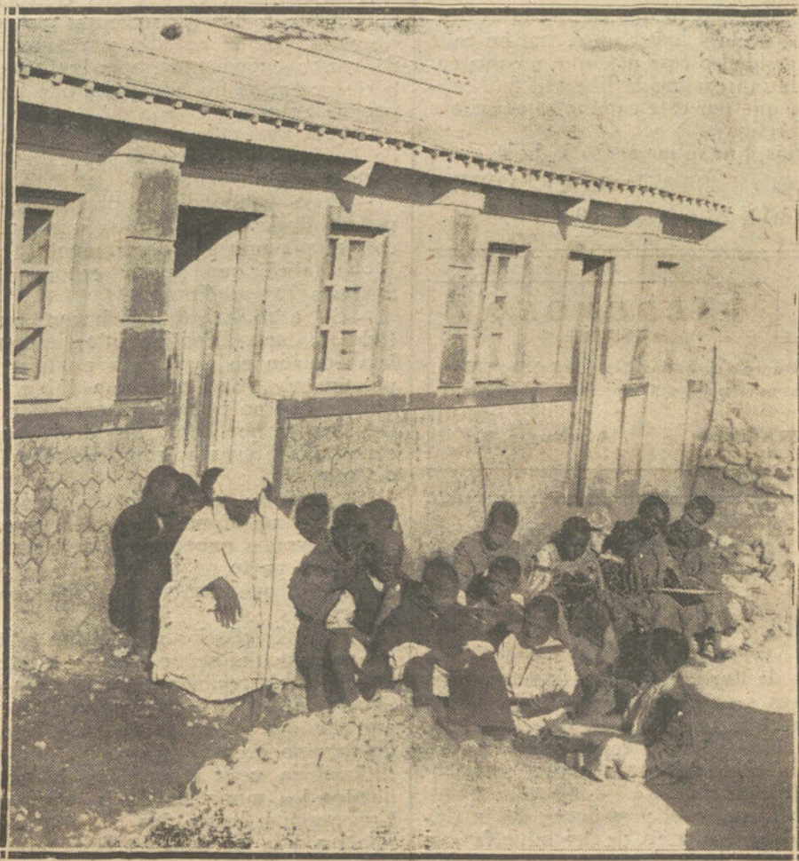
ENSEÑA ACCIÓN EN AFRICA.—LOS ALUMNOS DE LA ESCUELA INDIGENA DE LA LOZABA ZELUAN, A LA PUERTA DEL EDIFICIO RECIENTE INAUGURADO.

Hay otro sistema que ha descubierto un profesor antimemorista. Ha leído que los discípulos son los que lo han de hacer todo, y no el profesor; pero que no han de hacerlo con la memoria, sino con la inteligencia. Y, efectivamente, él no les explica nada. Les manda hacer trabajos, y allá ellos. Suponte que se trata de Literatura. Yo explicaría, por