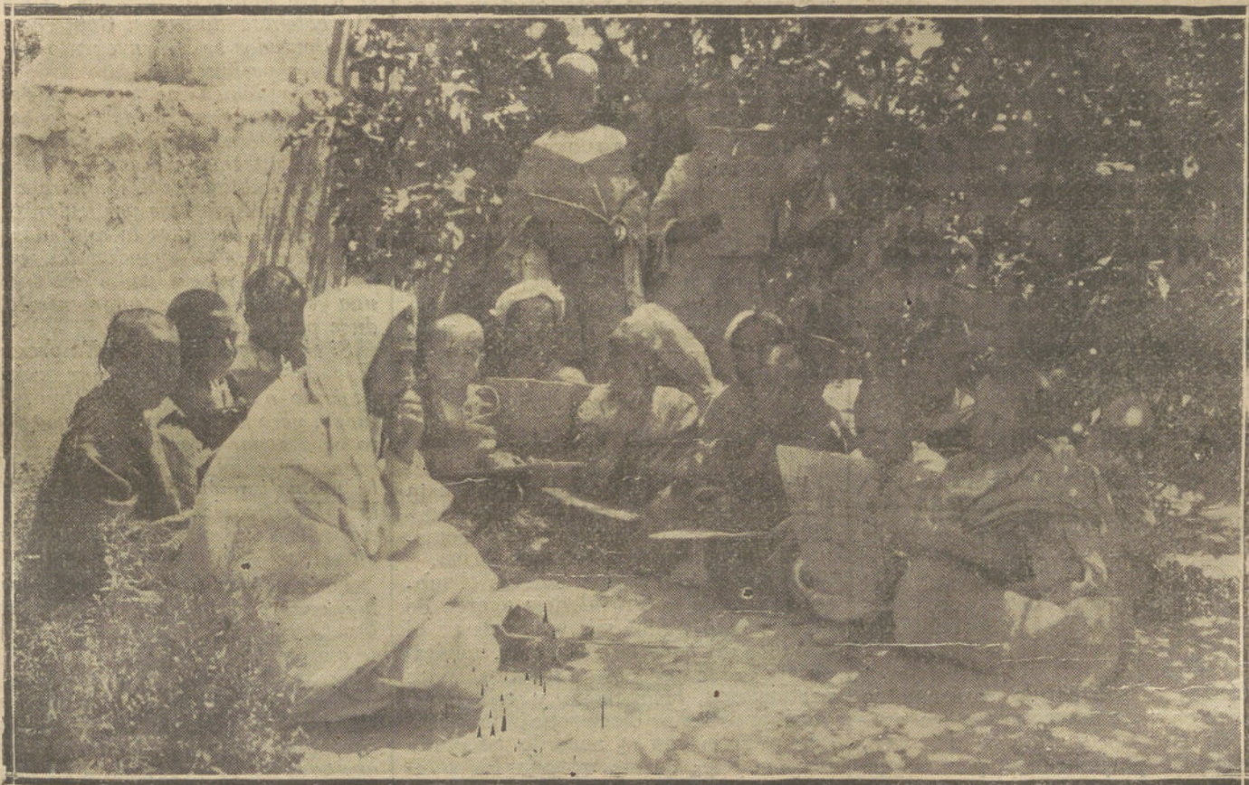
ENSEÑA ACCIÓN EN AFRICA.—LOS ALUMNOS DE LA ESCUELA INDIGENA DE MONTE-ASMIT, LEYENDO LOS VERSICULOS DEL KORAN EN EL PATIO DE LA ESCUELA.