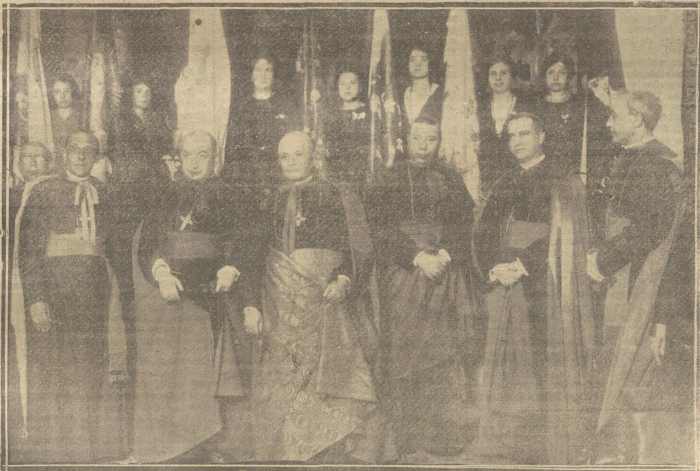
EL NUNCIO DE SU SANTIDAD Y DEMAS PRELADOS, EN LA SOLEMNE BENDICION DE LA NUEVA BANDERA DEL CENTRO CATOLICO MENINO DE LA INMACULADA.

Todos los días, a las seis y media y diez y media, tomando parte notables y bellas artistas. Por la tarde, té aristocrático. Por la noche, terminado el espectáculo, brillante «Souper-tango». Servicio de coches y automóviles. Tranvías números 22, 27, 39 y 41.