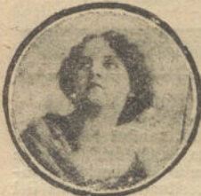
Nombre y dirección muy claros.

REMITIENDO 10 PESETAS SE ENVIA MUESTRO A LOS AGENTES