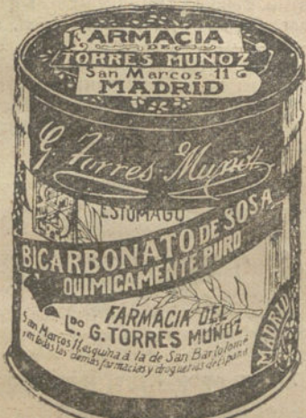
LATAS ECONOMICAS DE 1 1/2 KILOS

Convocatoria septiembre próximo, más numerosa que la actual. ACADEMIA CALDERON DE LA BARCA ABADA, 11, MADRID. Magnífico internado.