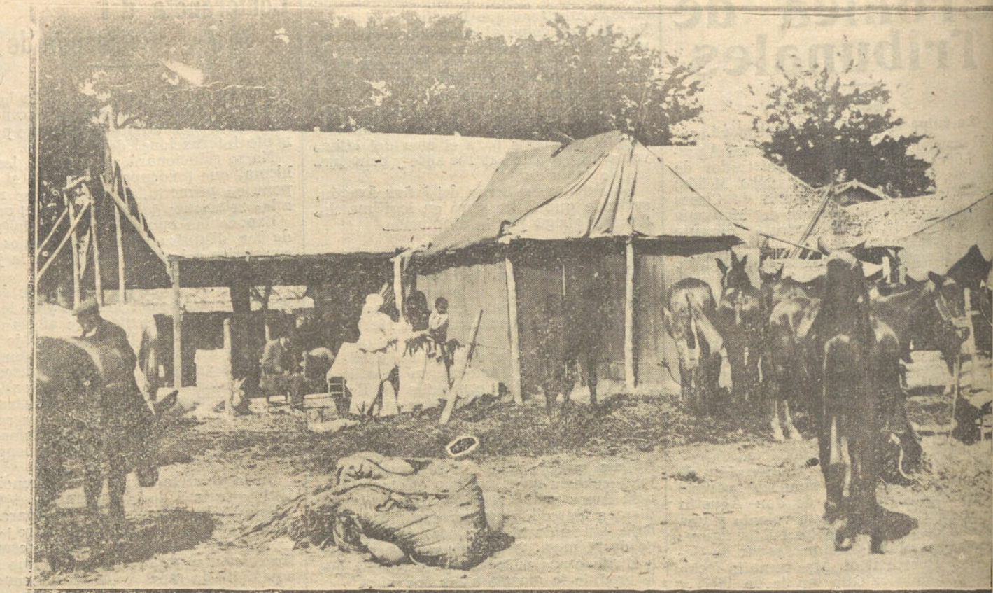
LA FERIA DE SEVILLA.—UN DETALLE DE LAS CASITAS Y TINGLADOS, INSTALADOS POR LOS GITANOS PARA LA VENTA DE GANADO.

explicaciones. Hay en esta actitud suya algo contrario al último discurso que el primer ministro inglés pronunció en la Cámara de los Comunes.