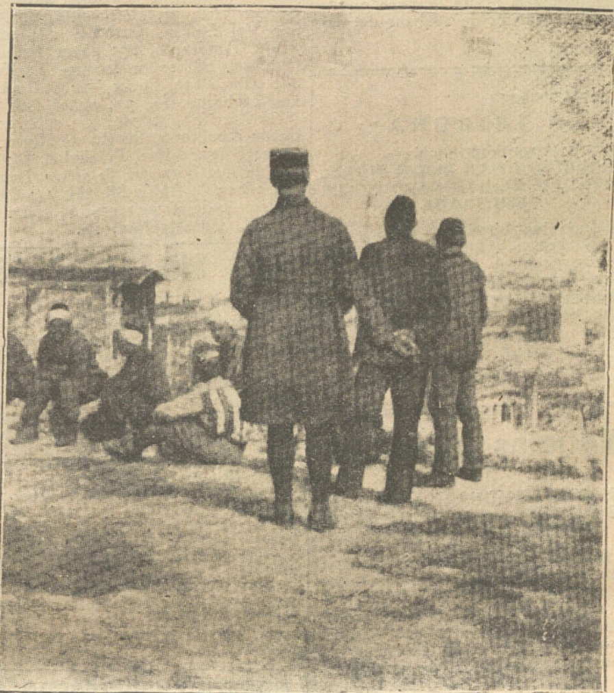
LOS ALIADOS EN ORIENTE.—OFICIALES FRANCESES Y GRUPO DE SOLDADOS TURCOS, VIGILANDO LAS ALTURAS DE STAMBOUL, EN CUMPLIMIENTO DE UNA DE LAS BASES DEL TRATADO DE PAZ.

¿Cómo puede convenirse a nadie que meses después es una solución un