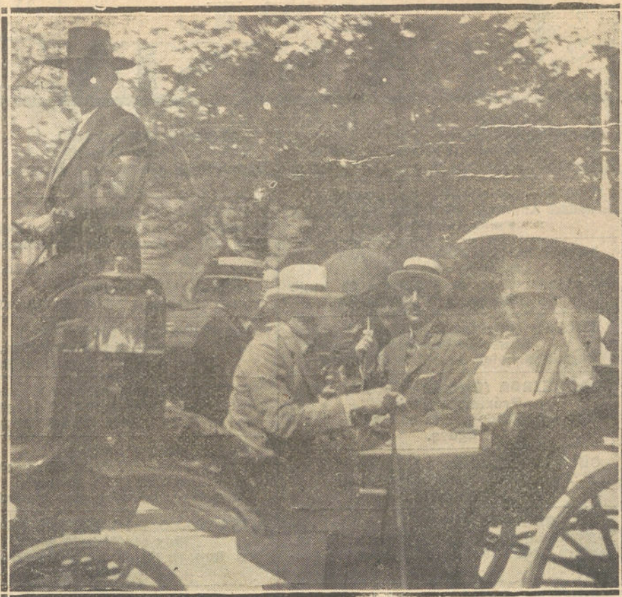
LA FERIA DE SEVILLA.—LA PRINCESA DE METTERNIK Y LADY ASTOR, CON EL DUQUE DE ALBA, PASEANDO POR EL REAL DE LA FERIA.

Se espera que los huelguistas empezarán a trabajar el lunes.