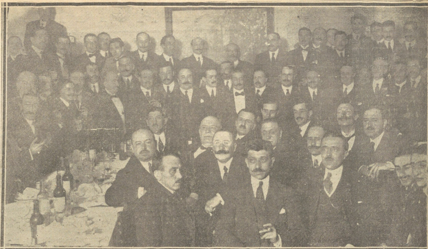
BAQUETE OFRECIDO ANOCHE POR EL PERSONAL TECNICOADMINISTRATIVO Y AUXILIAR DEL MINISTERIO DE GRACIA Y JUSTICIA A LOS DIPUTADOS Y SENADORES QUE DEFENDIERON SUS DERECHOS AL DISCUTIRSE EN LAS CORTES EL PRESUPUESTO DE ESTE DEPARTAMENTO. (FOT. VIDAL)

LAS NOTICIAS, AVISOS Y COMUNICACIONES NO ADMINISTRATIVAS DEBEN DIRIGIRSE A NUESTRA REDACCION, JARDINES, 4 AL 2