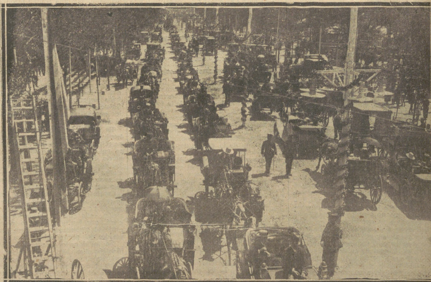
LA FERIA DE SEVILLA.—UN DETALLE DEL PASEO DE COCHES EN EL REAL DE LA FERIA.

MEJICO. El cuartel general de fuerzas de Sonora comunica que los tados de Sinaloa, Zacatecas, Morelia, Hidalgo y Tlaxcala se han unido a nora en la insurrección contra el gobierno.—C.