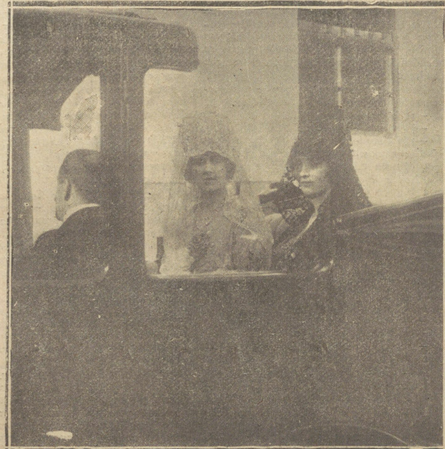
LA FERIA DE SEVILLA.—SU MAJESTAD LA REINA VICTORIA, CON SUS HERMANOS, LOS MARQUESES DE CARISBROOKE, AL SALIR DE LA PLAZA DE TOROS