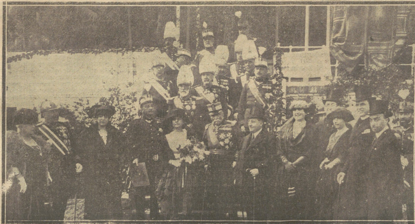
LA JURA DE LA BANDERA EN EL REGIMIENTO DE SABOYA.—LAS AUTORIDADES E INVITADOS, PRESENCIANDO LA CEREMONIA VERIFICADA AYER EN EL HIPODROMO.

Para cualquier acto que se realice están dispuestas las referidas clases de los tres apostaderos y buques de la escuadra.